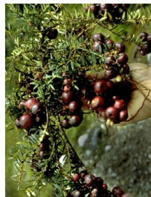
68 Pernettya prostrata