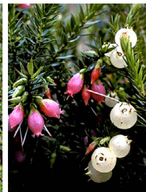
29 Disterigma empetrifolium