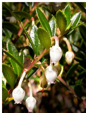
66 Pernettya prostrata