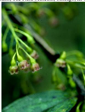
22 Diogenesia racemosa