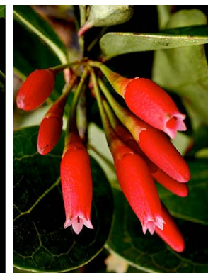
70 Polyclita turbinata