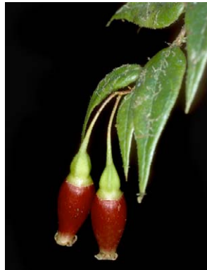
94 Themistoclesia peruviana