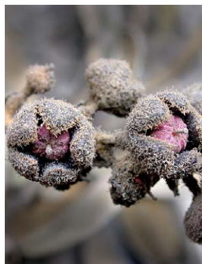
51 Gaultheria eriophylla var. mucronata