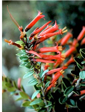
13 Demosthenesia mandoni