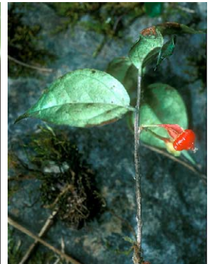
95 Themistoclesia unduavensis