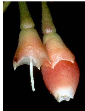
78 Satyria boliviana