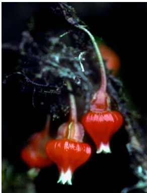
96 Themistoclesia unduavensis