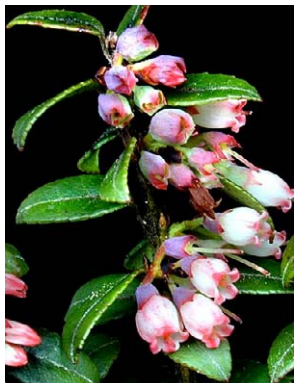
119 Vaccinium floribundum