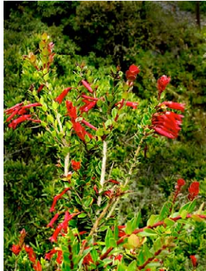
12 Demosthenesia mandoni