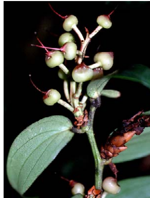
8 Cavendishia bracteata