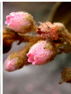
50 Gaultheria eriophylla var. mucronata