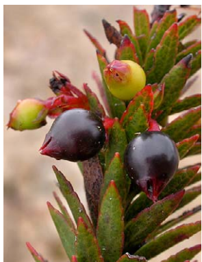
114 Vaccinium crenatum