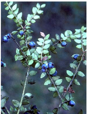
120 Vaccinium floribundum