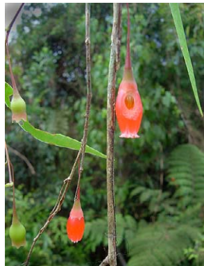
99 Thibaudia "acacioides"