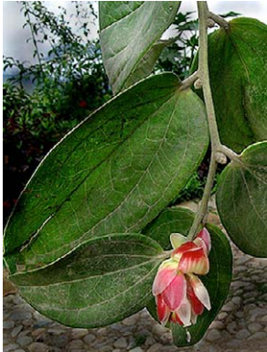
11 Cavendishia pubescens