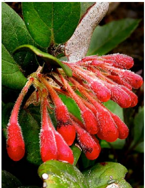
105 Thibaudia densiflora