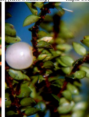
24 Disterigma acuminatum