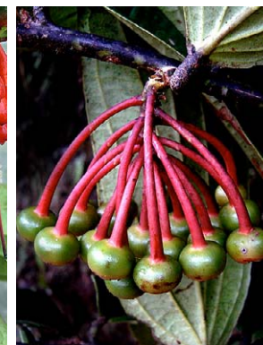
75 Psammisia ulbrichiana