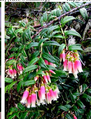
64 Orthaea ignea