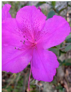
77 Rhododendron simsii [cult. Asia]