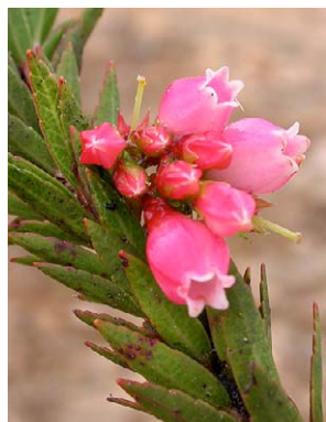
112 Vaccinium crenatum