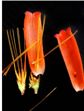
18 Demosthenesia spectabilis