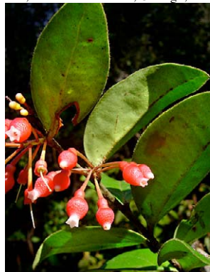
102 Thibaudia crenulata