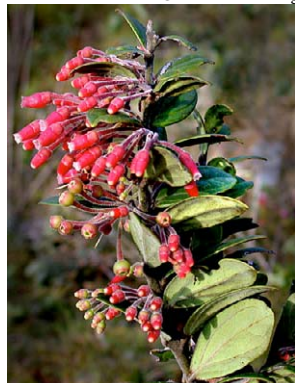
101 Thibaudia crenulata

Photos by: P. Pedraza, J. L. Luteyn, E. Ortiz, and others as noted. Produced by: R. Foster, S. Shattuck, T. Wachter with support from Ellen Hyndman Fund, Mellon Foundation, Moore Foundation. © J. L. Luteyn [jluteyn@nybg.org] & P. Pedraza-P. [ppedraza@nybg.org] NYBG, Bronx, NY 10458-5126 USA. Web page for Ericaceae: www.nybg.org/bsci/res/lut2 ; with support of NSF. © Environmental & Conservation Programs, The Field Museum, Chicago, IL 60605 USA. [www.fmnh.org/plantguides] [RRC@fmnh.org] Rapid Color Guide # 239 version 1. 12/2007