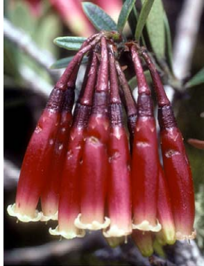
82 Siphonandra elliptica