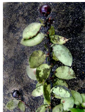
33 Disterigma ovatum