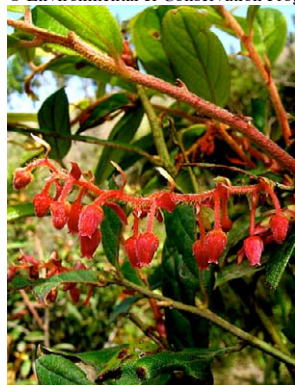
41 Gaultheria bracteata

Producido por: R. Foster, S. Shattuck y T. Wachter con el apoyo de Ellen Hyndman Fund, Mellon Foundation, y Moore Foundation. © J. L. Luteyn [jluteyn@nybg.org] & P. Pedraza-P. [ppedraza@nybg.org] NYBG, Bronx, NY 10458-5126 USA Página Web para Ericaceae: www.nybg.org/bsci/res/lut2 ; con el apoyo de NSF. © Environmental & Conservation Programs, The Field Museum, Chicago, IL 60605 USA. [www.fmn.org/plantguides] [RRC@fmnh.org] Rapid Color Guide # 239 versión 1. 12/2007