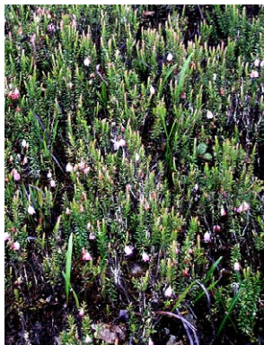
36 Disterigma pernettyoides