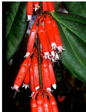
76 Psammisia urichiana