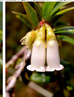
25 Disterigma alaternoides