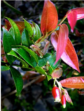
6 Cavendishia bracteata