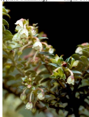
44 Gaultheria buxifolia var. secunda