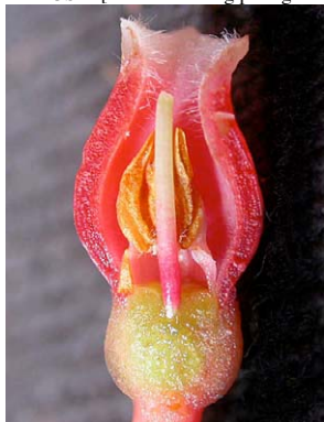
103 Thibaudia crenulata