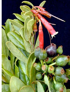
83 Siphonandra elliptica