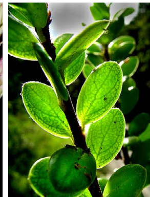
39 Disterigma ulei