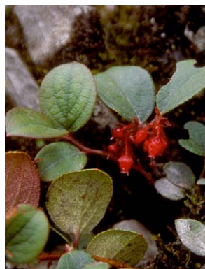
53 Gaultheria hapalotricha