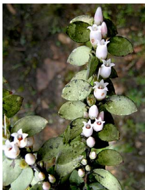
32 Disterigma ovatum