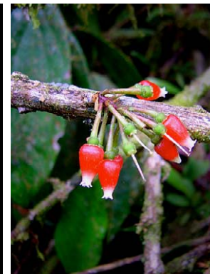
79 Satyria leucostoma