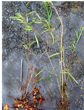
98 Thibaudia "acacioides"