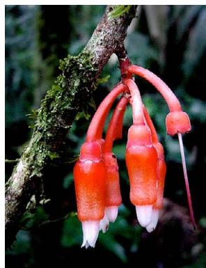
72 Psammisia coarctata