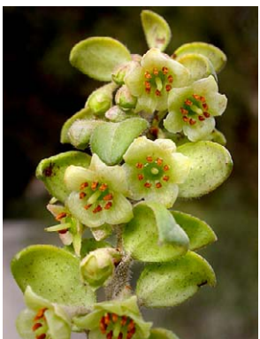
115 Vaccinium dependens