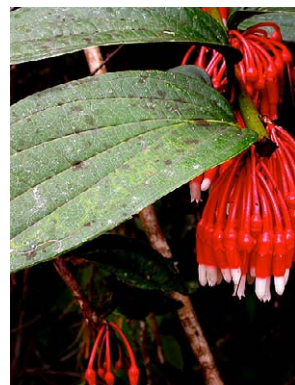
73 Psammisia ulbrichiana