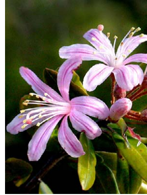
4 Bejaria aestuans