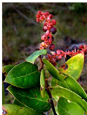
48 Gaultheria erecta