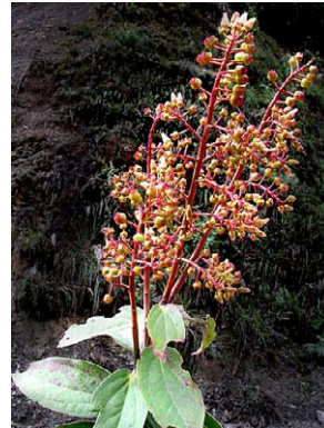
9 Cavendishia martii