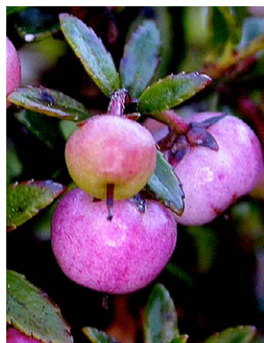
67 Pernettya prostrata