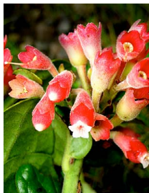
106 Thibaudia densiflora