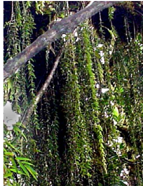
89 Sphyrroserpum sessiliflorum