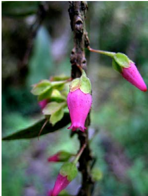
16 Demosthenesia pearcei