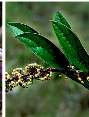
80 Satyria leucostoma