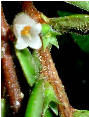
91 Sphyrroserpum sessiliflorum