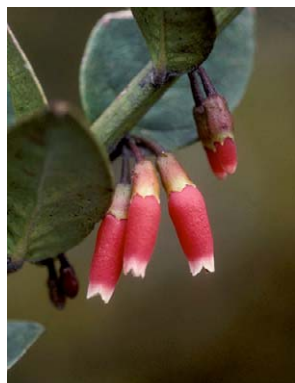
111 Thibaudia macrocalyx