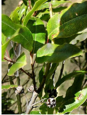
2 Agarista boliviensis