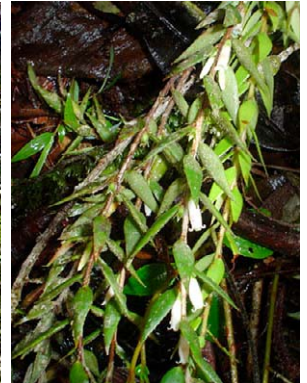
90 Sphyrroserpum sessiliflorum