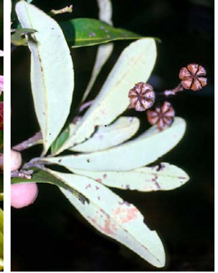
5 Bejaria aestuans