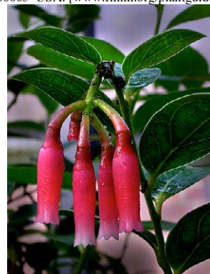
63 Macleania rupestris