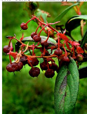
43 Gaultheria bracteata