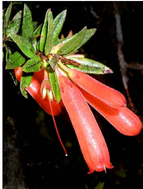
17 Demosthenesia spectabilis