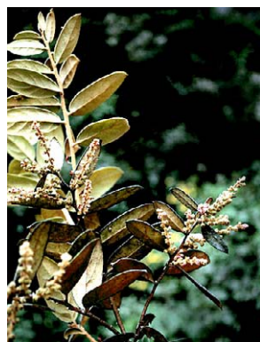
49 Gaultheria eriophylla var. mucronata