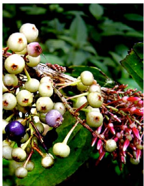
109 Thibaudia floribunda