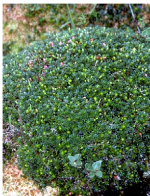
27 Disterigma empetrifolium