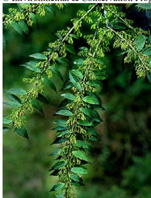
21 Diogenesia racemosa foto: J.L. Luteyn

Photos by: P. Pedraza, J. L. Luteyn, E. Ortiz, and others as noted. Produced by: R. Foster, S. Shattuck, T. Wachter with support from Ellen Hyndman Fund, Mellon Foundation, Moore Foundation. © J. L. Luteyn [jluteyn@nybg.org] & P. Pedraza-P. [ppedraza@nybg.org] NYBG, Bronx, NY 10458-5126 USA. Web page for Ericaceae: www.nybg.org/bsci/res/lut2 ; with support of NSF. © Environmental & Conservation Programs, The Field Museum, Chicago, IL 60605 USA. [www.fmh.org/plantguides] [RRC@fmnh.org] Rapid Color Guide # 239 version 1. 12/2007