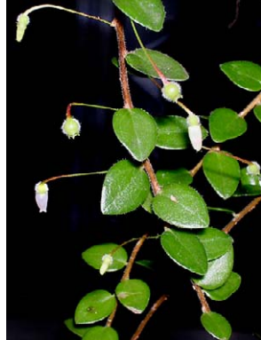
84 Sphyrroserpum buxifolium