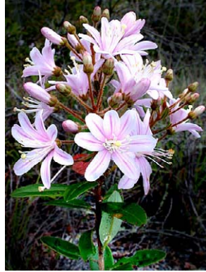
3 Bejaria aestuans