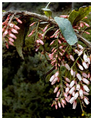
107 Thibaudia floribunda