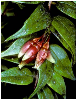
92 Themistoclesia peruviana