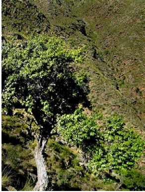
1 Agarista boliviensis

Fotos de P. Pedraza, J. L. Luteyn, E. Ortiz, y otros anotado. Producido por: R. Foster, S. Shattuck y T. Wachter con el apoyo de Ellen Hyndman Fund, Mellon Foundation, y Moore Foundation. © J. L. Luteyn [jluteyn@nybg.org] & P. Pedraza-P. [ppedraza@nybg.org] NYBG, Bronx, NY 10458-5126 USA Página Web para Ericaceae: www.nybg.org/bsci/res/lut2 ; con el apoyo de NSF. © Environmental & Conservation Programs, The Field Museum, Chicago, IL 60605 USA. [www.fmnh.org/plantguides] [RRC@fmnh.org] Rapid Color Guide # 239 versión 1. 12/2007