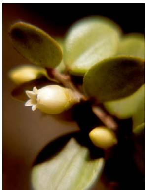
31 Disterigma ollacheum