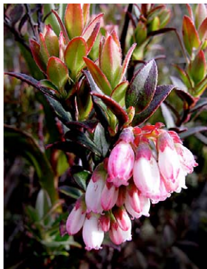
118 Vaccinium floribundum