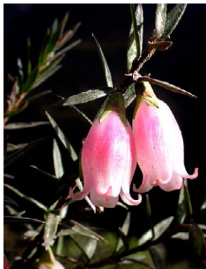
37 Disterigma pernettyoides