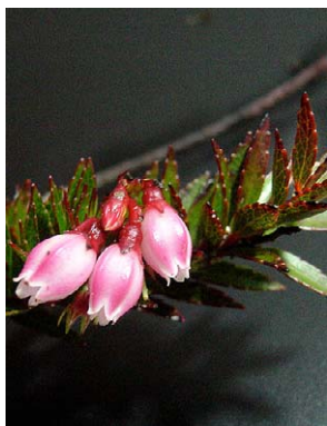
113 Vaccinium crenatum