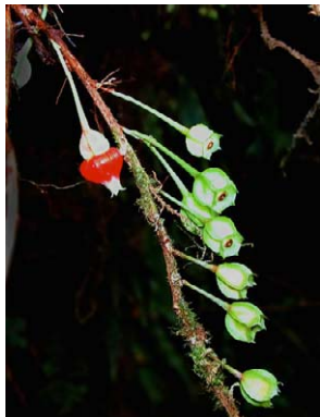
97 Themistoclesia unduavensis