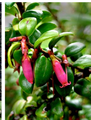
34 Disterigma pallidum