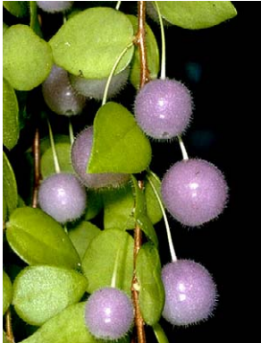
86 Sphyrroserpum buxifolium