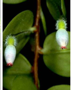
85 Sphyrroserpum buxifolium