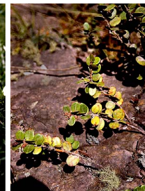
30 Disterigma ollacheum