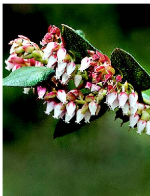
52 Gaultheria glomerata