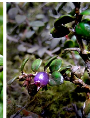
35 Disterigma pallidum