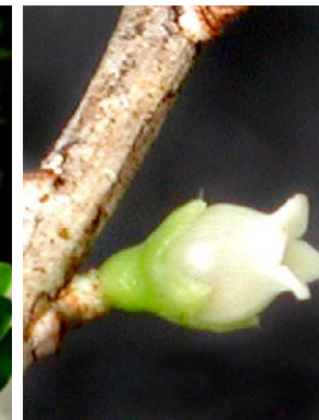
40 Disterigma ulei