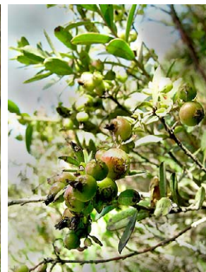
60 Gaylussacia cardenasii