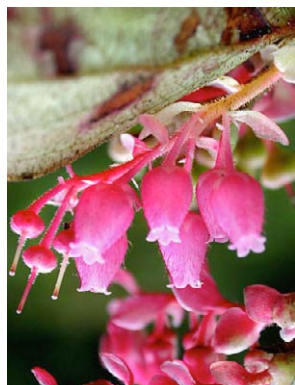
46 Gaultheria erecta