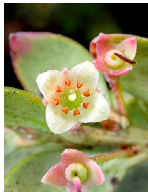
116 Vaccinium dependens