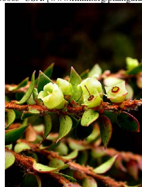
23 Disterigma acuminatum