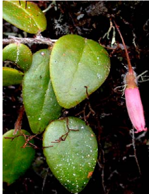
87 Sphyrroserpum cordifolium