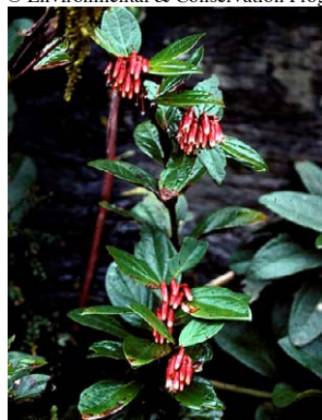
61 Macleania rupestris foto: J.L. Luteyn

Photos by: P. Pedraza, J. L. Luteyn, E. Ortiz, and others as noted. Produced by: R. Foster, S. Shattuck, T. Wachter with support from Ellen Hyndman Fund, Mellon Foundation, Moore Foundation. © J. L. Luteyn [jluteyn@nybg.org] & P. Pedraza-P. [ppedraza@nybg.org] NYBG, Bronx, NY 10458-5126 USA. Web page for Ericaceae: www.nybg.org/bsci/res/lut2 ; with support of NSF. © Environmental & Conservation Programs, The Field Museum, Chicago, IL 60605 USA. [www.fmh.org/plantguides] [RRC@fmnh.org] Rapid Color Guide # 239 version 1. 12/2007