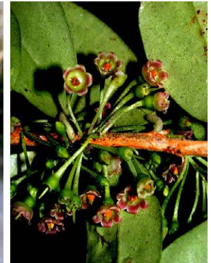
20 Diogenesia boliviana