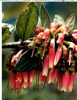
62 Macleania rupestris