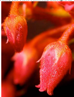
42 Gaultheria bracteata