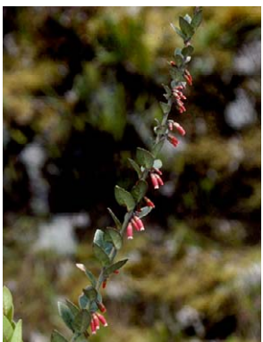
110 Thibaudia macrocalyx