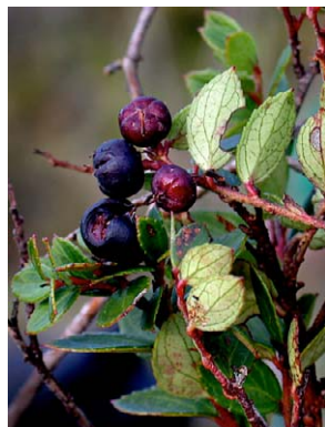
58 Gaultheria vaccinioides