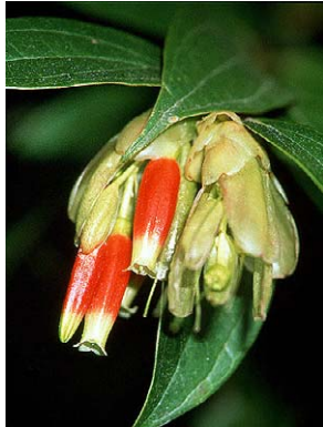
7 Cavendishia bracteata