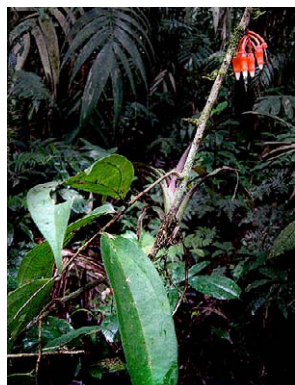
71 Psammisia coarctata