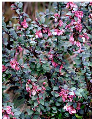
117 Vaccinium floribundum