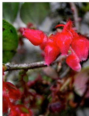
54 Gaultheria hapalotricha