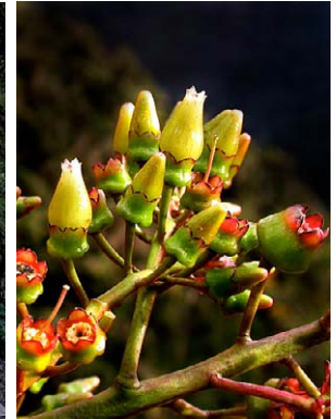
10 Cavendishia martii