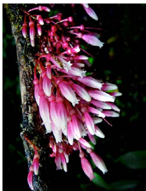
108 Thibaudia floribunda