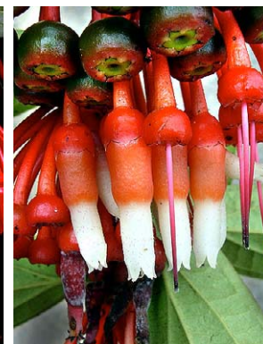
74 Psammisia ulbrichiana