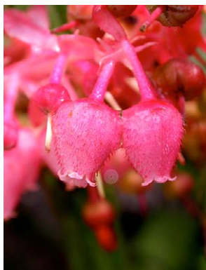
47 Gaultheria erecta