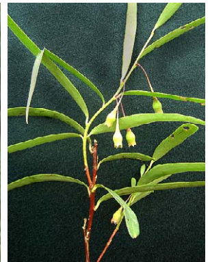
100 Thibaudia "acacioides"