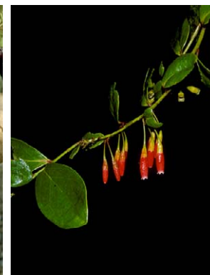
69 Polyclita turbinata