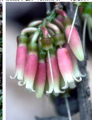
65 Orthaea ignea