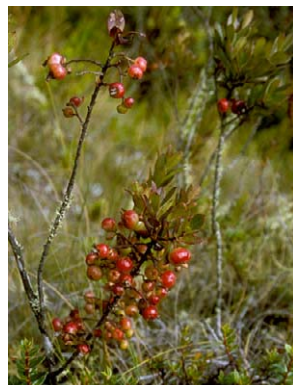
59 Gaylussacia cardenasii