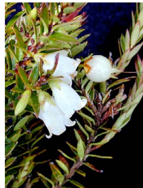
38 Disterigma pernettyoides