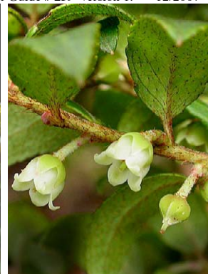
45 Gaultheria buxifolia var. secunda