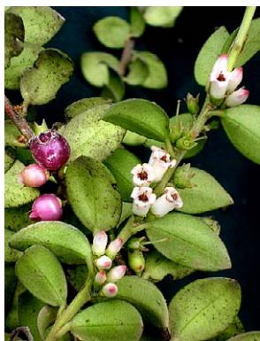
26 Disterigma alaternoides