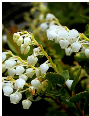
56 Gaultheria reticulata