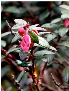
57 Gaultheria vaccinioides