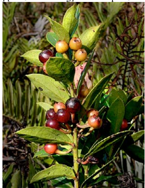
104 Thibaudia crenulata