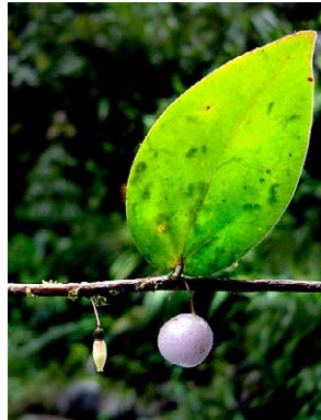
88 Sphyrroserpum cordifolium