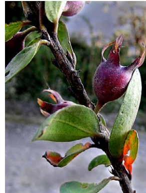
19 Demosthenesia spectabilis