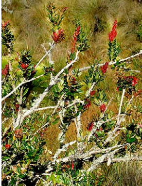
81 Siphonandra elliptica

Fotos de P. Pedraza P, J. L. Luteyn, E. Ortiz, y otros anotado. Producido por: R. Foster, S. Shattuck y T. Wachter con el apoyo de Ellen Hyndman Fund, Mellon Foundation, y Moore Foundation. © J. L. Luteyn [jluteyn@nybg.org] & P. Pedraza-P. [ppedraza@nybg.org] NYBG, Bronx, NY 10458-5126 USA Página Web para Ericaceae: www.nybg.org/bsci/res/lut2 ; con el apoyo de NSF. © Environmental & Conservation Programs, The Field Museum, Chicago, IL 60605 USA. [www.fmnh.org/plantguides] [RRC@fmnh.org] Rapid Color Guide # 239 versión 1. 12/2007