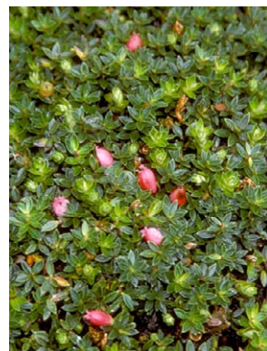
28 Disterigma empetrifolium