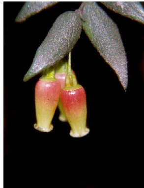
93 Themistoclesia peruviana