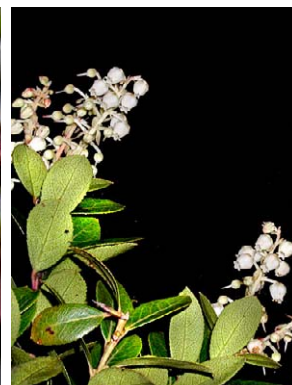
55 Gaultheria reticulata