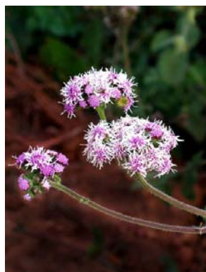
20 Conocliniopsis prasiifolia