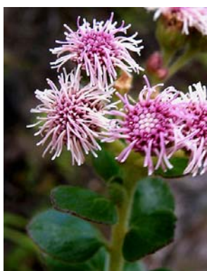
59 Stylotrichium corymbosum