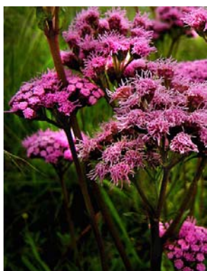
27 Gyptis pinnatifida