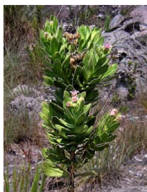
56 Semiria viscosa