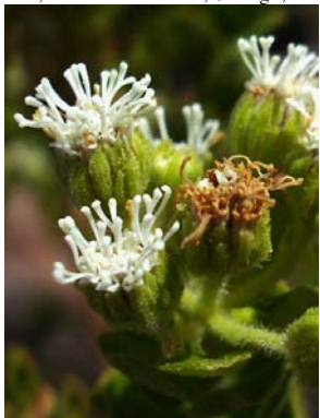
62 Stylotrichium rotundifolium