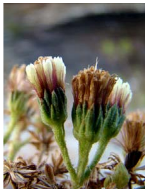
75 Eupatorieae - gen. nov. 1