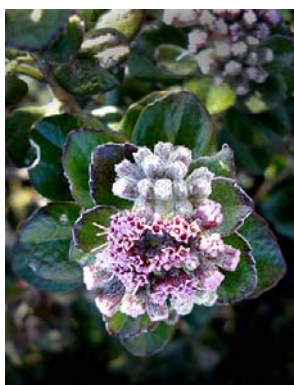
32 Lasiolaena blanchetti