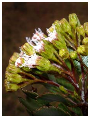
10 Bahianthus viscosus