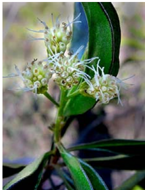
50 Morithamnus ganophyllus