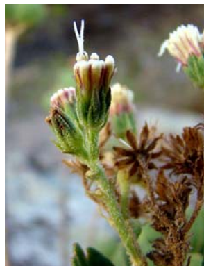
74 Eupatorieae - gen. nov. 1