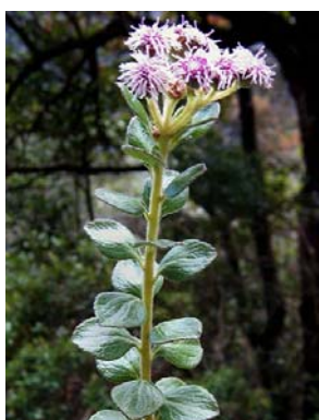
58 Stylotrichium corymbosum