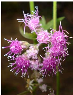
66 Trichogonia salviifolia