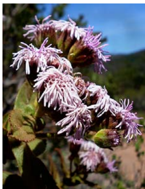
53 Semiria sp. nov.