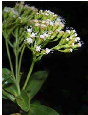
46 Lithothamnus ellipticus