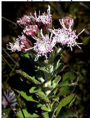
44 Lasiolaena santosii