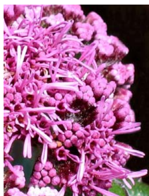
34 Lasiolaena blanchetti