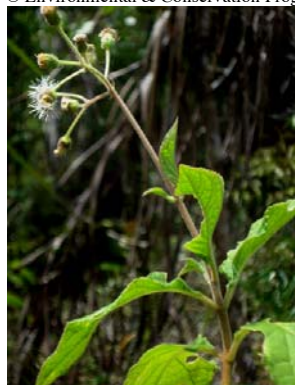
21 Diacranthera ulei

© Environmental & Conservation Programs, The Field Museum, Chicago, IL 60605 USA [ rrc@fieldmuseum.org ] [ www.fnmh.org/plantguides/ ] Rapid Color Guide # 265 versão 1 05/2010