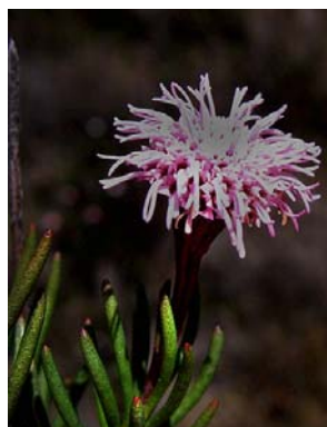
79 Eupatorieae - gen. nov. 2