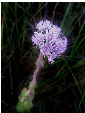
13 Barrosoa betonicaeformis