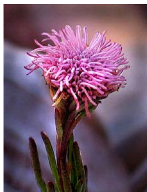
80 Eupatorieae - gen. nov. 2