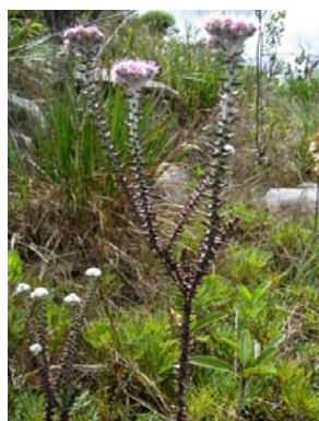
39 Lasiolaena lychnophorioides