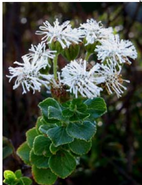
61 Stylotrichium rotundifolium

[ rrc@fieldmuseum.org ] [ www.fmnh.org/plantguides/ ] Rapid Color Guide # 265 versão 1 05/2010