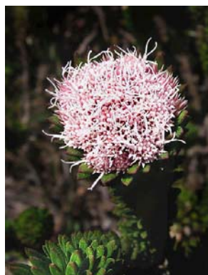
19 Catolesia mentiens