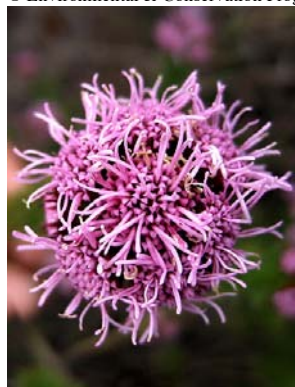
1 Agrianthus empetrifolius

Rapid Color Guide # 265 versão 1 05/2010