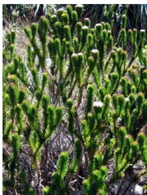
18 Catolesia mentiens