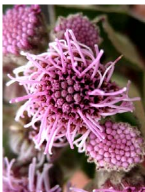
38 Lasiolaena duartei