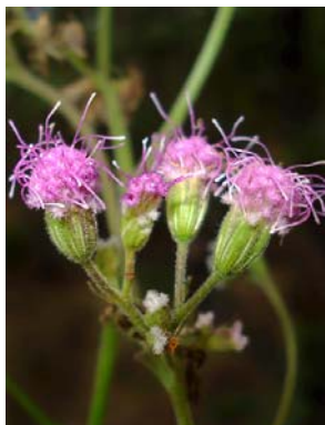
68 Trichogonia salviifolia