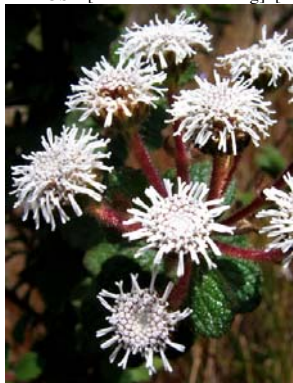
63 Stylotrichium sucrei