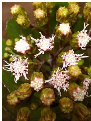
9 Bahianthus viscosus