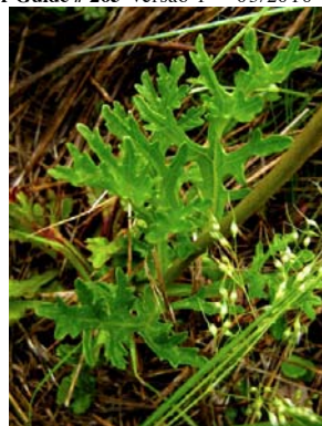
25 Gyptis pinnatifida