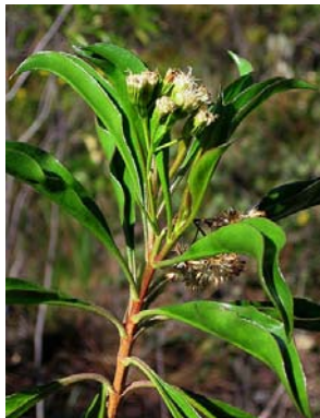
49 Morithamnus ganophyllus