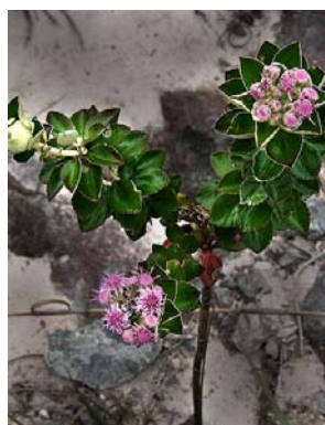
36 Lasiolaena duartei