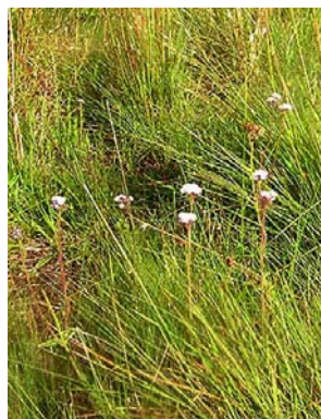
11 Barrosoa betonicaeformis