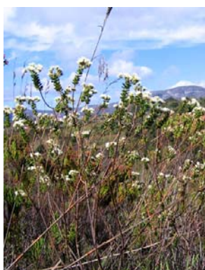
60 Stylotrichium rotundifolium