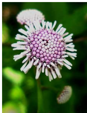
51 Platypodanthera melissaefolia