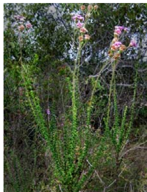
70 Trichogonia tombadorensis