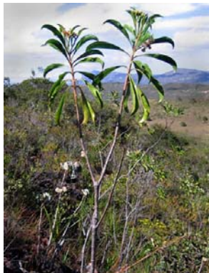
48 Morithamnus ganophyllus