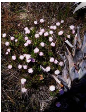
77 Eupatorieae - gen. nov. 2