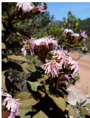
52 Semiria sp. nov.