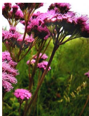
26 Gyptis pinnatifida