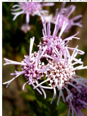
4 Agrianthus leutzelburgii