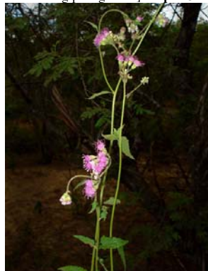
64 Trichogonia salviifolia