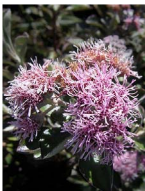
33 Lasiolaena blanchetti