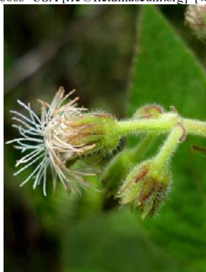
23 Diacranthera ulei