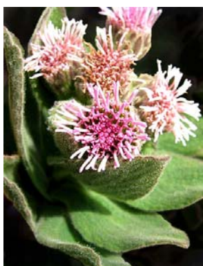
57 Semiria viscosa