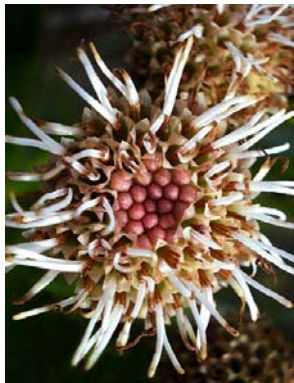
47 Morithamnus crassus