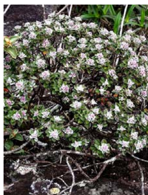
29 Lasiolaena blanchetti