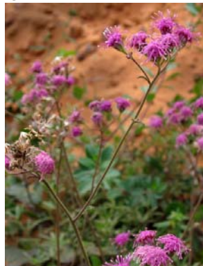
65 Trichogonia salviifolia