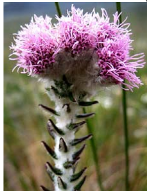
41 Lasiolaena lychnophorioides

© Environmental & Conservation Programs, The Field Museum, Chicago, IL 60605 USA [rrc@fieldmuseum.org] | www.fmn.org/plantguides/ Rapid Color Guide # 265 versão 1 05/2010