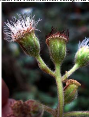
22 Diacranthera ulei