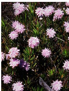
78 Eupatorieae - gen. nov. 2