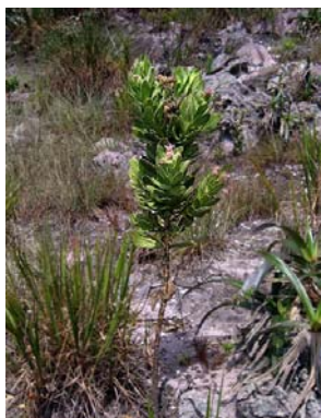
54 Semiria viscosa