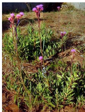
16 Campuloclinium macrocephalum