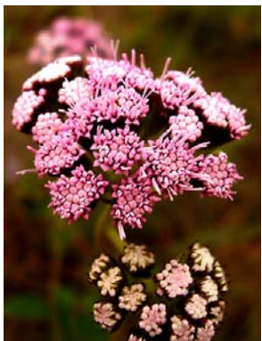
72 Vittetia orbiculata