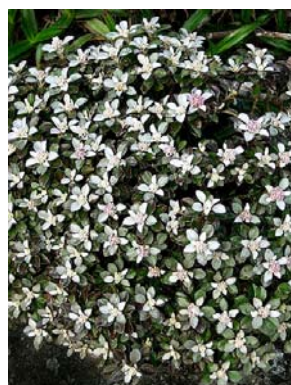
30 Lasiolaena blanchetti