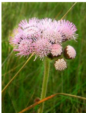
12 Barrosoa betonicaeformis