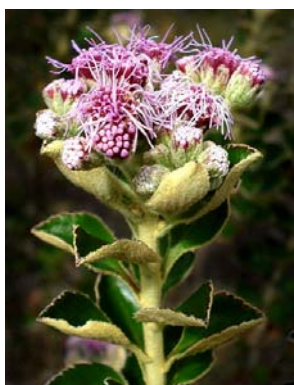
37 Lasiolaena duartei