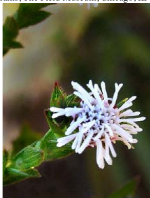
2 Agrianthus giuliettiae