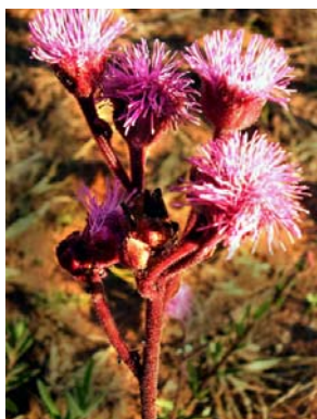
17 Campuloclinium macrocephalum