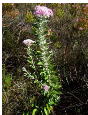
31 Lasiolaena blanchetti