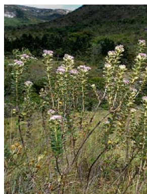
35 Lasiolaena duartei