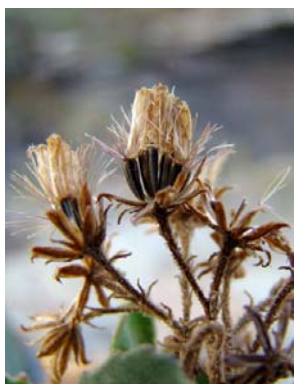
76 Eupatorieae - gen. nov. 1