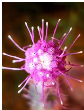
69 Trichogonia salviifolia