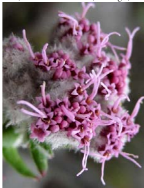
42 Lasiolaena lychnophorioides