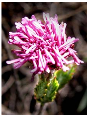
7 Arrajodocharis santosii