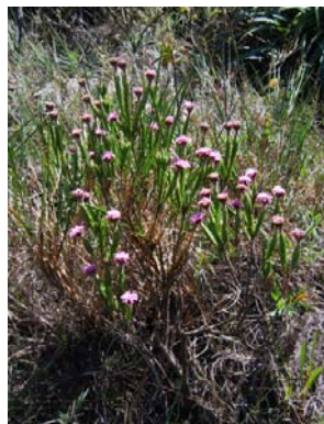
6 Arrajodocharis santosii