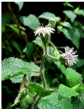
71 Trichogoniopsis adethanta