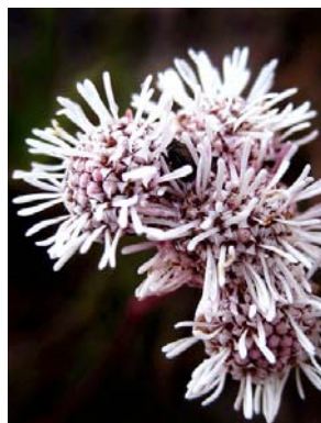
15 Bishopiella elegans