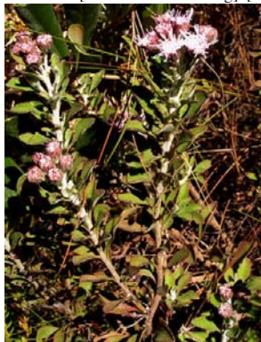
43 Lasiolaena santosii