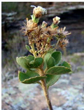
73 Eupatorieae - gen. nov. 1