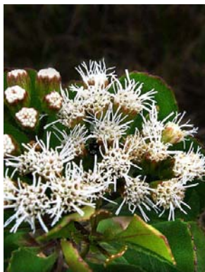
8 Bahianthus viscosus