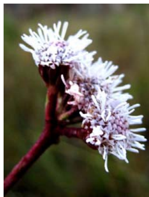
14 Bishopiella elegans