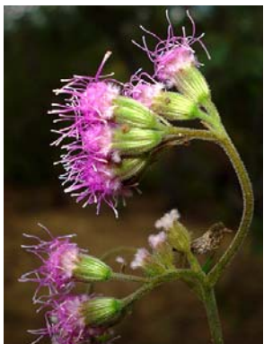
67 Trichogonia salviifolia