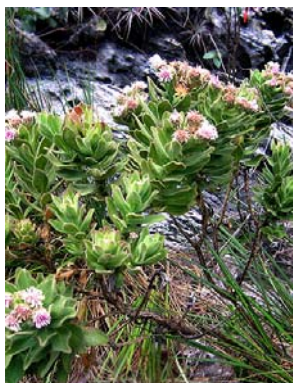
55 Semiria viscosa