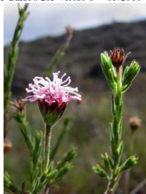
5 Arrajodocharis praxeloides