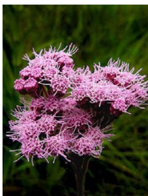
28 Gyptis pinnatifida