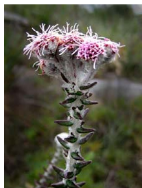
40 Lasiolaena lychnophorioides