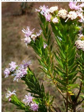
3 Agrianthus leutzelburgii