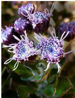
45 Lasiolaena santosii