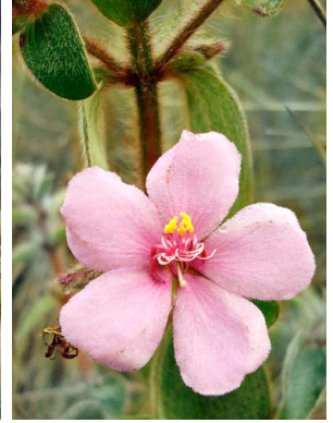
5 Desmoscelis villosa