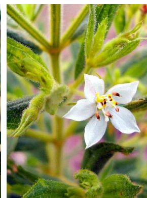
39 Trembleya phlogiformis