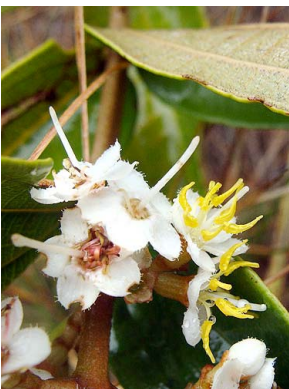
16 Miconia fallax