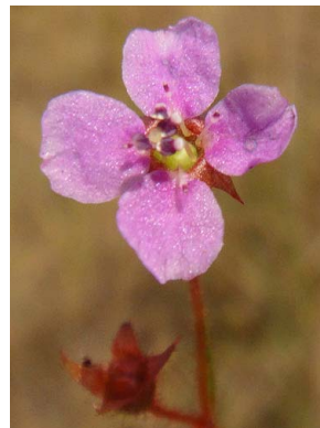
33 Siphanthera foliosa