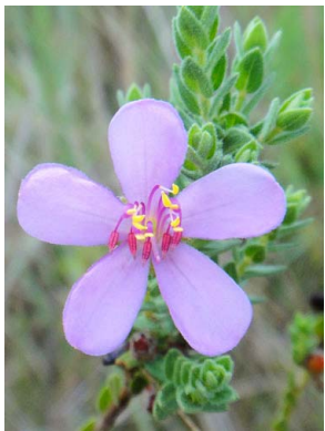
26 Microlicia fasciculata