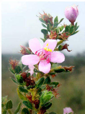
27 Microlicia helvola