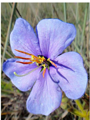
36 Tibouchina gracilis