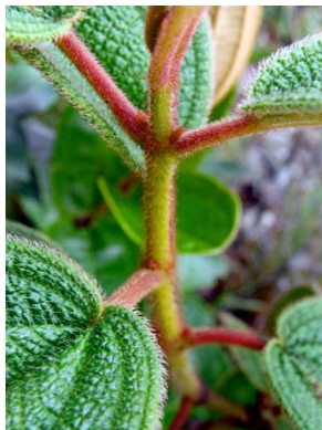
7 Leandra aurea