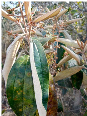
12 Miconia albicans