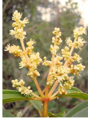
23 Miconia theizans