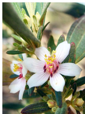
38 Trembleya parviflora