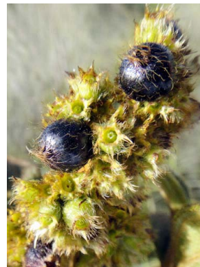
9 Leandra erostrata