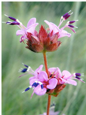
32 Siphanthera cordata