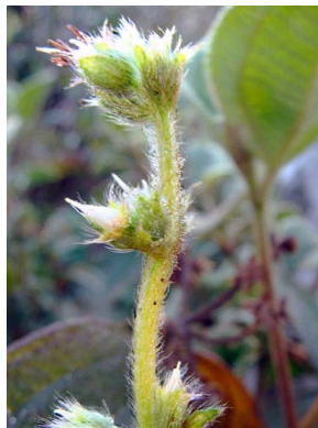
8 Leandra erostrata