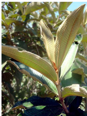
17 Miconia ferruginata