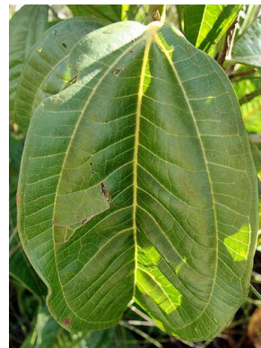
14 Miconia chamissois