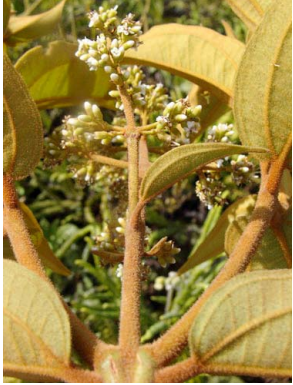
21 Miconia rubiginosa

Rapid Color Guide # 392 versão 1 04/2016