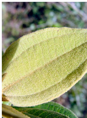
18 Miconia leucocarpa