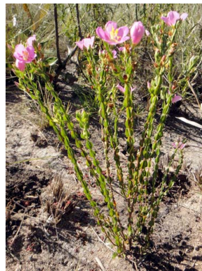
28 Microlicia polystemma