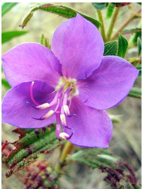
31 Rhynchanthera grandiflora