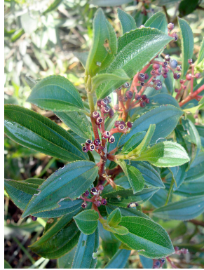
22 Miconia theizans