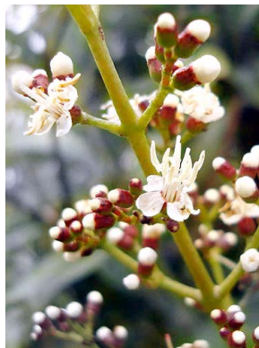
13 Miconia chamissois