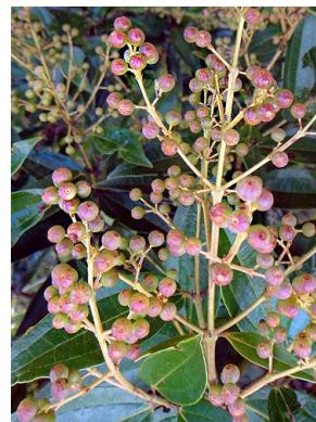
19 Miconia ligustroides