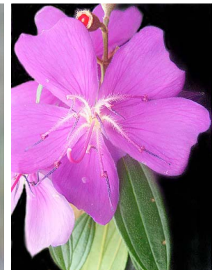
35 Tibouchina candolleana