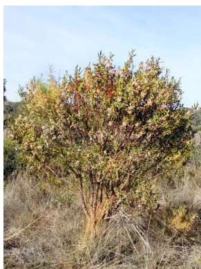
37 Trembleya parviflora