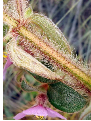
4 Desmoscelis villosa