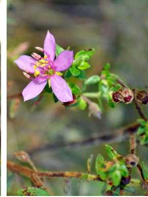
24 Microlicia cordata