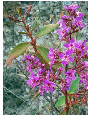
10 Macairea radula