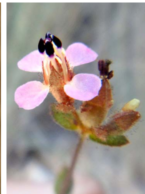
34 Siphanthera gracillima