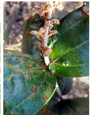
15 Miconia fallax