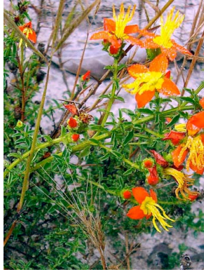
2 Cambessedesia hilariana