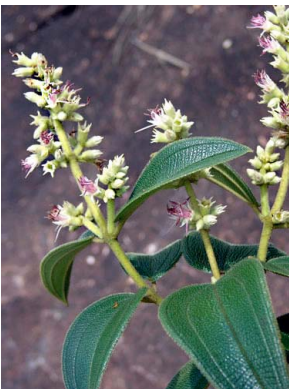
6 Leandra aurea