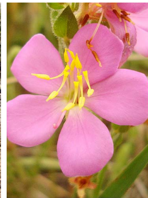
29 Microlicia polystemma