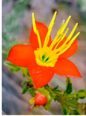
3 Cambessedesia hilariana