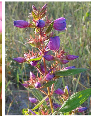
30 Rhynchanthera grandiflora