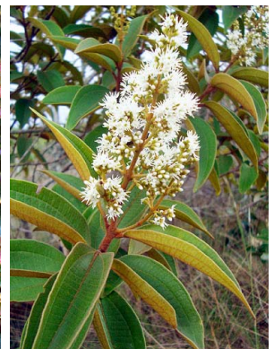
20 Miconia rubiginosa