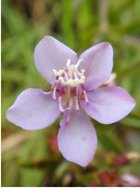
1 Acisanthera variabilis

[http://fieldguides.fieldmuseum.org] [fieldguides@fieldmuseum.org] Rapid Color Guide # 392 versão 1 04/2016