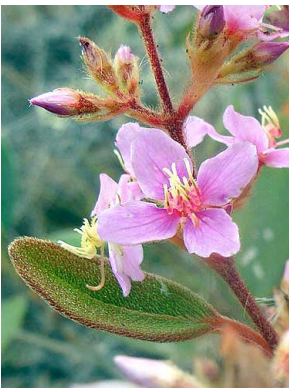
11 Macairea radula