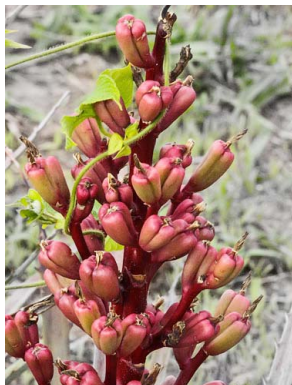
12 Bromelia arenaria