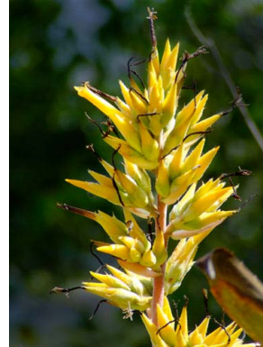
4 Aechmea emmerichia