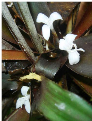
16 Cryptanthus alagoanus