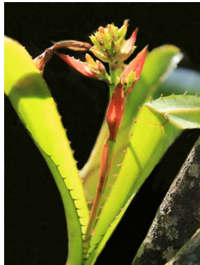
8 Aechmea mertensii