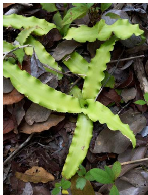
17 Cryptanthus sp. nov.