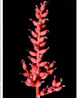
5 Aechmea fulgens