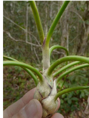
29 Tillandsia bulbosa