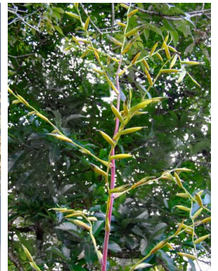
40 Vriesea procera