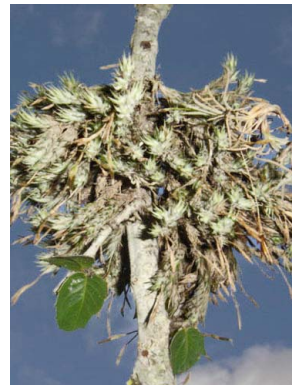
39 Tillandsia tricholepis