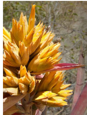
9 Aechmea mulfordii