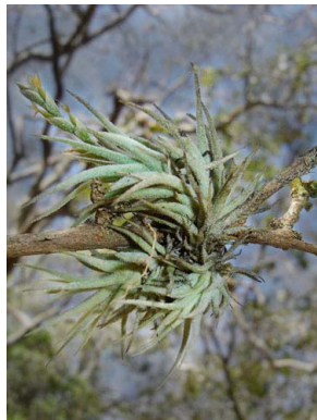
33 Tillandsia loliacea