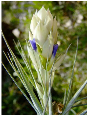
37 Tillandsia stricta