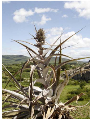
28 Orthophytum jabrense