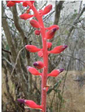
26 Neoglaziovia variegata