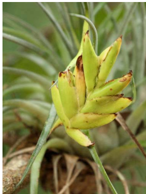
32 Tillandsia kegeliana