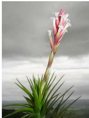
38 Tillandsia tenuifolia