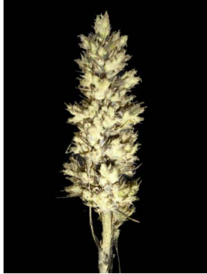
22 Hohenbergia horrida