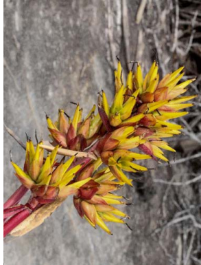
1 Aechmea aquilega

© Ricardo Pontes (ricardoapontes@yahoo.com.br) & Rafaela C. Forzza. Agradecimentos à Márcia T. Aquino & Pedro da C. Gadelha-Neto, Jardim Botânico Benjamin Maranhão, João Pessoa – PB. © Science & Education, The Field Museum, Chicago, IL 60605 USA. [http://fieldguides.fieldmuseum.org] [fieldguides@fieldmuseum.org] Rapid Color Guide # 532 version 1 09/2015