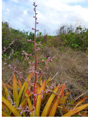
23 Hohenbergia ridleyi