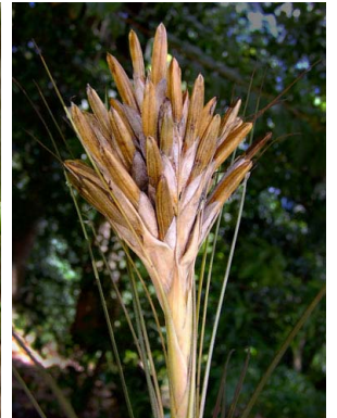
30 Tillandsia juncea