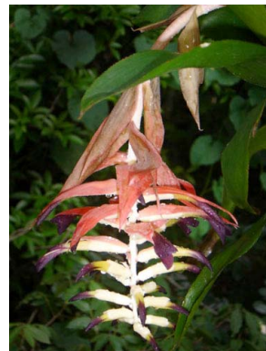
14 Bilbergia morelii