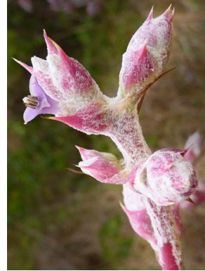
24 Hohenbergia ridleyi