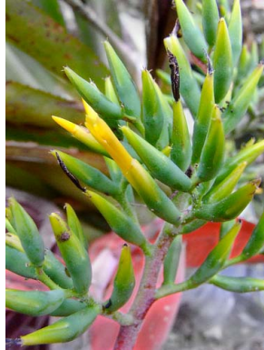
3 Aechmea constantinii