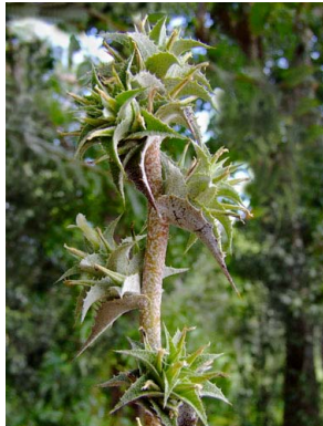
27 Orthophytum disjunctum