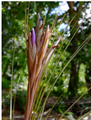
31 Tillandsia juncea