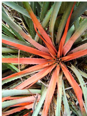
13 Bromelia grandiflora