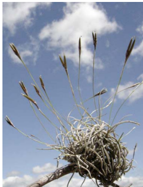
36 Tillandsia recurvata