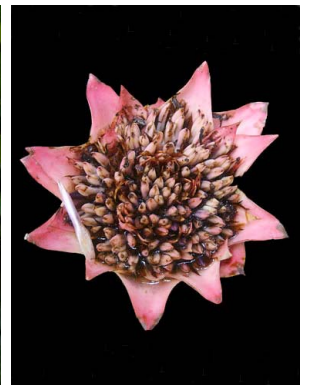
15 Canistrum aurantiacum