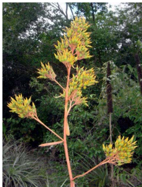
11 Aechmea werdermannii