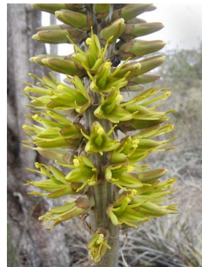
19 Encholirium spectabile