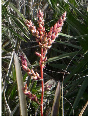
21 Hohenbergia catingae

© Ricardo Pontes (ricardoapontes@yahoo.com.br) & Rafaela C. Forzza. Agradecimentos à Márcia T. Aquino & Pedro da C. Gadelha-Neto, Jardim Botânico Benjamim Maranhão “João Pessoa” – PB. © Science & Education, The Field Museum, Chicago, IL 60605 USA. [http://fieldguides.fieldmuseum.org] [fieldguides@fieldmuseum.org] Rapid Color Guide # 532 version 1 09/2015