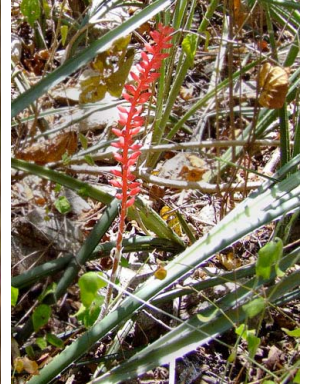
25 Neoglaziovia variegata