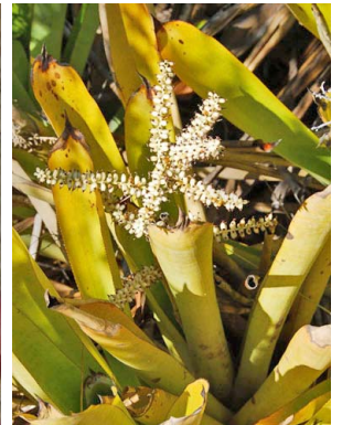
10 Aechmea patentissima