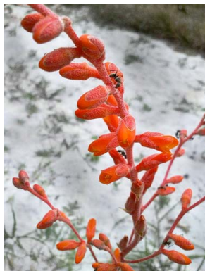
18 Dyckia limaie