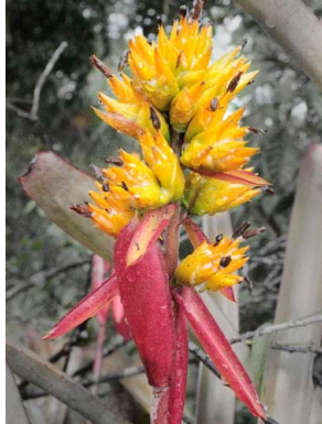
2 Aechmea chrysocoma