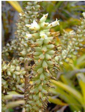
7 Aechmea lingulatooides