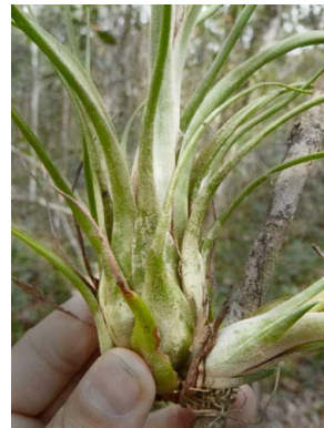
34 Tillandsia paraensis