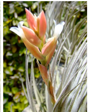
35 Tillandsia paraibensis