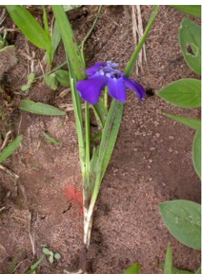
17 Ennealophus samaipatanus