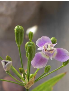
6 Ennealophus euryandrus