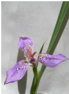
67 Mastigostyla johnstonii