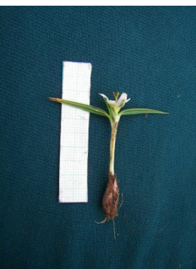
76 Mastigostyla pachatusanii [sp. nov.ined]