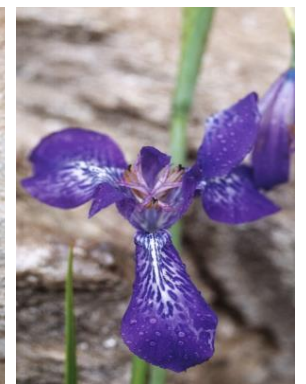
60 Mastigostyla herrerae