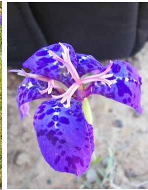
49 Mastigostyla cardenasii