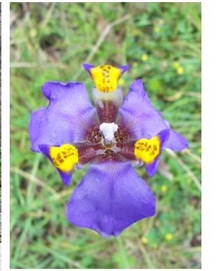
30 Hesperoxiphion herrerae