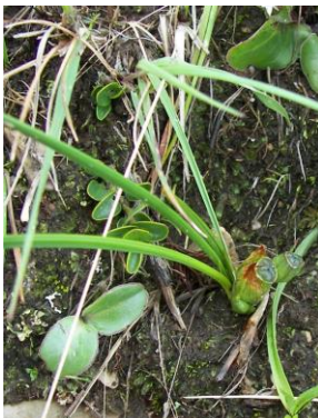
72 Mastigostyla mandingensis [sp. nov.ined]