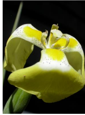
24 Flavustum bracteolatum