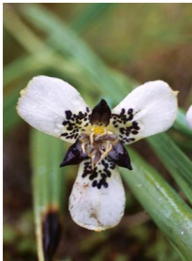
71 Mastigostyla major