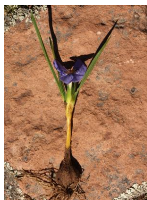
92 Mastigostyla venturii