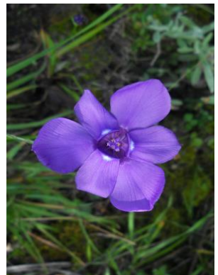
15 Ennealophus foliosus