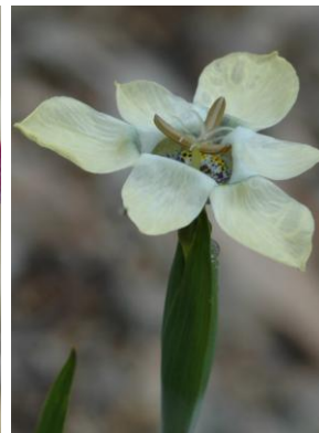
84 Mastigostyla philippiana