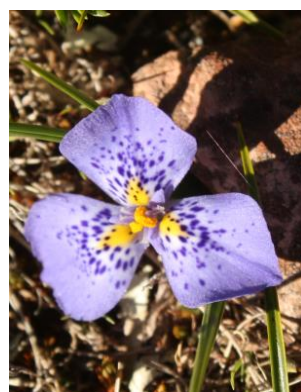
93 Mastigostyla venturii