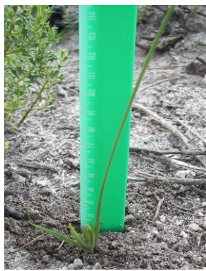
38 Mastigostyla boliviensis