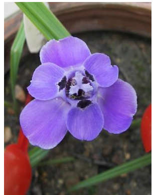
20 Ennealophus tucumanensis