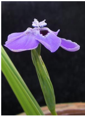
21 Ennealophus tucumanensis

© Hibert Huaylla Limachi [hibert_huaylla@hahoo.es]. Universidade Estadual Feira de Santana (UEFS), Feira de Santana, Bahia, Brasil. Universidad Mayor Real y Pontificia de San Francisco Xavier de Chuquisaca, Sucre, Bolivia. [fieldguides.fieldmuseum.org] fieldguides@fieldmuseum.org [746] version 1 01/2017