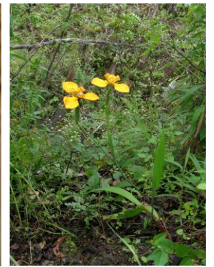
35 Hesperoxiphion peruvianum