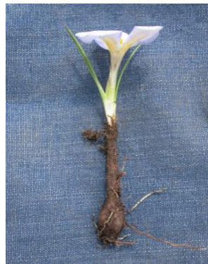
73 Mastigostyla mandingensis [sp. nov.ined]