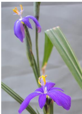
86 Mastigostyla torotoroensis