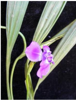
11 Ennealophus simplex