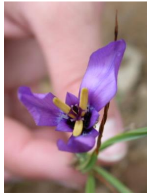
28 Herbertia tigridioides