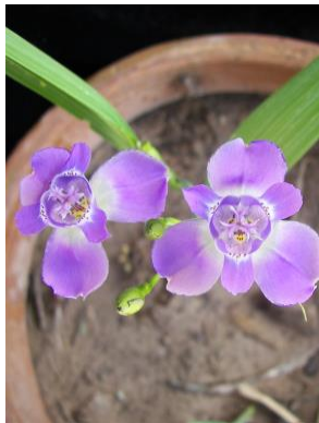
13 Ennealophus simplex