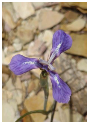
81 Mastigostyla potosina