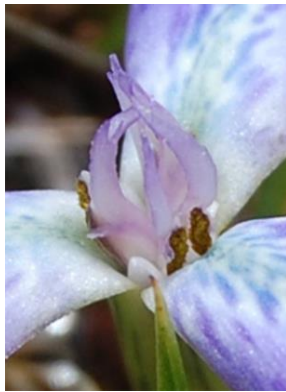
62 Mastigostyla candaravensis