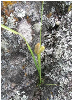
66 Mastigostyla johnstonii