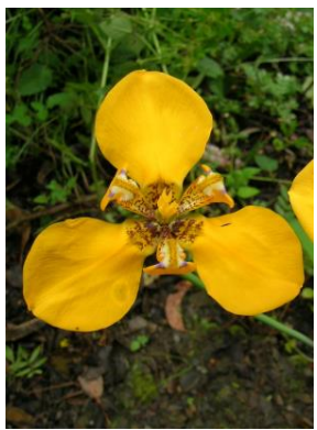
36 Hesperoxiphion peruvianum