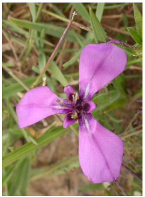
26 Herbertia lahue