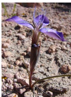
57 Mastigostyla cyrtophylla