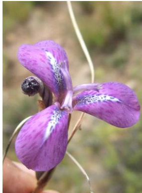
42 Mastigostyla brachiandra