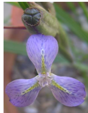
44 Mastigostyla brevicalis