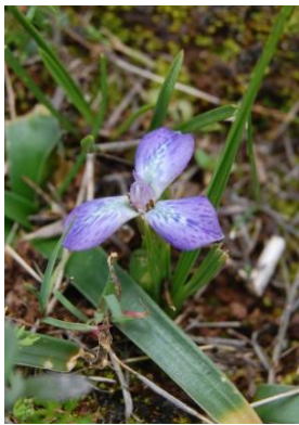
61 Mastigostyla candaravensis

© Hibert Huaylla Limachi [hibert_huaylla@hahoo.es]. Universidade Estadual Feira de Santana (UEFS), Feira de Santana, Bahia, Brasil. Universidad Mayor Real y Pontificia de San Francisco Xavier de Chuquisaca, Sucre, Bolivia. [fieldguides.fieldmuseum.org] fieldguides@fieldmuseum.org [746] version 1 01/2017