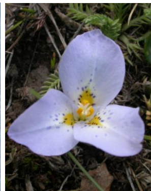
74 Mastigostyla mandingensis [sp. nov.ined]