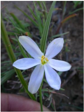
1 Calydorea approximata