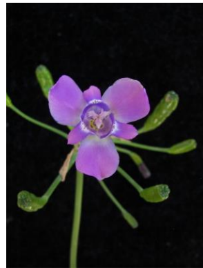
12 Ennealophus simplex