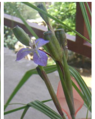
45 Mastigostyla brevicalis