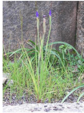
29 Hesperoxiphion herrerae