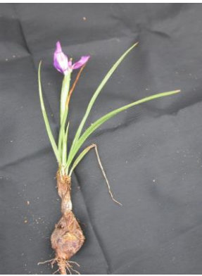
27 Herbertia tigridioides