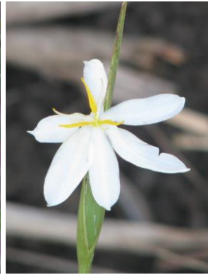
3 Eleutherine latifolia