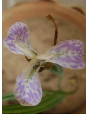
64 Mastigostyla implicata