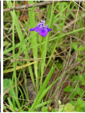
4 Ennealophus boliviensis