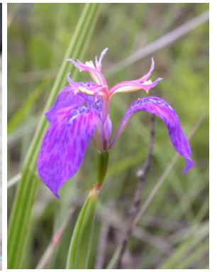
50 Mastigostyla cardenasii