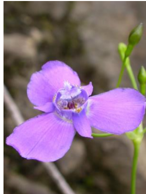
8 Ennealophus fimbriatus