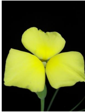
23 Flavustum bracteolatum