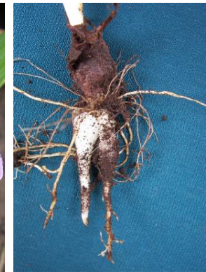
14 Ennealophus foliosus