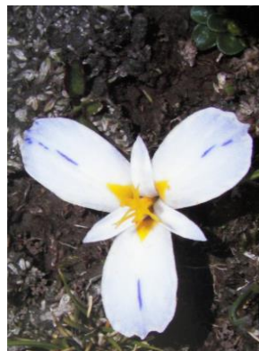
89 Mastigostyla tunariensis