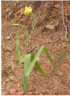
22 Flavustum bracteolatum