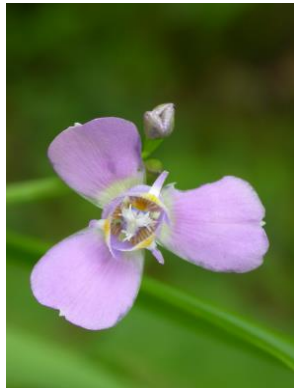
7 Ennealophus euryandrus