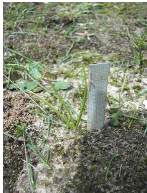
68 Mastigostyla larae [sp. nov.ined]