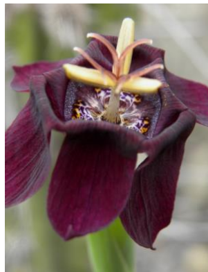
83 Mastigostyla philippiana