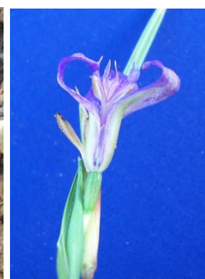
95 Mastigostyla woodii