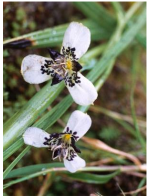
70 Mastigostyla major