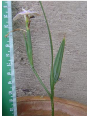
63 Mastigostyla implicata