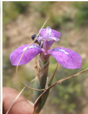
43 Mastigostyla brachiandra