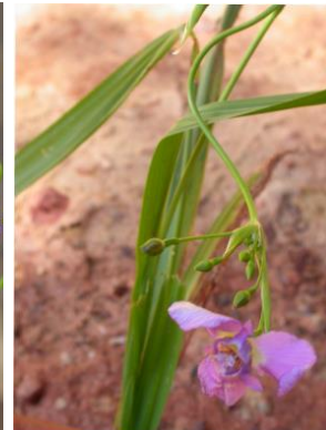
9 Ennealophus fimbriatus