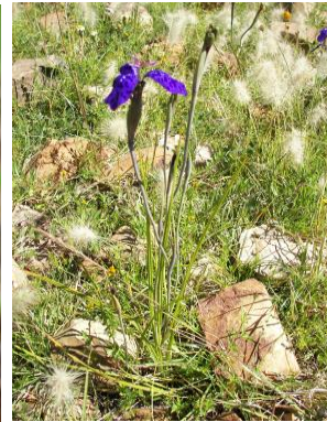
48 Mastigostyla cardenasii