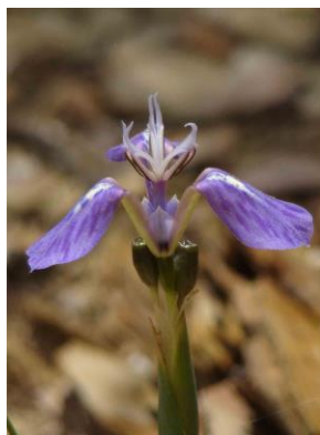
82 Mastigostyla potosina