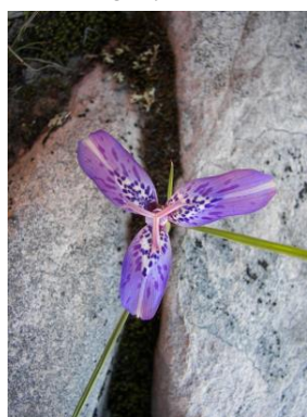
56 Mastigostyla chuquisacensis