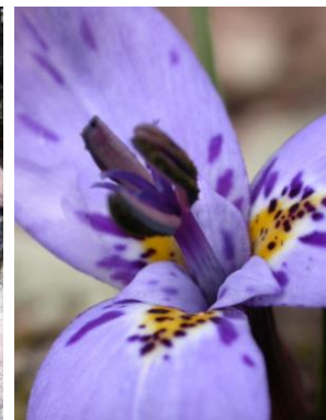
53 Mastigostyla chataquilensis