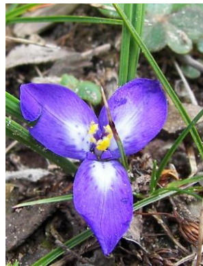
69 Mastigostyla larae [sp. nov.ined]