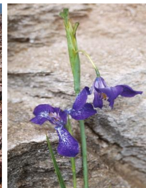
59 Mastigostyla herrerae