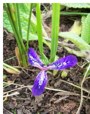
79 Mastigostyla peruviana