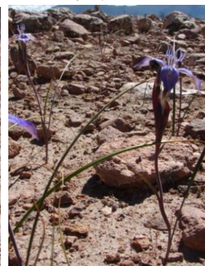
58 Mastigostyla cyrtophylla