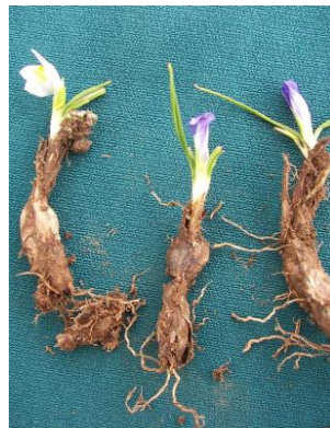
88 Mastigostyla tunariensis