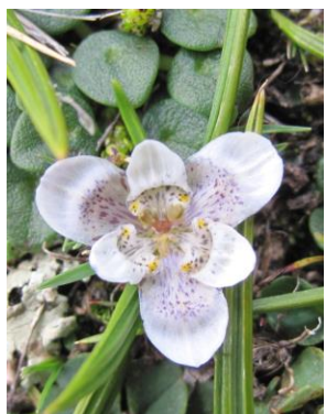
75 Mastigostyla pachatusanii [sp. nov.ined]