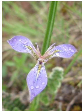
47 Mastigostyla cabreræ