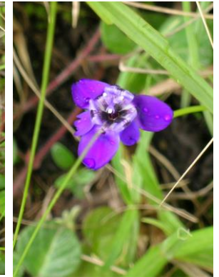
5 Ennealophus boliviensis