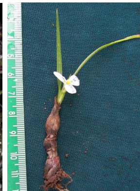
90 Mastigostyla vargasii