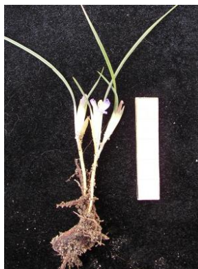
39 Mastigostyla boliviensis