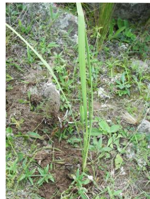
19 Ennealophus tucumanensis