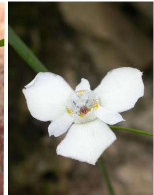
10 Ennealophus fimbriatus