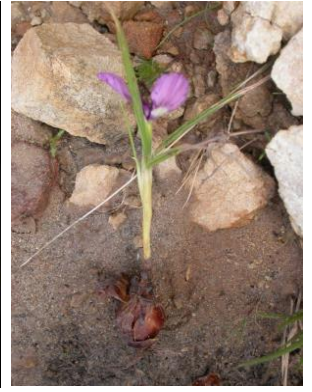
25 Herbertia lahue