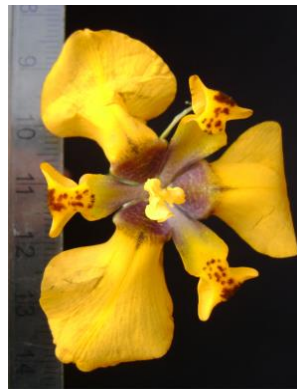
33 Hesperoxiphion pardalis