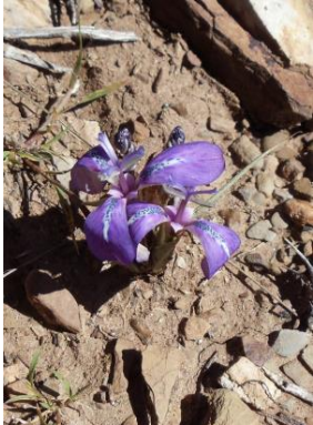
41 Mastigostyla brachiandra Foto: F. Zenteno

© Hibert Huaylla Limachi [hibert_huaylla@hahoo.es]. Universidade Estadual Feira de Santana (UEFS), Feira de Santana, Bahia, Brasil. Universidad Mayor Real y Pontificia de San Francisco Xavier de Chuquisaca, Sucre, Bolivia. [fieldguides.fieldmuseum.org] fieldguides@fieldmuseum.org [746] version 1 01/2017