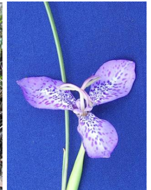
55 Mastigostyla chuquisacensis