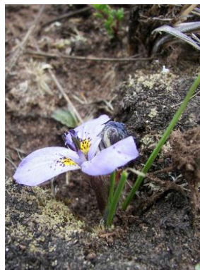
51 Mastigostyla chataquilensis