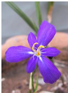
87 Mastigostyla torotoroensis