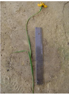
32 Hesperoxiphion pardalis