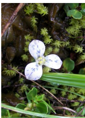
91 Mastigostyla vargasii