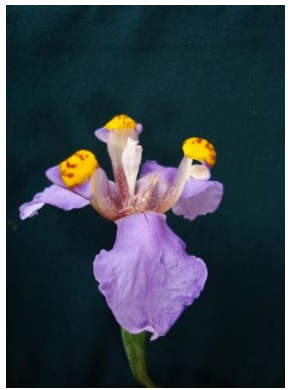
31 Hesperoxiphion herrerae