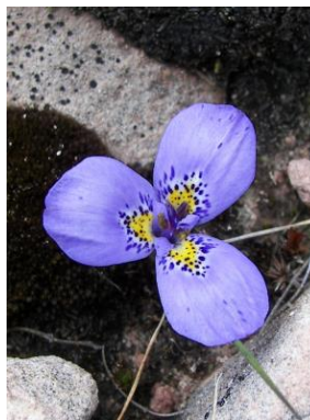
52 Mastigostyla chataquilensis