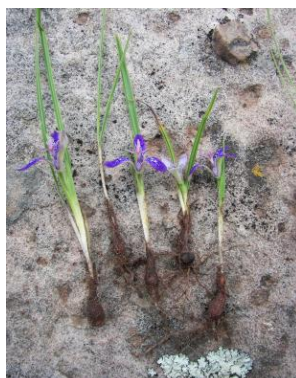
78 Mastigostyla peruviana