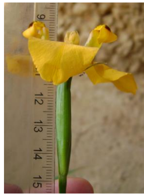
34 Hesperoxiphion pardalis