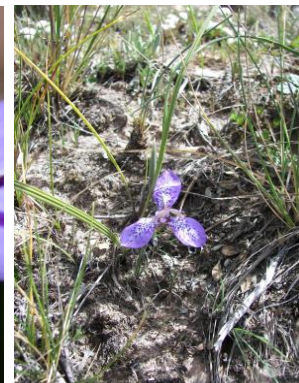
54 Mastigostyla chuquisacensis