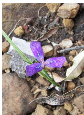
94 Mastigostyla woodii