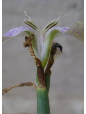
65 Mastigostyla implicata