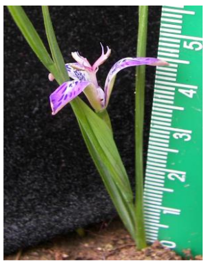
80 Mastigostyla peruviana