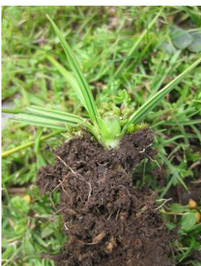
77 Mastigostyla pachatusanii [sp. nov.ined]