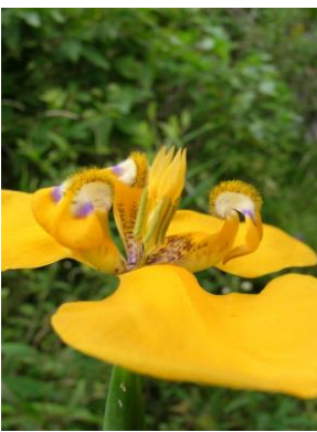
37 Hesperoxiphion peruvianum