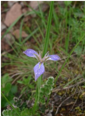
46 Mastigostyla cabreræ