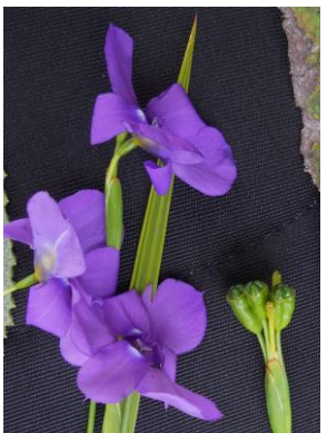
16 Ennealophus foliosus