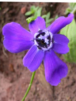
18 Ennealophus samaipatanus