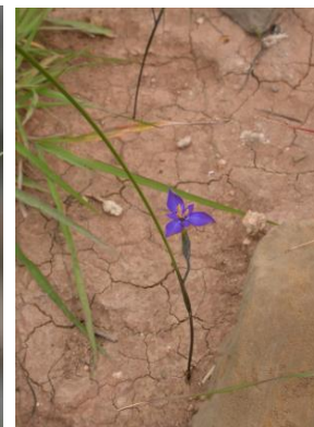
85 Mastigostyla torotoroensis