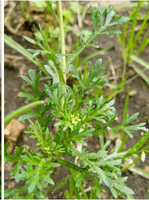
33 Lepidium bipinnatifidum BRASSICACEAE