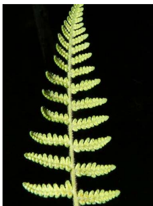
46 Pteridium aquilinum DENNSTAEDTIACEAE