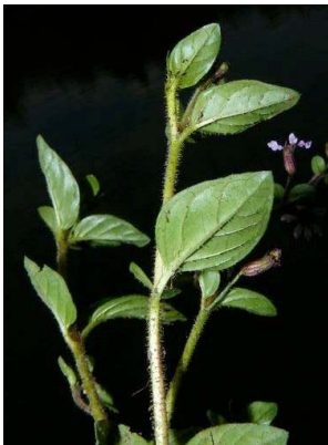
66 Cuphea racemosa LYTHRACEAE