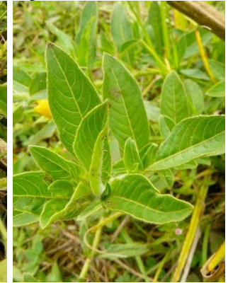
75 Ludwigia peruviana ONAGRACEAE