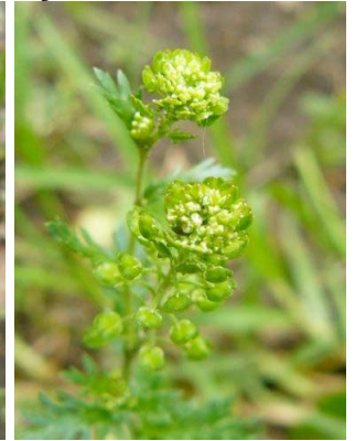
35 Lepidium bipinnatifidum BRASSICACEAE