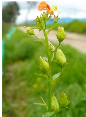
98 Alonsoa meridionalis SCROPHULARIACEAE