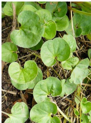
36 Dichondra repens CONVOLVULACEAE