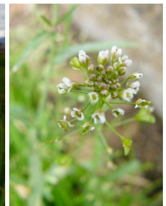
30 Capsella bursa-pastoris BRASSICACEAE