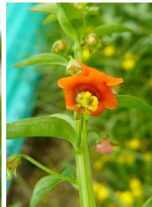
99 Alonsoa meridionalis SCROPHULARIACEAE