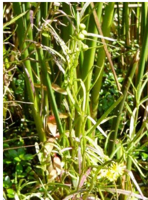
22 Senecio madagascariensis ASTERACEAE