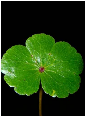
2 Hydrocotyle ranunculoides APIACEAE