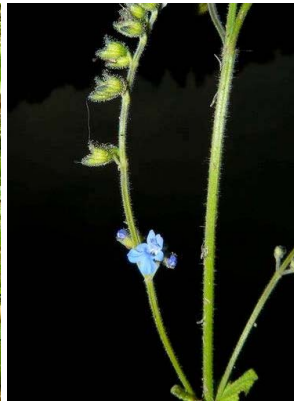
63 Salvia palifolia LAMIACEAE