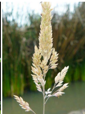
87 Holcus lanatus POACEAE