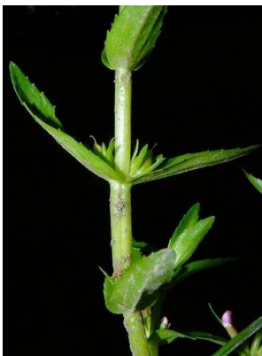
86 Gratiola bogotensis PLANTAGINACEAE