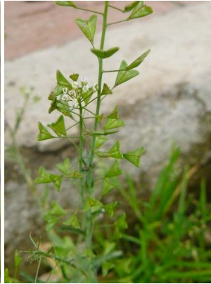
32 Capsella bursa-pastoris BRASSICACEAE