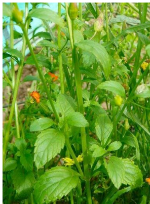
97 Alonsoa meridionalis SCROPHULARIACEAE