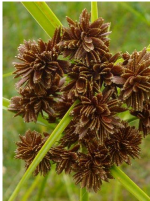
41 Pycurus niger CYPERACEAE