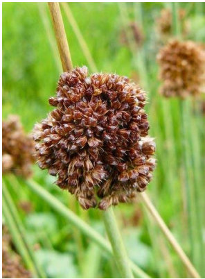
61 Juncus effusus JUNCACEAE