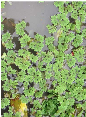
96 Azolla filiculoides SALVINIACEAE