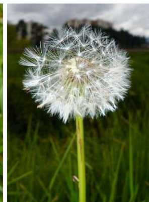
29 Taraxacum campylodes ASTERACEAE