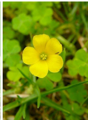
78 Oxalis filiformis OXALIDACEAE