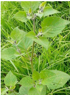
101 Physalis peruviana SOLANACEAE