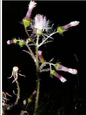
12 Erechites valerianifolius ASTERACEAE