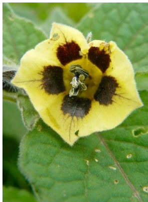
102 Physalis peruviana SOLANACEAE