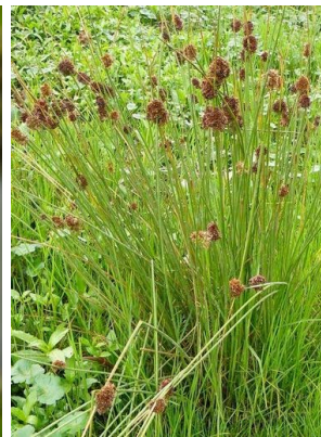
59 Juncus effusus JUNCACEAE