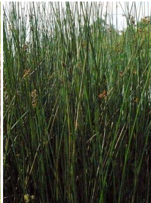
42 Schoenoplectus californicus CYPERACEAE