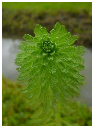
58 Myriophyllum aquaticum HALORAGACEAE