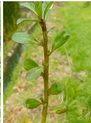
69 Ludwigia peploides ONAGRACEAE