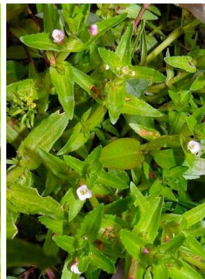
83 Gratiola bogotensis PLANTAGINACEAE