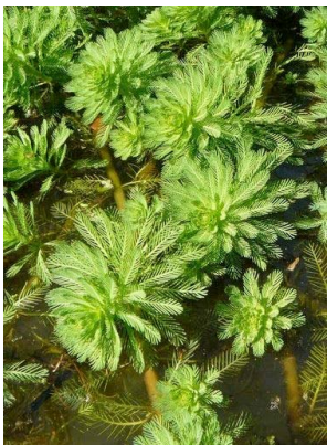
56 Myriophyllum aquaticum HALORAGACEAE