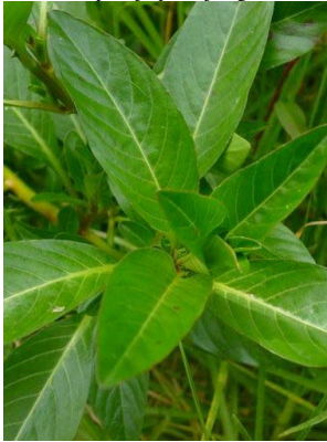
71 Ludwigia peploides ONAGRACEAE

[fieldguides.fieldmuseum.org] [972] versión 1 12/2017