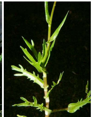
10 Cotula coronopifolia ASTERACEAE