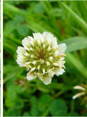
54 Trifolium repens FABACEAE