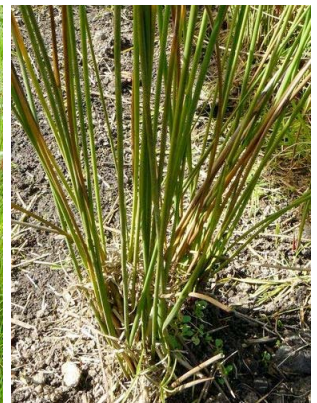
60 Juncus effusus JUNCACEAE