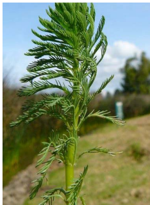
57 Myriophyllum aquaticum HALORAGACEAE