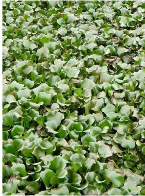
92 Eichhornia crassipes PONTEDERIACEAE