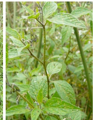
105 Solanum americanum SOLANACEAE