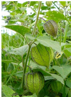
103 Physalis peruviana SOLANACEAE