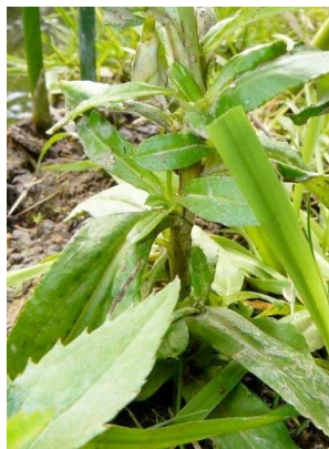
17 Gamochaeta americana ASTERACEAE