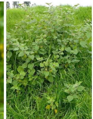
100 Physalis peruviana SOLANACEAE