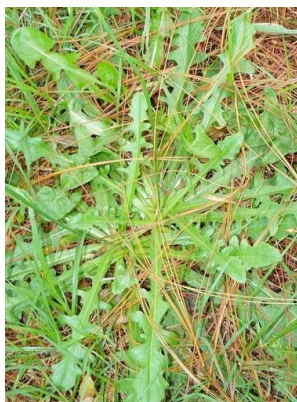
27 Taraxacum campylodes ASTERACEAE