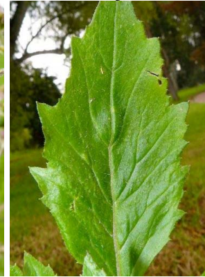
14 Erechites valerianifolius ASTERACEAE