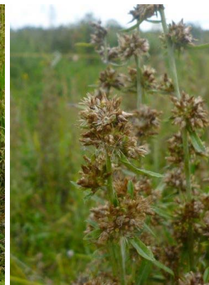
19 Gamochaeta coarctatum ASTERACEAE