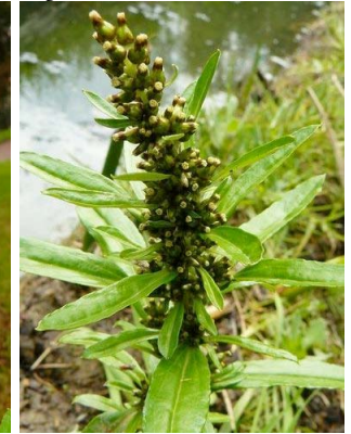
15 Gamochaeta americana ASTERACEAE