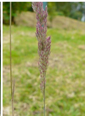
88 Holcus lanatus POACEAE