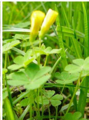
77 Oxalis filiformis OXALIDACEAE