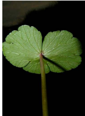
3 Hydrocotyle ranunculoides APIACEAE