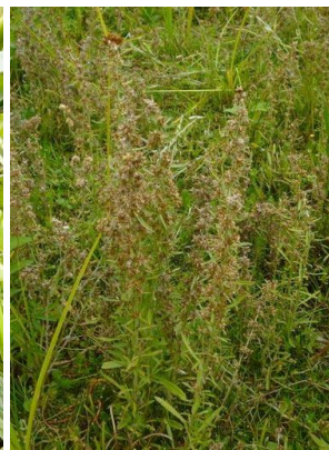
18 Gamochaeta coarctatum ASTERACEAE