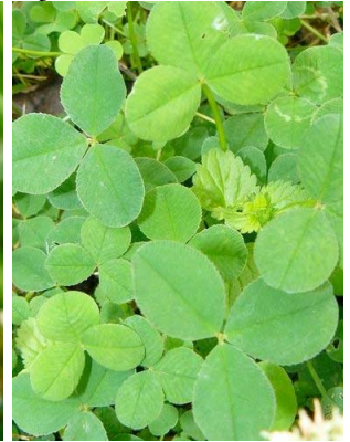
55 Trifolium repens FABACEAE