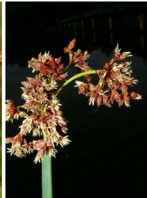
44 Schoenoplectus californicus CYPERACEAE