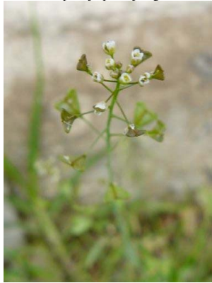
31 Capsella bursa-pastoris BRASSICACEAE

[fieldguides.fieldmuseum.org] [972] versión 1 12/2017