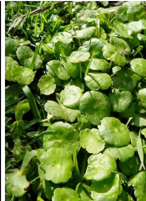
4 Hydrocotyle verticillata APIACEAE