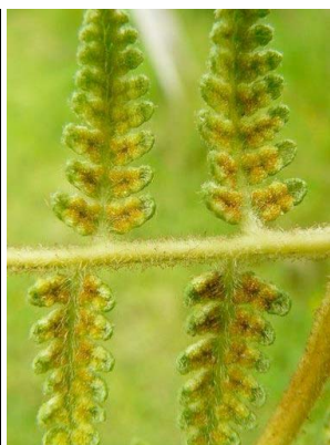
47 Pteridium aquilinum DENNSTAEDTIACEAE