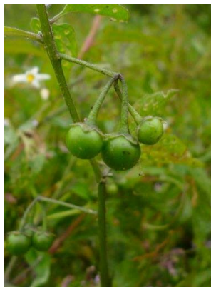
107 Solanum americanum SOLANACEAE