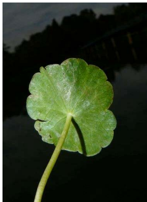
6 Hydrocotyle verticillata APIACEAE