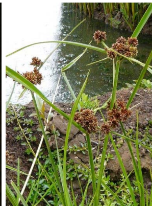
39 Pycurus niger CYPERACEAE