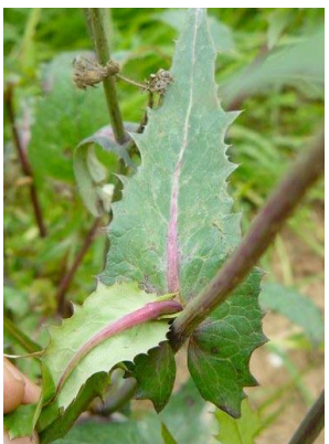
26 Sonchus oleraceus ASTERACEAE