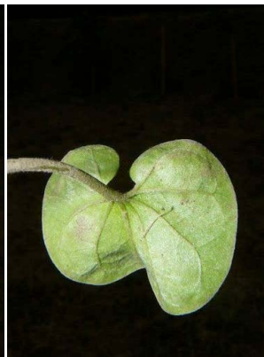
38 Dichondra repens CONVOLVULACEAE