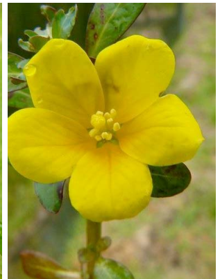
70 Ludwigia peploides ONAGRACEAE