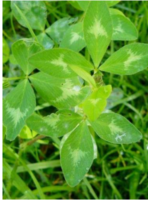
52 Trifolium pratense FABACEAE