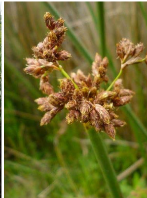
43 Schoenoplectus californicus CYPERACEAE