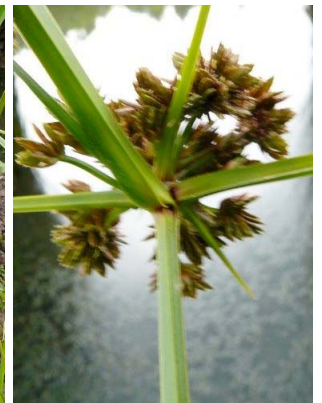
40 Pycurus niger CYPERACEAE