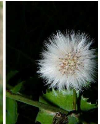
25 Sonchus oleraceus ASTERACEAE