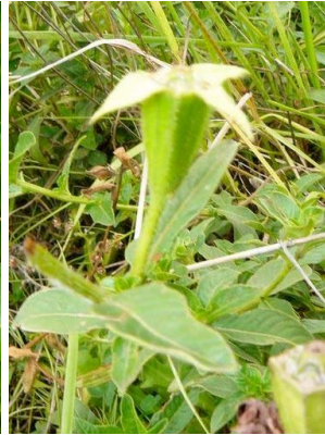
72 Ludwigia peruviana ONAGRACEAE