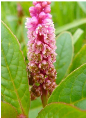
81 Phytolacca bogotensis PHYTOLACCACEAE