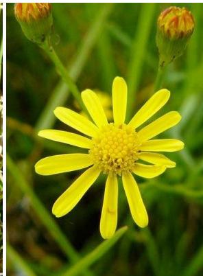
23 Senecio madagascariensis ASTERACEAE