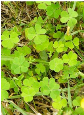
76 Oxalis filiformis OXALIDACEAE