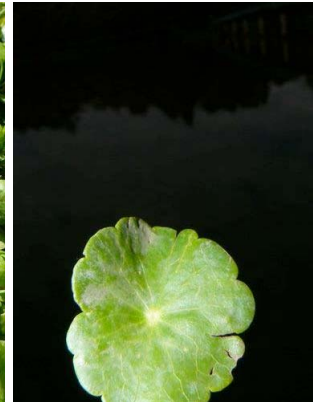
5 Hydrocotyle verticillata APIACEAE