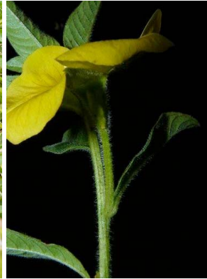
73 Ludwigia peruviana ONAGRACEAE