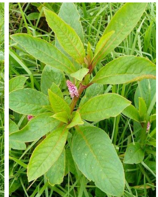
80 Phytolacca bogotensis PHYTOLACCACEAE