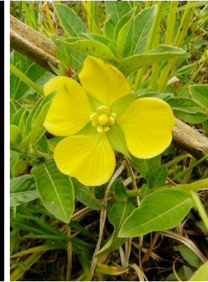
74 Ludwigia peruviana ONAGRACEAE