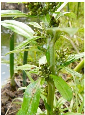
16 Gamochaeta americana ASTERACEAE