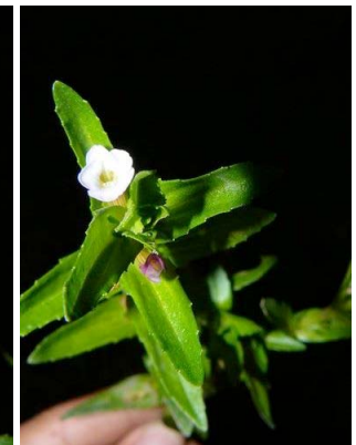
85 Gratiola bogotensis PLANTAGINACEAE