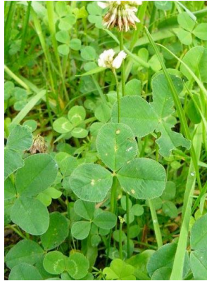
53 Trifolium repens FABACEAE