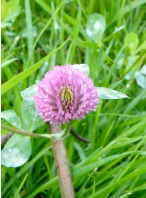
51 Trifolium pratense FABACEAE

[fieldguides.fieldmuseum.org] [972] versión 1 12/2017