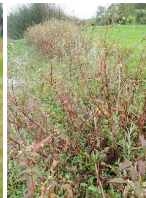
89 Persicaria punctata POLYGONACEAE