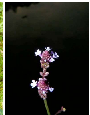
110 Verbena litoralis VERBENACEAE