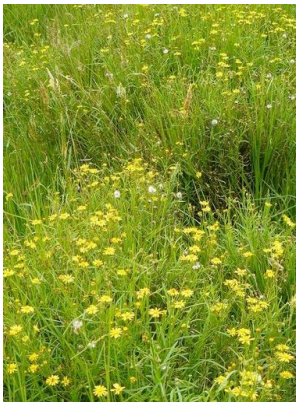
21 Senecio madagascariensis ASTERACEAE