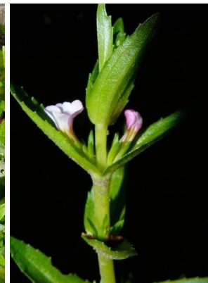
84 Gratiola bogotensis PLANTAGINACEAE