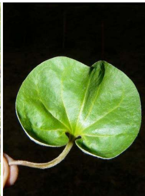
37 Dichondra repens CONVOLVULACEAE