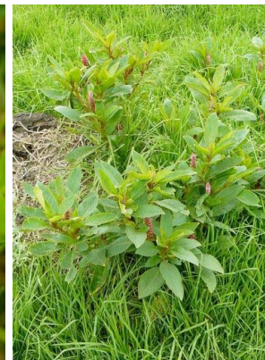
79 Phytolacca bogotensis PHYTOLACCACEAE