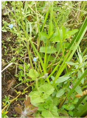
62 Salvia palifolia LAMIACEAE