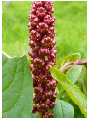
82 Phytolacca bogotensis PHYTOLACCACEAE