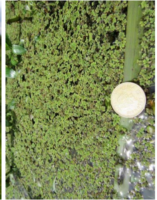
95 Azolla filiculoides SALVINIACEAE