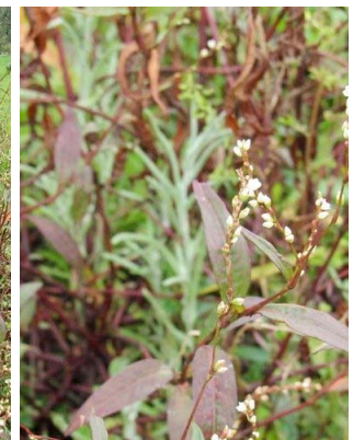
90 Persicaria punctata POLYGONACEAE