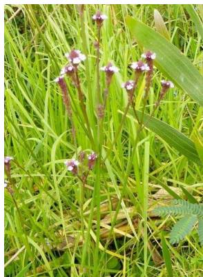
108 Verbena litoralis VERBENACEAE