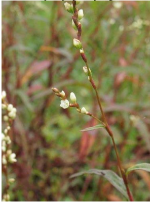
91 Persicaria punctata POLYGONACEAE

[fieldguides.fieldmuseum.org] [972] versión 1 12/2017