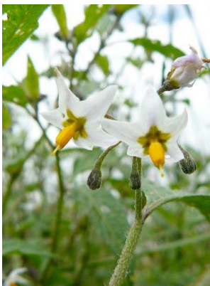
106 Solanum americanum SOLANACEAE