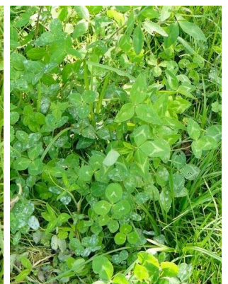
50 Trifolium pratense FABACEAE