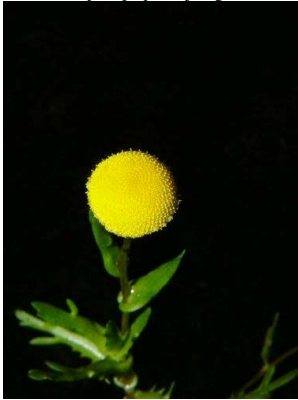
11 Cotula coronopifolia ASTERACEAE

[fieldguides.fieldmuseum.org] [972] versión 1 12/2017