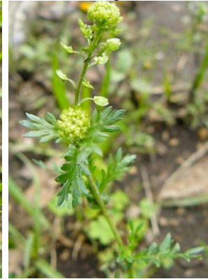
34 Lepidium bipinnatifidum BRASSICACEAE