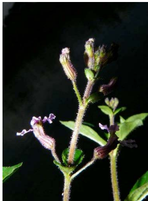
67 Cuphea racemosa LYTHRACEAE