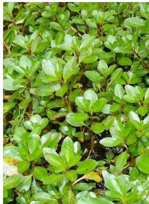
68 Ludwigia peploides ONAGRACEAE