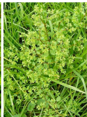
49 Euphorbia peplus EUPHORBIACEAE