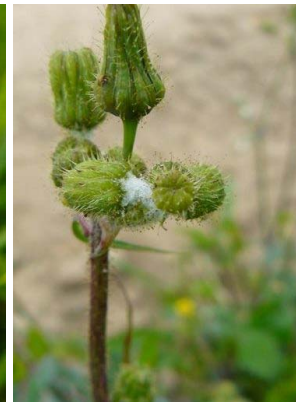
24 Sonchus oleraceus ASTERACEAE