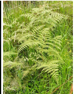
45 Pteridium aquilinum DENNSTAEDTIACEAE