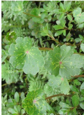
1 Hydrocotyle ranunculoides APIACEAE

El Humedal Jaboque cuenta con un observatorio astronómico, monolitos que dispusieron nuestros antepasados Muisca en cercanía al Río Bogotá. Al igual que otros pueblos indígenas de América, mediante la fijación de puntos de observación en los monolitos los muisca del Jaboque determinaron las fechas para la siembra y la cosecha, pero teniendo en cuenta que la sabana permanecía inundada, dieron especial importancia a la determinación del comienzo de las épocas secas, en donde podían cultivar productos un poco más resistentes como la papa o el maíz (“Humedal Jaboque,” 2012).