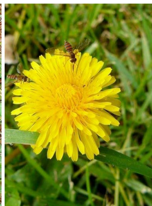
28 Taraxacum campylodes ASTERACEAE