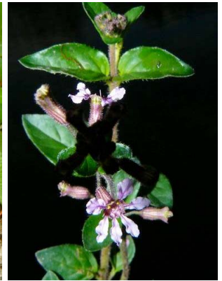
65 Cuphea racemosa LYTHRACEAE