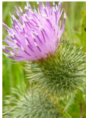
8 Cirsium vulgare ASTERACEAE