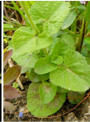
64 Salvia palifolia LAMIACEAE