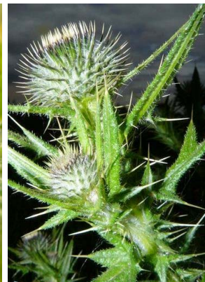
9 Cirsium vulgare ASTERACEAE