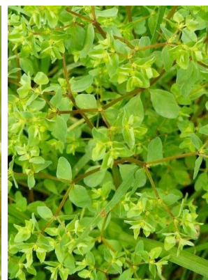
48 Euphorbia peplus EUPHORBIACEAE