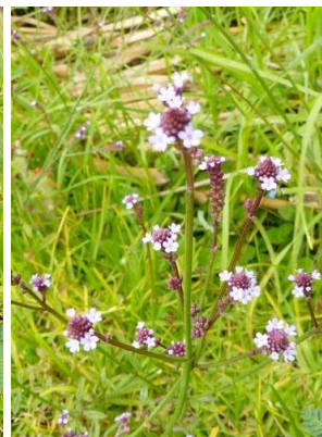
109 Verbena litoralis VERBENACEAE