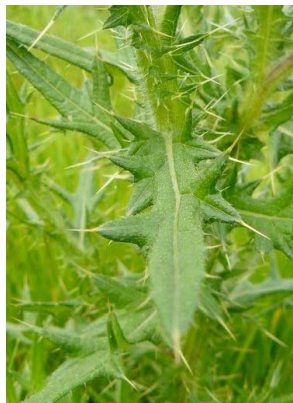
7 Cirsium vulgare ASTERACEAE