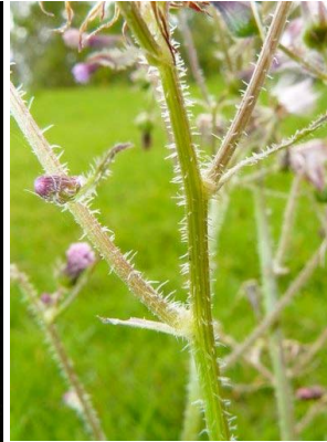
13 Erechites valerianifolius ASTERACEAE