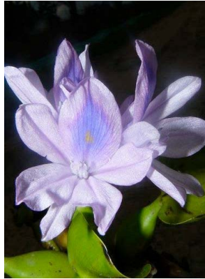
93 Eichhornia crassipes PONTEDERIACEAE