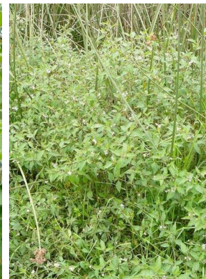
104 Solanum americanum SOLANACEAE