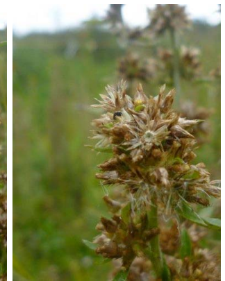
20 Gamochaeta coarctatum ASTERACEAE