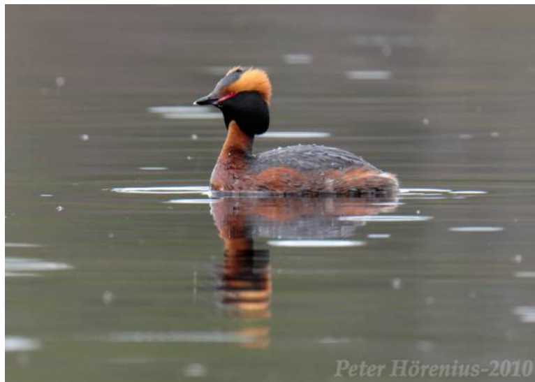
Svarthakedopping vid Islingen. Foto Peter Hörenius 2010.

Islingen på den topografiska kartan. Ursprunglig vattenyta före sänkningen i slutet av 1800-talet framgår i stort av blåstreckade partier samt en del av det brunstreckade området. I öster har sjöns yta troligen nått fram till den bruna höjdlinjen (235 meter ö.h.).