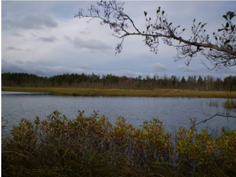
Utsikt över sjön Islingen från sydost