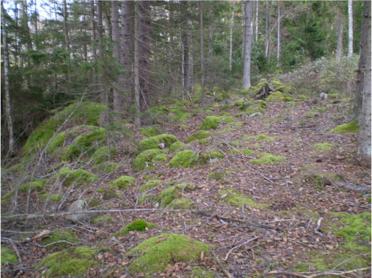
Moränvallen vid Islingens östra sida. Markerar den ursprungliga vattennivån före sänkningen.