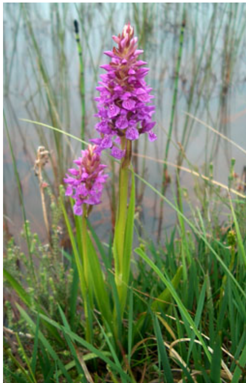
Mossnycklar, Dactylorhiza sphagnicola , som växer rikligt vid Islingen