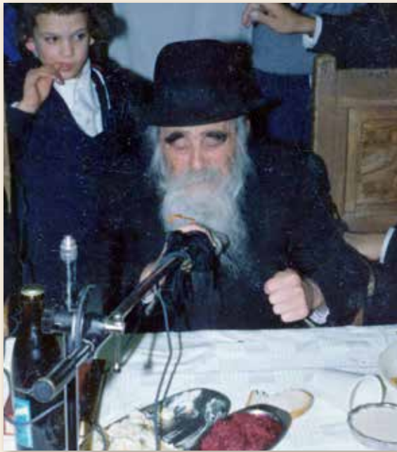
נושא מאמר חסידות על-פה בבית הכנסת חב"ד במאה שערים, בהתוועדות י"ב תמוז תשמ"ו, פחות מחודש ימים לפני פטירתו

בשל דייקנותו והסדר האופייני שהיה חרוט בכל הליכותיו, היו הבריות נוהגות לומר כלפיו: אם יש את נפשך לכוון את השעון שבידך, תוכל לעשות זאת בשעה שבה ר' שייע יוצא מביתו ובשעה שבה שב. בכל יום ויום היה זה באותה שעה ובאותה דקה, שהיו ישרות ומדודות כפלים.