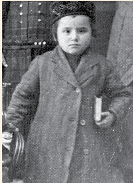
ילד בחברון החב"דית עם סידור תפילה בידו ומבט נחוש בעיניו

"על מה לבכות - לא חסר להם כלל. יגיעים ורצוצים מרעב ומקור. אבא נידח אי שם בצבא הטורקי, וזה כמה חודשים שלא שמעו ממנו, ומי יודע מה נעשה אתו. ובתוך כל הצרות, עוד היו דמעות להזיל על הצרה בשעתה, שהמצה שזכו לה בעמל כה רב, לא תרטב ח"ו".