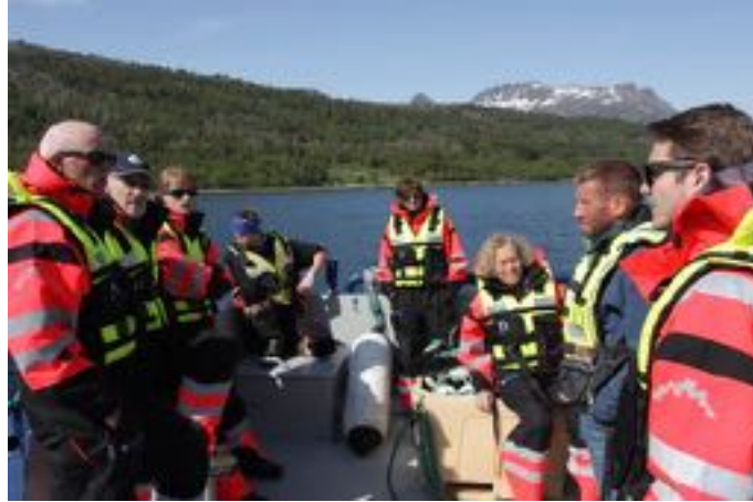
Styremøte ekskursjon 31.Mai

Årsmøtet ble arrangert i forbindelse med regionrådsmøte i Lenvik 11 april. I tillegg ble noen årsmøtesaker utsatt til regionrådsmøtet 6.Juni.