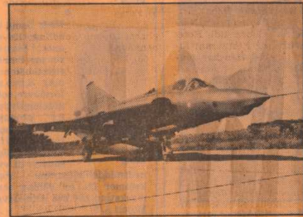
Danske jagerfly »viste flaget« ud over Nordsøen, da en belgisk fiskekutter onsdag chikanerede danske fiskere.