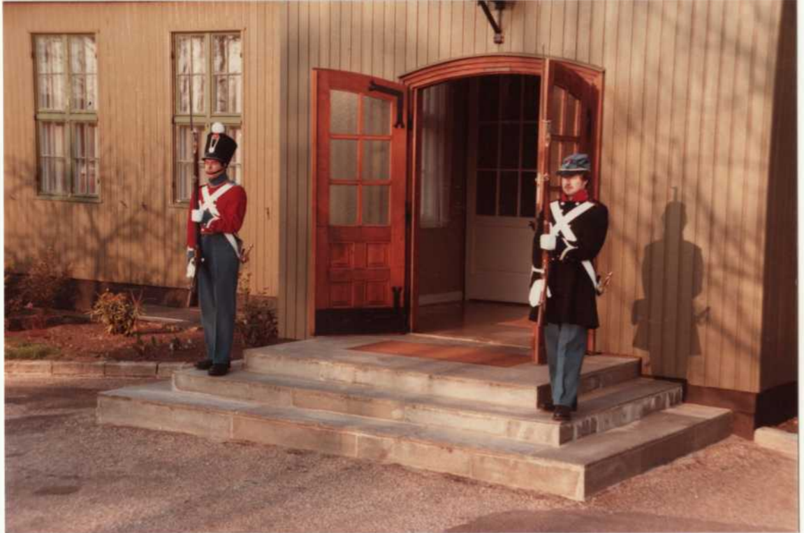
(VAGTEN VAR OPSTILLET P.G.A BALTA? HANDE PEST SAMME AFTEN )

(GODT NOK HAR VON VÆRET LÆNGE I 729 MEN DISSE UNIFORMER ER FRA ET PAR ÅR FØR HAN STARTEDE )