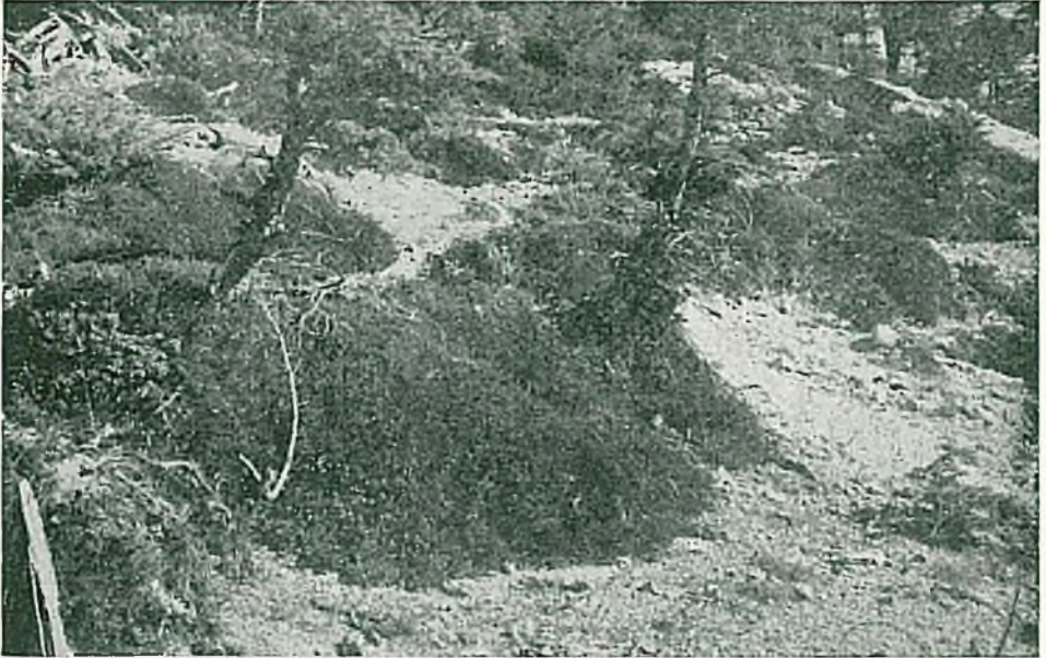
Resim 9. Sedir meşceresi altında, Pentapera bocquetii kümelerinin yakından görünüşü.