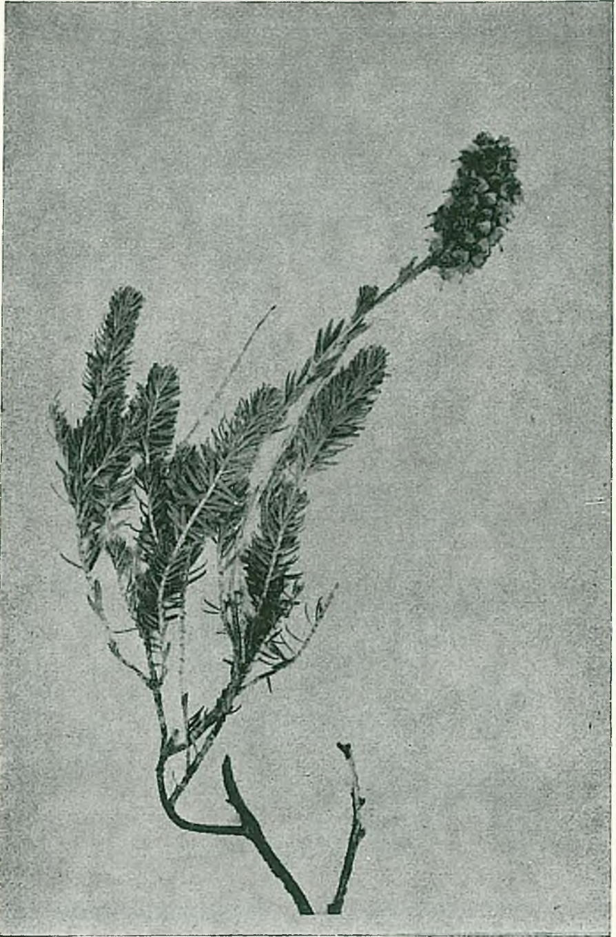
Resim 2. Bruckenthalia spiculifolia (Salisb.) Reishenb.