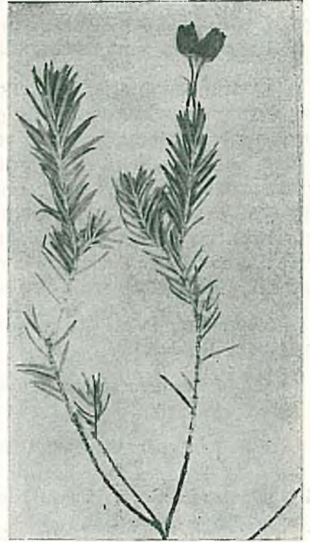
Resim 7. Pentapera bocquettii Peşmen.