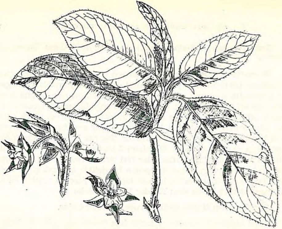
Resim 3. Orphanidesia gaultherioides Boiss. et Bal. (Garten fl. 1891'den)