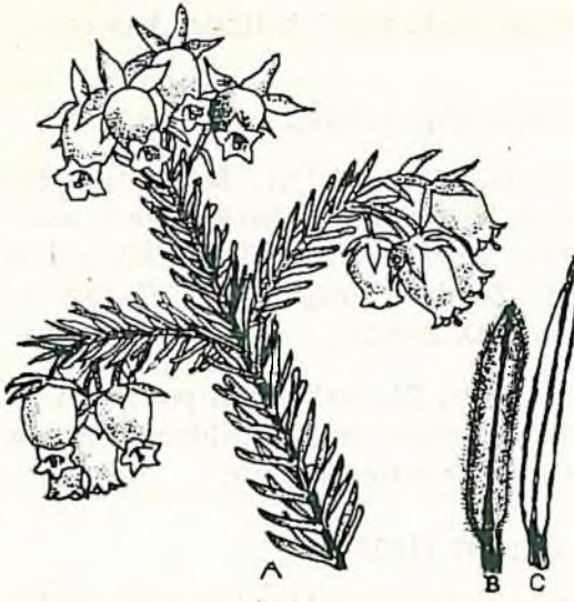
Resim 5. A — Pentapera sicula 'nın çiçekli sürgünü, B — subsp. sicula 'nın yaprağı, C — subsp. libanotica 'nın yaprağı.