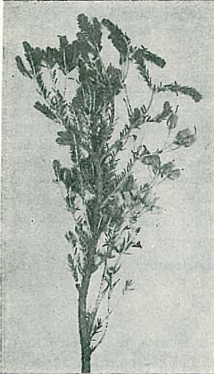
Resim 6. Pentapera sicula (Guss.) Klot. subsp. libanotica (Barbey) Yaltrık.