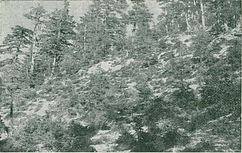
Resim 8. Antalya, Elmalı : Çıglıkarada Sedir meşceresi altında Pentapera bocquetii 'nin toprağı kümeler halinde örtlülüğü görülmektedir.