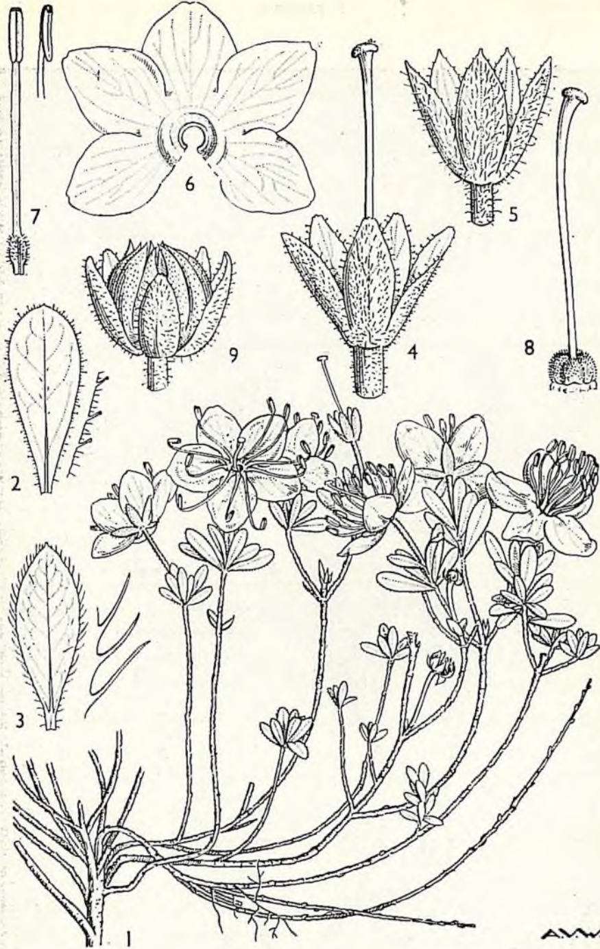
Resim 1. 1, R. sessilifolius 4'ün habitusu (tabii büyüklükte); 2, yaprağı x 3, ve yaprak kenarı x 8; 3, R. chamaecistus 'un yaprağı x 3, ve yaprak kenarı x 8; 4, çanak x 4; 5, R. chamaecistus 'un çanağı x 4; 6, taç yapraklar x 2; 7, eteminler x 4; 8, ovarium x 4; 9, meyve x 4; (Davis, 1962'den)