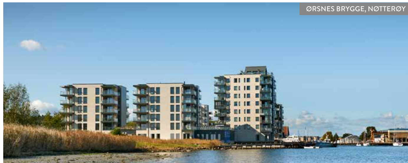
ØRSNES BRYGGE, NØTTERØY