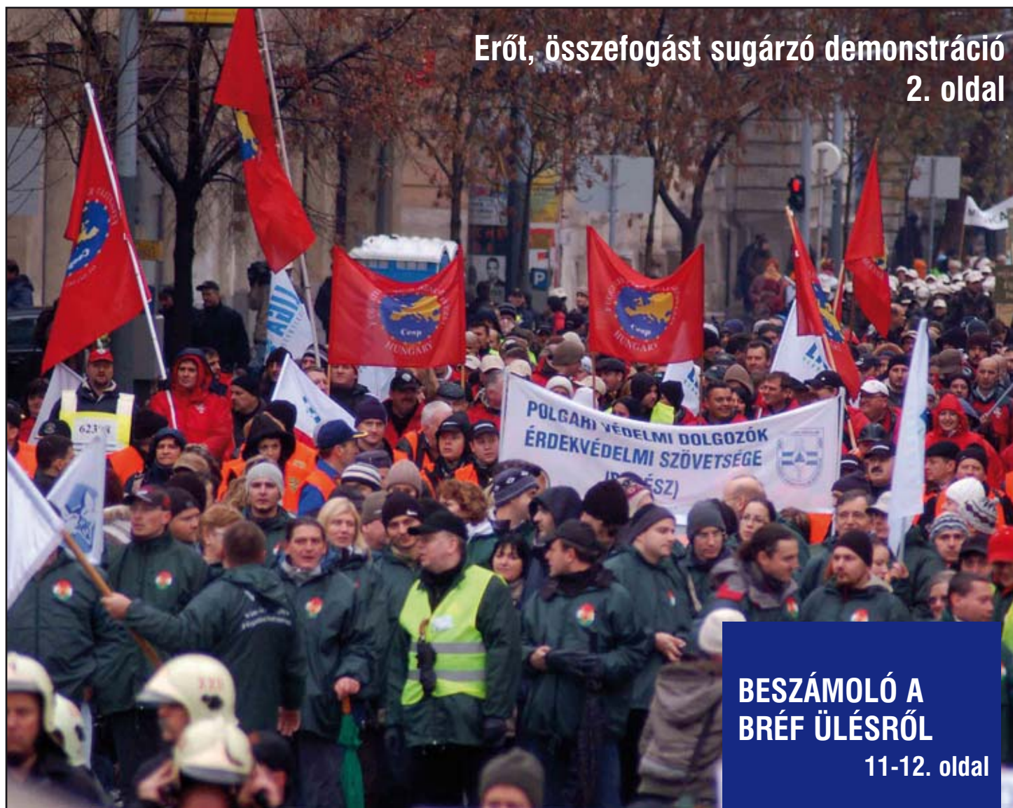
Erőt, összefogást sugárzó demonstráció 2. oldal