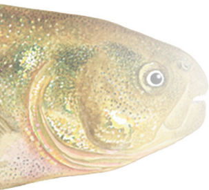
Ilustración: M. C. Estivariz.

Pariente cercano de las populares “mojarras plateadas”, posee un conjunto de singularidades que la hacen única. Es un endemismo por encontrarse solamente en las nacientes del arroyo de origen termal llamado Valcheta, en la Meseta de Somuncurá, provincia de Río Negro. Tiene características muy particulares: una de ellas, es el hecho de la pérdida de las escamas durante su crecimiento. Resulta así que los juveniles presentan un escamado completo, mientras que a medida que alcanzan la adultez y siendo de mayor talla, las escamas se reabsorben. En cuanto a su alimentación, realiza un importante cambio en la dieta durante su desarrollo. Al nacer posee una alimentación principalmente carnívora compuesta por macroinvertebrados bentónicos; mientras que, en la etapa juvenil y adulta, se alimenta principalmente de algas perifíticas, por lo que su dieta se vuelve herbívora en gran parte. Como la mayoría de los peces óseos, su reproducción es de tipo ovípara y con fecundación externa. Lamentablemente el ambiente donde vive se encuentra fuertemente amenazado por diferentes causas, y el futuro de nuestra mojarra más austral, es incierto.