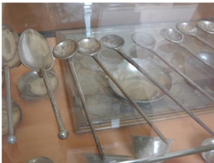
Fig. 44. Cucharas de plata de diversos tipos. Casa de Menandro. Museo Arqueológico de Nápoles.