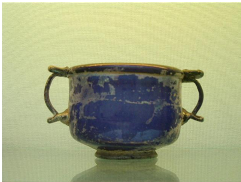
Fig. 39. Capis . Tazón con dos asas, fabricado en cristal azul cobalto. S. I d.C. Castra Vetera (Alemania) Museo Británico.

Capis. (Fig. 39) Tazón con asa descrito por Varrón: Capides et minores capulae a capiando, quod ansatae ut prehendi possent, id est capi. harum figuras in vasis sacris ligneas ac fictiles antiquas etiam nunc videmus -Varro., Ling. Lat. , 5, 26, 121-. En tiempos de Varrón, las formas más antiguas correspondían a recipientes sagrados y estaban elaborados en madera y barro.