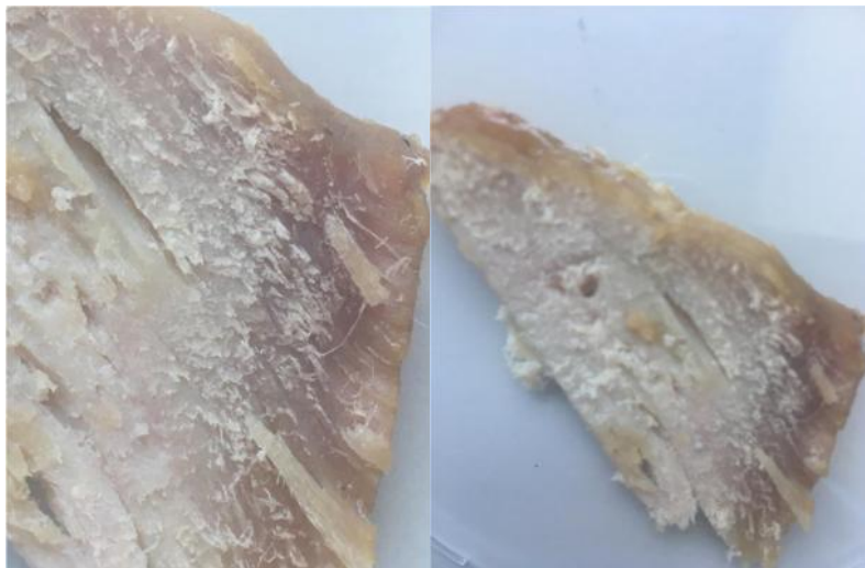
Figs. 30 y 31. Corte de las carnes ya cocinadas

Carne en conserva de miel tras el cocinado. Bordes resecos pero jugosa, con sabor suavemente dulzón.