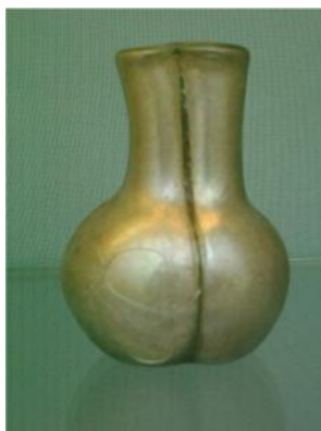
Fig. 34. Acetabulum . Recipiente para doble contenido, procedente de Siria. S. II d.C. Museo Británico.

Acetabulum. (Fig. 34) Vinagrera, salsera. En ella se servía lo que se preparaba en el uas , o en el vasculum . Era un recipiente de tamaño más pequeño que los anteriores, que se utilizaba para añadir vinagre y otras salsas en la mesa. Podían estar realizados en plata - Dig. , 34, 2, 19-, como otros utensilios de mesa y tenía la forma de un pequeño vaso 531 , como señala Apicio en numerosas ocasiones: Ad unum liquaminis acetabulum aquae septem mittes... -Apic., De re coq. , 53, 239, 242, 271, 333, 360, 362, 368, 383, 475, 485-.