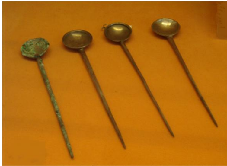
Fig. 45. Cuatro cucharas con mango largo y puntiagudo, y cazoleta redonda. Usadas para comer marisco y huevos. S. I a.C. al II d.C.

Colección Farnese. Museo Arqueológico de Nápoles.