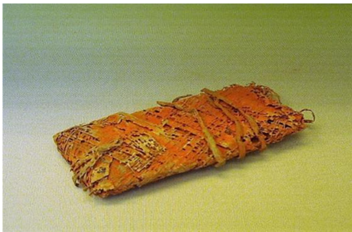
Fig. 40. Charta . Papiro que contiene algún tipo de pigmento rojo, utilizado de forma similar a los de uso culinario.

pescados blancos: Sardam exossatur... impletur et consuitur, involvitur in carta et sic supra... El resto de recetas que utilizan este sistema son complejas y muy técnicas, observamos el comentario de Apicio: Hac impensa intestina replet et super haedum componis in giro et omento uel carta cooperies, surclas -Apic., De re coq. , 366, 367, 371, 391, 392, 421-.