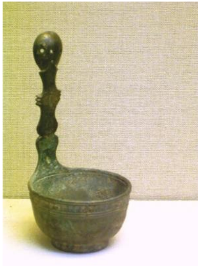
Fig. 63. Trulla . Gran cucharón para servir, s. I d.C.

Trulla. (Fig. 63) Cucharón, que es, para Varrón, además de cuchara de gran tamaño provista de mango, un recipiente cóncavo por el que circula el agua, vertiéndola como si fuera un grifo -Varro., Ling. Lat. , 5, 118-. Con forma de cucharón, o paleta, o también espumadera, pero siempre con mango: Et in patella alternis de trulla refundes... o: Et trullam plenam pulpae , y: Et ad trullam permisces et lias ut... -Apic., De re coq. , 141, 142, 179-.