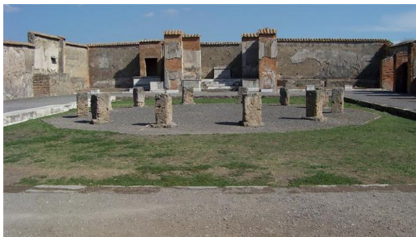
Figs. 6, 7 y 8. Mercado de Pompeya. Reconstruido en el s. I d.C. Regio VII, 9. Pompeya.

por el Macellum Liviae , en el Esquilino, y después, en el s. I d.C., por el Macellum Magnum 171 . Casio Dión señala la inauguración de dicho mercado en el año 59 d.C -Cass., Dio., H.R. , 61, 18, 3-. La existencia de unas infraestructuras urbanas dispuestas para proveer a la población de víveres y productos relacionados con la alimentación venía a cubrir una importante necesidad socio-económica (Figs. 6, 7 y 8).