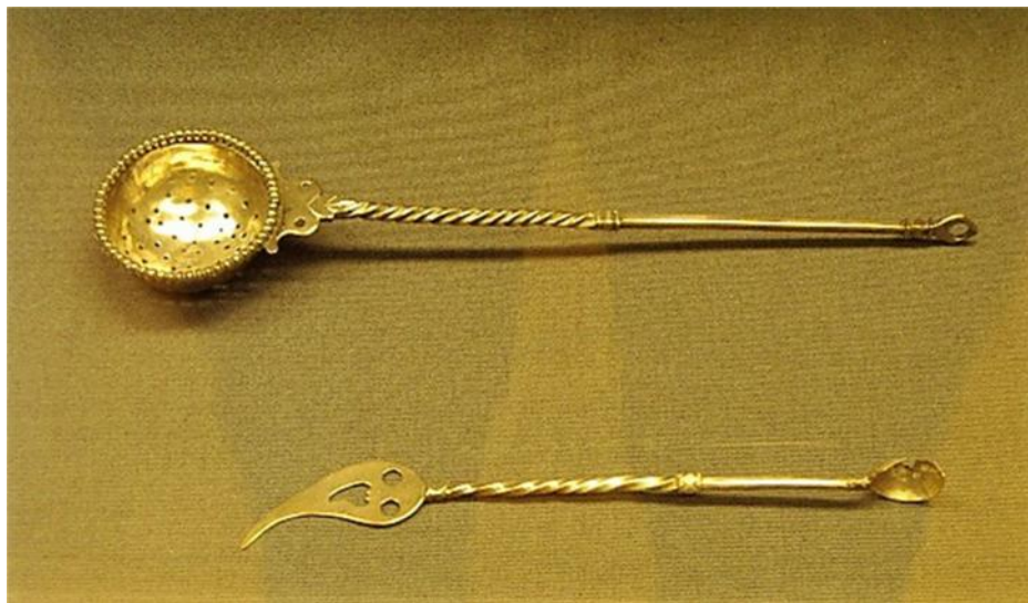
Fig. 46. Cucharas con un extremo afilado para extraer alimentos difíciles como caracoles.

Colección Farnese. Museo Arqueológico de Nápoles.