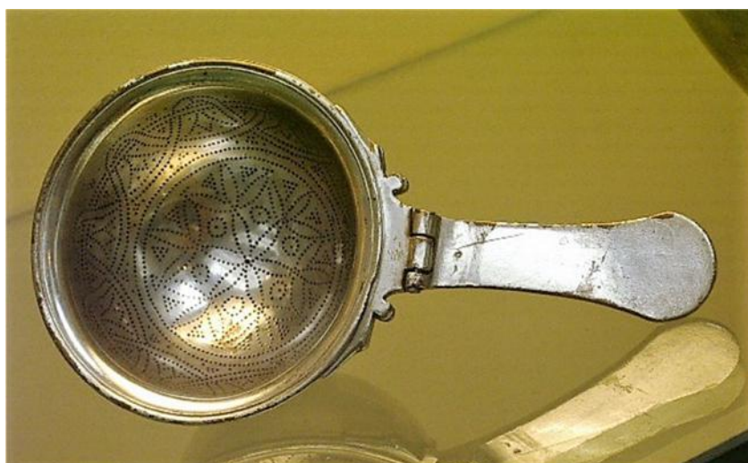
Fig. 48. Colum de plata. Colador de plata con brazo articulado. S. III d.C. Con la leyenda en el dorso del mango: p(ondo) S(emis) S(cripulum) . Chaourse, Francia. Museo Británico.

descartamos la presencia de esta técnica. Tampoco hay ninguno para presentar en las mesas, y únicamente observamos que se usa como instrumento práctico de trabajo. Otros coladores más sofisticados que éstos se utilizaron en las mesas, para colar nieve y refrescar las bebidas: Colum nivarium. setinos, moneo, nostra nive frange trientes: pauperiore mero tingere lina potes -Mart., Epigr. , 14, 103; 104-, o bien se usaba un simple trozo de lino - Apic., De re coq. , 132, 135, 136, 160, 163-. Uso este último también recogido por Catón, en forma de cribum farinarium -Cato., Agr. , 76, 3-, para el cernido de la harina o para separar las partes sólidas y líquidas durante la elaboración del queso.