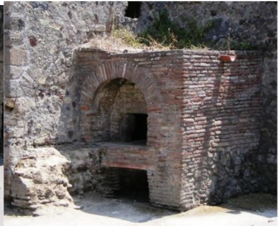
Figs. 18, 19, y 20. Cocina de la Villa de los Misterios. Pompeya