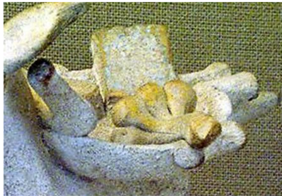
Fig. 3. (Incluyendo ampliación) Figura de terracota portando mortero y alimentos: cebollas, higos, queso... Corinto, 350 a.C. Museo Británico.