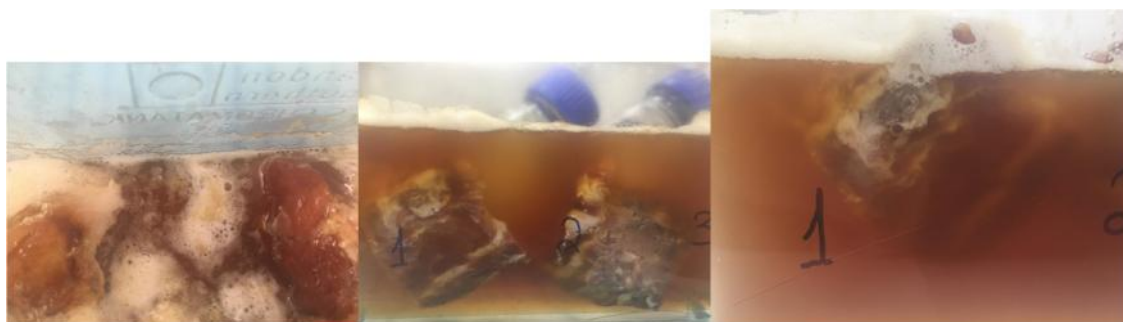
Figs. 27a, 27b y 27c. Desarrollo del proceso de conservación de carne cruda de cerdo en miel.

Paso 1: Inmersión de la carne en miel pura y cruda, de abeja.