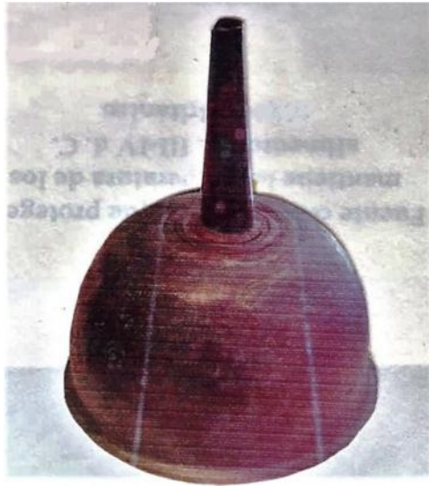
Fig. 49. Cornulum . Embudo de metal. Área vesubiana, s. I. d.C. Museo Arqueológico de Nápoles.