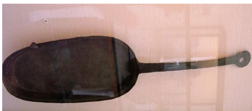
Fig. 61 y 62. Sartago . Dos modelos diferentes, una rectangular y otra redonda con piquera. Dotadas de ojal, ambas se pueden colgar en la pared de la cocina. Procedentes del área vesubiana, s. I d.C.