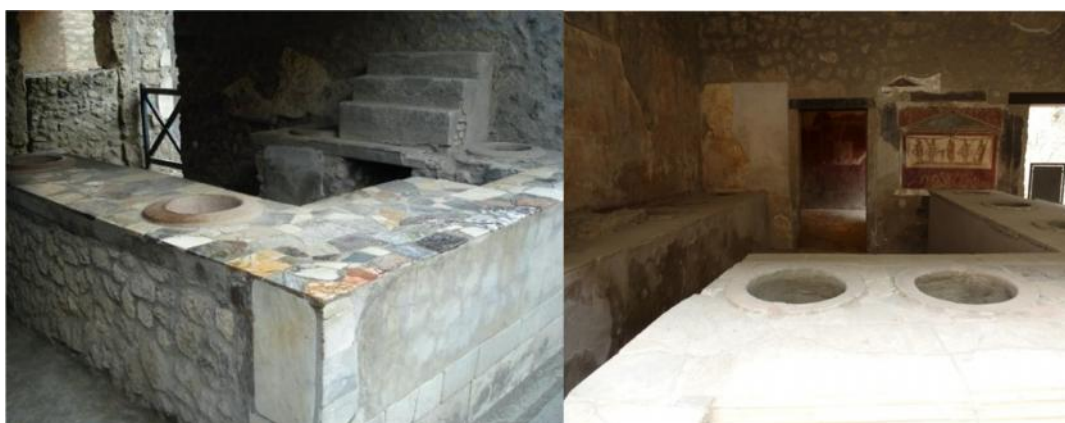
Figs. 13, 14 y 15. Mostradores para la venta de productos alimentarios. Popina de Vetutius Placidus (arriba y derecha) y Thermopolium en Via de la Abundancia (izquierda). Pompeya.