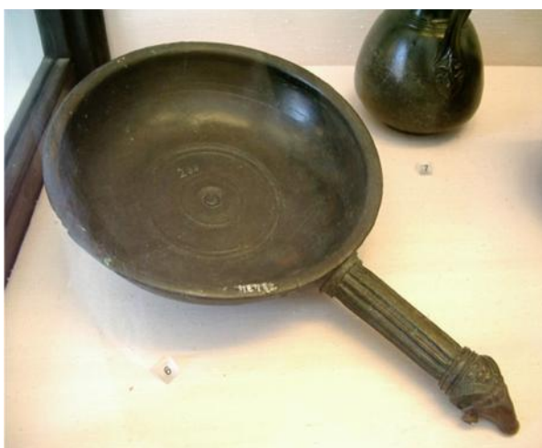
Fig. 59. Patella . Realizada en bronce, área vesubiana, s. I d.C. Museo Arqueológico de Nápoles

et immisis in patellam fictilem -Apic., De re coq. , 265-. Es un tipo de recipiente que servía para realizar pasteles o empanadas, como es el caso de la Patinam Apicianam... et in patella alternis , y de la Patina cotidiana -Apic., De re coq. , 141, 142-. Pero también tenía usos como sartén para cocinar una elaboración similar a las tortillas: In patellam subtilem adicies olei -Apic., De re coq. , 303-. También en la patella se cuece una cabra entera -Apic., De re coq. , 364, 366-. Para J. André, esta patella es el mismo utensilio que la patina 581 -Apic., De re coq. , 46, 133, 141, 142, 145, 146, 152, 157, 209, 265, 301, 303, 315, 364, 366, 417, 484-. Y según Varrón, es un plato hondo o cuenco de tamaño pequeño con el que se hacían libaciones durante la cena: Quod his libarent cenam, patellas -Varro., Ling. Lat. , 5, 25, 120-.