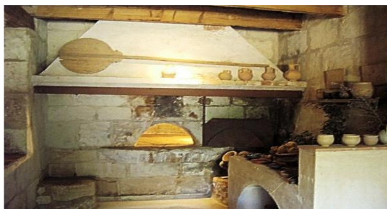
Figs. 16 y 17. Reconstrucción de cocina romana en el Museo del Vino de Beaucaire, Francia.

A. KEYS y su equipo detectaron una serie de importantes diferencias entre la preeminencia de enfermedades cardiovasculares en los países de la cuenca mediterránea y los datos de los Estados Unidos. Entre sus conclusiones, se encontró que la alimentación y el estilo de vida jugaban un papel esencial. Algunos artículos de este autor, en los que se desarrolla esta relación causa-efecto de la alimentación y la salud, así como el concepto de Dieta Mediterránea son: A. KEYS, “Coronary heart disease in seven countries”, Nutrition 13, 1997, pp. 249-253. Del mismo autor: “The diet and the development of coronary heart disease”, Journal of Chronic Diseases 4, 1956, pp. 364-380. Y finalmente, “Diet and coronary disease”, The Lancet 264, 1954, pp. 37-38.