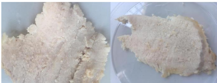
Carne que no ha pasado por la conserva en miel. Cocinada. Sabor tradicional.

Por otro lado, la miel también se mezclaba con otros ingredientes, compuestos que se usaban después para cubrir la carne y mantenerla en conserva, Apicio señala que el resultado es excelente en este caso: In senapi ex aceto, sale, melle facta mittis ut tegantur et, quando volueris, utere: miraberis 402 -Apic., De re coq. , 10-. De esta forma se preparaban manitas de cerdo y otras carnes gelatinosas: en primer lugar se mezclaban perfectamente distintas proporciones de vinagre, sal y miel. En segundo lugar se dejaba reposar la mezcla para después introducir la carne en ella. Podemos observar que la miel, por tanto, no solamente sería un simple endulzante, sino que tendría un papel predominantemente importante en alimentación, y desde luego resulta singularmente interesante como excipiente en la elaboración de las conservas.