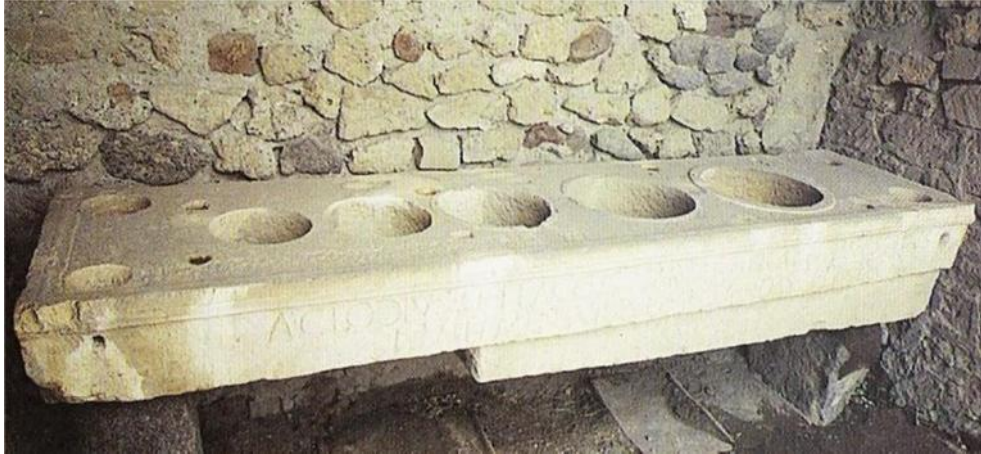
Fig. 10. Mesa ponderaria. Entorno del macellum pompeyano. Pompeya.