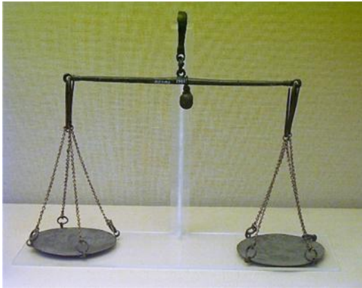
Fig. 11. Balanza de platillos. S. I d.C. Hamilton Collection. Museo Británico.