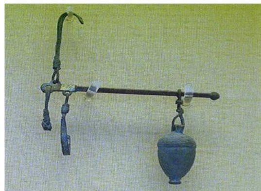
Fig. 12. Balanza con pesa, conocida popularmente como “romana”. S. I d. C. Museo Británico.