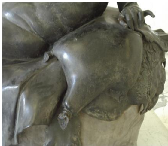
Figs. 25, 26. Uso de odres como contenedores de vino.

Representación de Sileno ebrio, 270-250 d.C. Copia del original del 270-250 d.C.