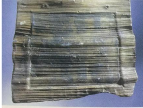
Fig. 1. Tabula cerata.

distancias y es que existió un comercio que traficó con productos de amplio margen de conservación, como las salazones, conservas, cereal o legumbres 53 .