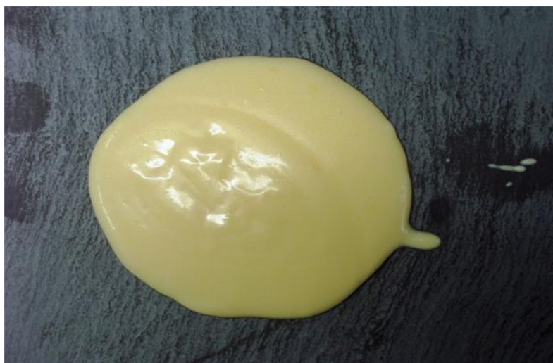
Figs. 64 y 65. Diferentes pruebas de emulsiones de agua con aceite y con huevo 625 .

Elaboradas mediante las instrucciones del recetario de Apicio.