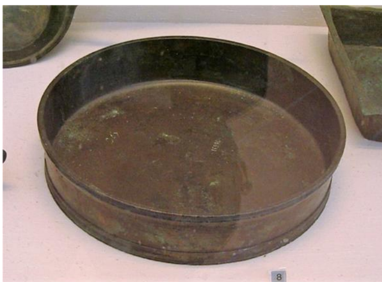
Fig. 60. Patina . Realizada en bronce, área vesubiana, s. I d.C.

para cocinar una famosísima y aparentemente disparatada preparación, el Escudo de Minerva -Suet., Vit. Vitel. , 13-. Se trata de un recipiente que presenta variados usos en De re coquinaria , como los siguientes: para mezclar ingredientes, como plato para servir y también como cacerola para guisar. En la patina se colocan la salsa ya elaborada y la comida propiamente dicha, y después se cocinan juntos –Apic., De re coq. , 377, 386-. Durante el proceso de cocinado, la patina se coloca en el horno o en un thermospodium – Apic., De re coq. , 437, 131-. Además de ser un instrumento con todos estos usos, hay un plato llamado patina .