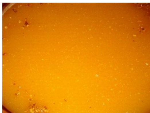
Figs. 32 y 33. Mosto fermentando, con el característico borboteo. Museo del Vino, Beaucaire, Francia.