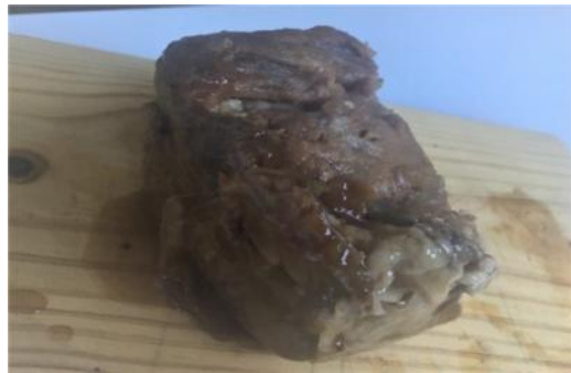
Fig. 28. Pieza de carne tras el proceso de inmersión en miel, cocinada.

Tras el desarrollo de un proceso de cocinado idéntico, tenemos para dos piezas de carne de idéntico peso y tamaño