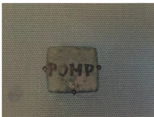
Fig. 5. Estampilla entregada a cambio de una ración de trigo, emitidas posiblemente como pago del reparto de cereal. Museo Británico

para grupos populares, mientras que los decuriones participaban en banquetes más exquisitos en los que se servía la tan preciada carne señalada anteriormente. Está clara la calidad alimentaria del crustulum et mulsum , en la que participaba la mayor parte de una población, y que era bastante mediocre: un reparto modesto destinado a los sectores populares 143 . Por otro lado, no todos los grupos sociales eran beneficiarios de todos los repartos, y mientras unos recibían alimentos saciantes y simples como estos, otros festejaban los acontecimientos en banquetes comunes o lex epula , o bien en las más prestigiosas cena decurionales 144 . Es lo que J. F. Donahue llama “segregative commensality”, es decir, la limitación de participación en el acto de compartir una comida, lo que por otro lado provoca el refuerzo de la identidad del grupo 145 . A partir del tribunado de Cayo Graco, en el 123 a.C., el reparto de trigo se realizó mensualmente y para cada ciudadano, a expensas del erario público (Figs. 5 y 5a). Una lex frumentaria de Graco, instituida en el marco de la Ley Sempronia, vino oportunamente a calmar problemas de abastecimiento en la Roma del decenio del 120 a.C., asegurando el precio del modio de trigo -unos 8’75 litros- a 6 y \frac{1}{3} ases -Appian., De bellis civ. , 1, 21-.