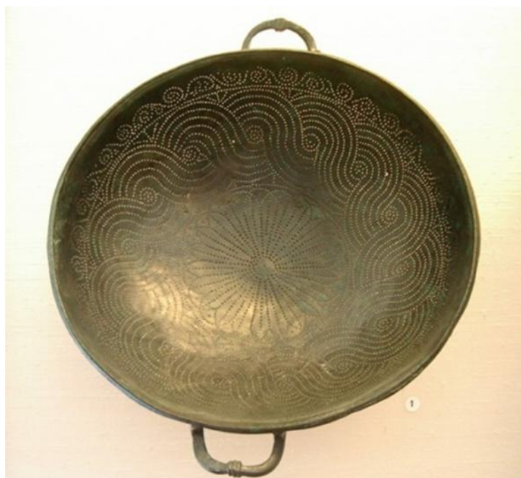
Fig. 47. Colum . Amplio colador con asas. Área vesubiana, s. I d.C. Museo Arqueológico de Nápoles.

10-Filtro para afinar una mezcla de huevos y leche -Apic., De re coq. , 302-.