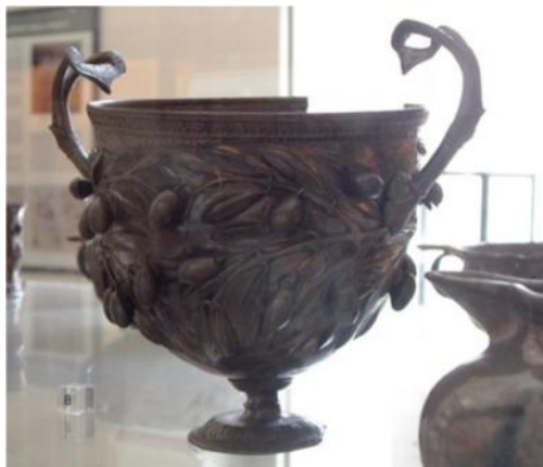
Fig. 38. Calix . Copa con decoración de aceitunas que hace referencia a la fertilidad de la naturaleza.