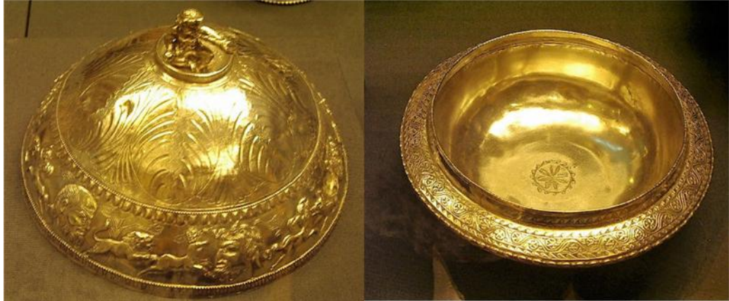
Fig. 42a y 42b. Fuente y campana de plata, para el servicio de mesa como el sugerido por el ficticio Trimalción.

Fuente con tapadera que protege y mantiene la temperatura de los alimentos, así como la concentración del aroma. S. III-IV d.C. Mildenhall Treasure.