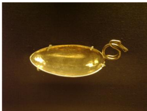
Fig. 43. Cuchara de plata. Grabada con dedicatoria a Fauno. Treasure Trove. Thetford, Norfolk. S.

muy similares a las que utilizamos actualmente, con un mango que frecuentemente está adornado en su extremo. Existe otro tipo de cuchara, cochleare , más pequeña que la anterior, aunque tanto una como otra servían, como Isidoro, Apicio y Columela confirman, para dosificar y medir las cantidades más pequeñas -Isid., Orig. , 16, 26, 3; Apic., De re coq. , 53, 111, 152; Colum., R.R. , 12, 21, 3-.