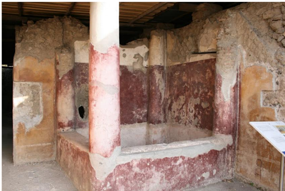
Fig. 9. Estanque para peces, Villa Ariadna. Stabia, Italia.

provenían de mar o de lagos y ríos. Por su parte, la pesca marítima era libre, según P. Ørsted, con excepción de los derechos que se hubieran transferido a las ciudades estado, de acuerdo con la antigua tradición o privilegios específicos 184 . Y por el otro lado, la pesca en aguas dulces era una actividad que sí se encontraba sujeta a regulación –Dig., 43, 14, 1.7; 43, 14, 2-.