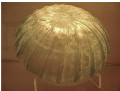
Fig. 35. Amburvum . S. II d.C.

Amburvum. (Fig. 35) Recipiente curvado 532 , descrito por Varrón: Amburvo fictum ab urvo, quod ita flexum ut redeat sursum versus ut in aratro quod est urvum -Varro., Ling. Lat. , 5, 27, 127-.