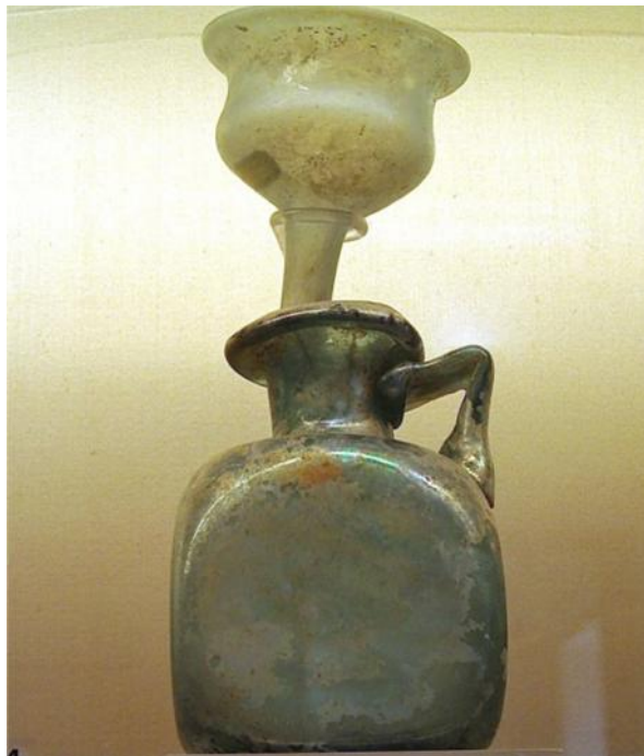
Fig. 50. Cornulum . Embudo de cristal. Área vesubiana, s. I. d.C. Museo Arqueológico de Nápoles.