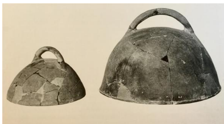
Fig. 41. Campana de Clibanus . Horno portátil.

Clibanus 541 (Fig. 41). Era un tipo de horno con tapadera o campana realizado en metal o tierra cocida, dotado de doble pared y calentado por la parte del fondo, de forma que el calor se repartiera a lo largo del espacio situado entre las paredes 542 . De esta forma, los alimentos contenidos se horneaban homogéneamente. Era un instrumento diferente al horno fijo, no existe una posible confusión, como observamos en De re coquinaria: in tegula positos mittes in furnum aut farsos in clibano coques -Apic., De re coq. , 397-. En el clibanus , además de las piezas de carnes y pescados más elaboradas, se cocía habitualmente el pan -Isid., Orig. , 15, 6, 5-. Algunos incluso estaban elaborados en materiales nobles, por ejemplo en plata, como el que paseaba alrededor de la mesa un esclavo de Trimalción, ofreciendo pan caliente a los invitados, una imaginaria demostración por parte de Petronio de la excentricidad de las clases emergentes de libertos enriquecidos -Petron., Satyr. , 35, 6-. Que sin embargo, pudieron ser algo más que leyenda, como observamos en la figura.