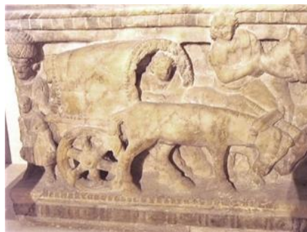
Fig. 2. Bajorrelieve de una urna funeraria. Viaje en carpentum .

se consideraba una velocidad muy elevada y excepcional 84 . Por su parte, la silla de mano era un transporte corriente, que Plinio el Viejo usaba frecuentemente. Es precisamente este último autor quién atribuye a los frigios la invención de uncir dos caballos al carro –Plin., N.H. , 7, 202-. Juvenal cuenta su salida de Roma en pleno verano con un amigo, huyendo de los incendios y del calor estival, montados ambos en un carro en el que cargó todas sus pertenencias 85 –Iuv., Sat. , 3, 10-. Entre todas las posibilidades de vehículos de viaje, lujosos o sencillos, individuales o colectivos, las mercancías tenían un transporte propio (Fig. 2). Eran los rústicos carruajes plaustra y serruca . También los hubo lujosos, cubiertos o llevados por mulas con largos varales, e incluso vehículos rapidísimos, tirados por dos caballos, la biga 86 . Para el transporte de muchos pasajeros y de mercancías existían otro tipo de vehículos.