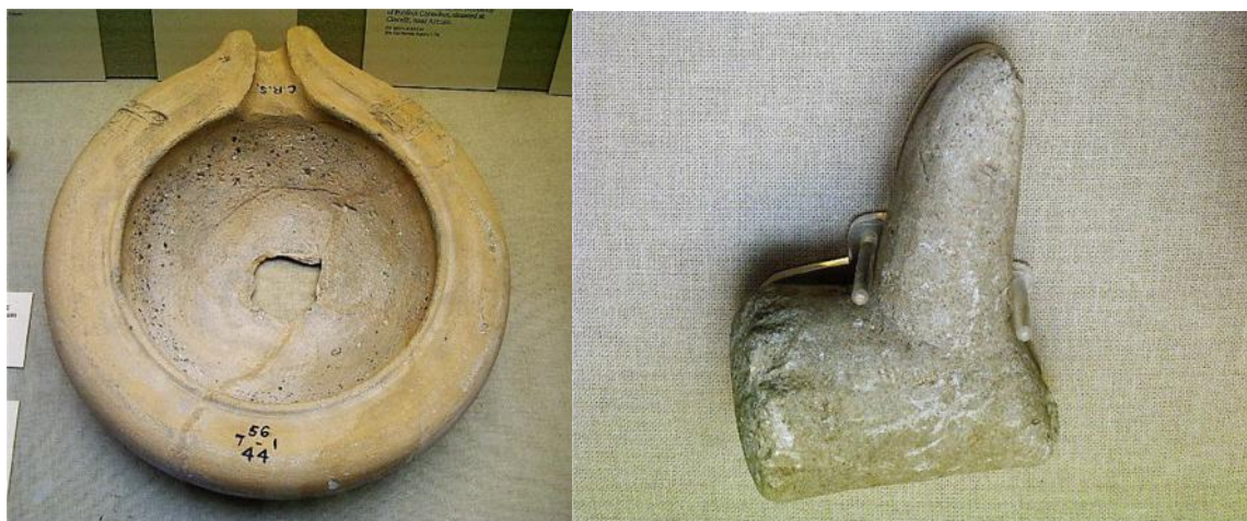
Figs. 57 y 58. Mortarium .

Mortarium. (Figs. 57 y 58) El mortero es uno de los utensilios más antiguos conocidos, y junto con los cuchillos formó parte del repertorio básico de instrumentos de cocina 573 . Utilizados en medicina y en cosmética, los usos alimentarios del mortero se remontan a épocas muy antiguas y siguen conservando su uso en la cocina moderna. Realizados en piedra, madera, metal o incluso cerámicos, la utilidad y el coste de los morteros permitieron su acceso a todos los sectores sociales.