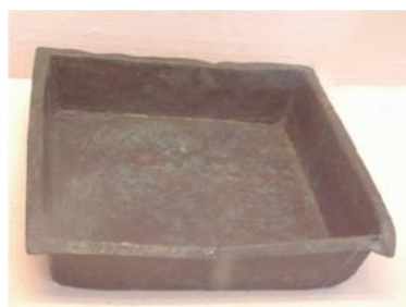
Fig. 36. Angularis . Área vesubiana. S. I d.C.

Angularis. (Fig. 36) Terrina de base rectangular y bordes elevados, para poner en el fuego, que se empleaba para hacer timbales o para marinar los alimentos 533 , usada por Apicio: Angularem accipies qui versari potest , y también: ...in angularem refundis simul cum ofellis -Apic., De re coq. , 187, 262-.