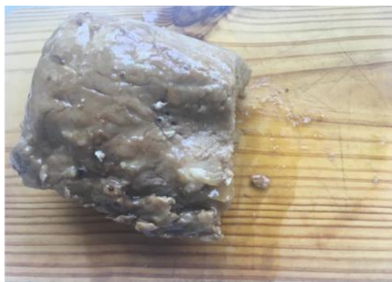
Fig. 29. Pieza de control cocinada con la misma receta, pero fresca.