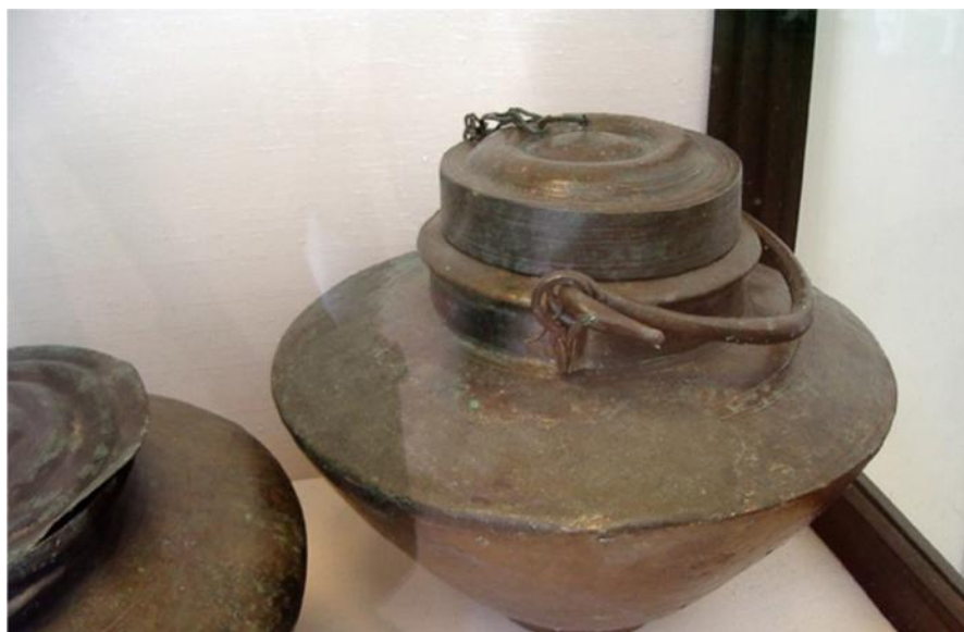
Fig. 37. Caccabus . Pompeya, 15, VII, 3. Del s. I d.C. Museo Arqueológico de Nápoles.

cuanto a los materiales, podía estar confeccionada en barro, en estaño o en bronce - Dig. , 34, 2, 19, 12-, y era sin duda, el recipiente común donde se guisaba 535 , como señala Varrón: Uas ubi coquebant cibum, ab eo caccabum appellarunt -Varro., Ling. Lat. , 5, 127-. Morfológicamente se trata de un recipiente de boca ancha, que se situaba encima de un trípode colocado sobre el fuego, y era algo picudo por abajo, para mantener su estabilidad - Apic. , De re coq. , 46, 50, 57, 71, 74, 119, 132, 141, 142, 158, 163, 165, 166, 168-171, 173-175, 177, 179, 181-184, 187, 188, 190, 193-195, 198, 201, 202, 210, 212, 214, 217, 232, 249, 263, 292, 316, 317, 358, 366, 371, 373-377, 387-390, 433, 434, 469, 477, 483, 484, 492, 495-. De usos similares a la patina , (vide infra), como observamos en Digesto, Item caccabos et patinas in instrumento fundici ese dicimus, quia sine his pulmentarium coqui non potest - Dig. , 33, 7, 18 (3)-, fuente que nos confirma que sin ellos los cocineros no podrían hacer puls , lo que figuradamente significa que no podían cocinar.