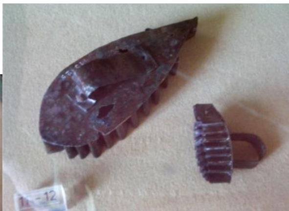
Figs. 52-54. Formella . Diversos moldes con formas variadas para preparar patinas, flanes y para cortar masas. (corazón, liebre, hojas). Realizados en bronce, área vesubiana, s. I d.C.