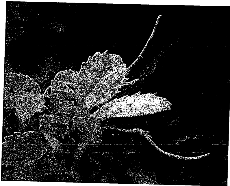
Fig. 1. Lysionotus apicidens ( L. warleyensis ). Isl. Okinawa, near Yaedake.

般に葉の幅が広く、基部は円形または鈍形で、葉柄に流れないか、僅かに流れる。中国のものは葉形に変化が多いが、シシランのように葉の基部が次第に葉柄に流れるものは見当たらない。別種として扱われるべきものであろう。別種として扱う場合、この種類の最も早い学名は広東から報告された Aeschynanthus apicidens Hance であるから、これを組変えた学名を使わなければならない。