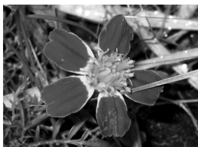
Tagetes patula L.