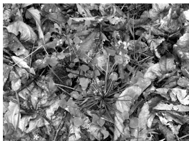
Claytonia perfoliata Willd.