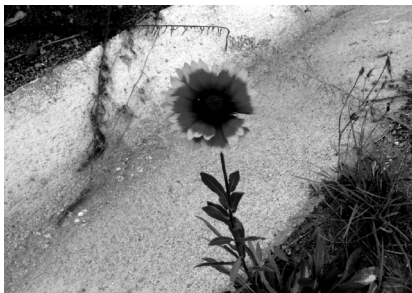
Gaillardia aristata Pursh