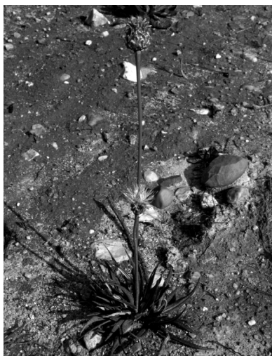
Rhabonticum longifolium (Hoffmanns. & Link) Soskov