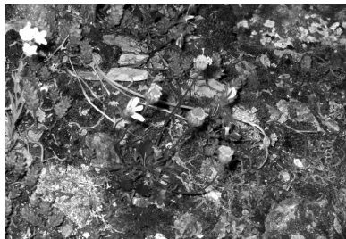
Jacobaea minuta (Cav.) Pelsler & Veldkamp