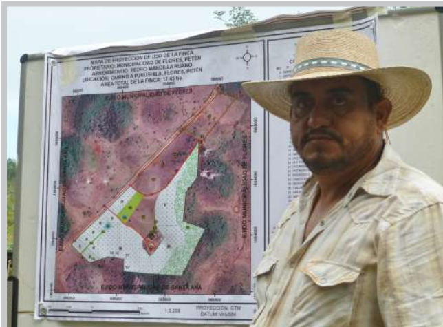
Granja con sistema silvopastoril en Petén