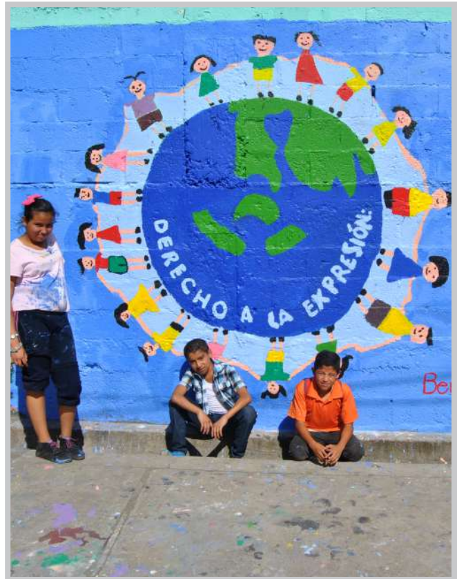
Murales sobre los derechos

La Kindernothilfe en coordinación con la Oficina de Derechos Humanos del Arzobispo de Guatemala (ODHAG) impulsó y desarrolló el proyecto Fortaleciendo los Derechos a la Participación y Protección de la Niñez en tres comunidades de Guatemala que promueve el buen trato, la resiliencia, la disciplina familiar con amor y límites así como la garantía del cumplimiento de derechos, como bases fundamentales para la construcción de una cultura de paz en Guatemala. Se desarrolla en los municipios de San Miguel Petapa, Villa Nueva y Mixco que están altamente afectados por situaciones de violencias que vulneran y violentan los derechos y la integridad de la niñez y adolescencia. Se busca fortalecer los roles de protección y cuidado en las familias y escuelas y empoderar a las niñas, niños y jóvenes como sujetos de derechos con proyectos de vida viables.