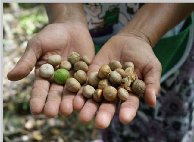
Nuez de ramón