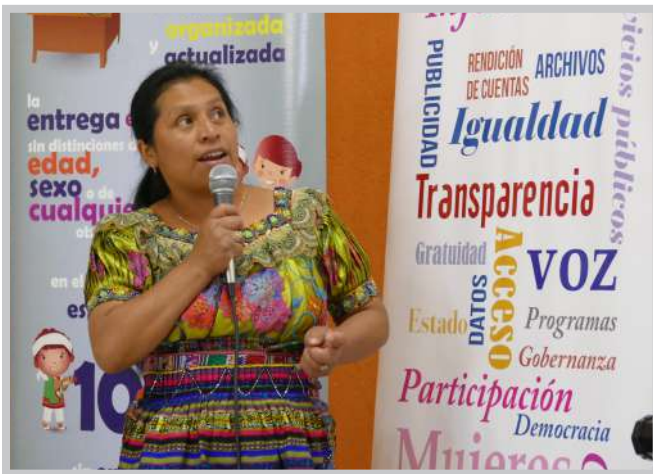
Taller sobre transparencia, El Quiché