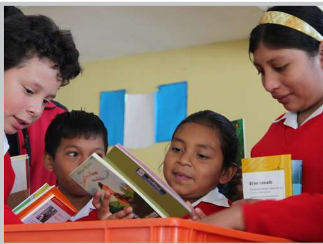
Alumnos revisando libros de su minibiblioteca

La cooperación en el sector de educación se concentra en las zonas de escasos recursos y rurales del país, con particular énfasis en el desarrollo de los pueblos indígenas respetando su identidad cultural y lingüística. Durante los primeros años la cooperación en este sector se dirigió a la educación pre-escolar y primaria. Más tarde se incluyó gradualmente el ciclo básico (grados 7 a 9) y el ciclo diversificado (grados 10 a 12) de la educación media y de estos especialmente los bachilleratos con orientación ocupacional y para peritos técnico-profesionales. Esta cooperación tiene como objetivo mejorar y ampliar el acceso a una educación de calidad orientada al fomento del emprendimiento y a las necesidades del mercado laboral para jóvenes pobres, especialmente indígenas localizados en zonas rurales. Es esencial para el desarrollo de un país que los jóvenes tengan la ocasión de recibir una formación que les permita ingresar en el mercado laboral y desempeñar funciones con responsabilidades y también que el mercado laboral pueda contar con suficiente personal calificado.