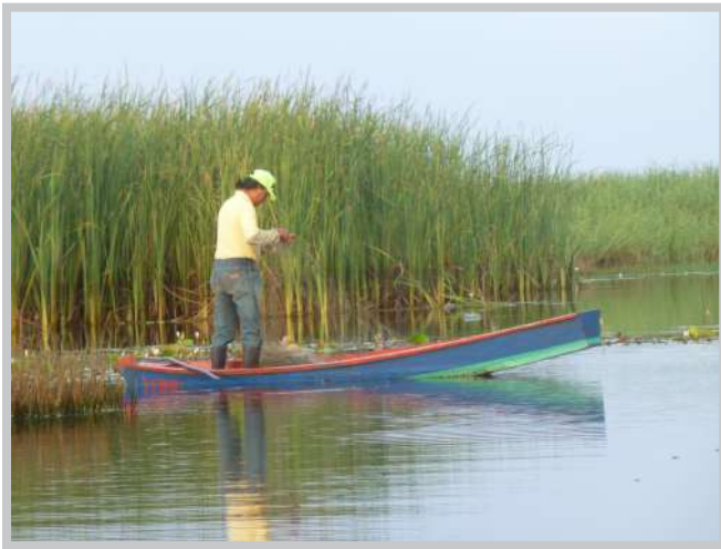
Pescador en la costa del Pacífico

grupos marginalizados de la población, principalmente aquellos que se encuentran en las áreas rurales y a los pueblos indígenas. Con ello la cooperación pretende contribuir a la lucha contra la pobreza en Guatemala. Se debe también mencionar que el enfoque de género y la situación de las mujeres son ejes transversales de la Cooperación Alemana en general.