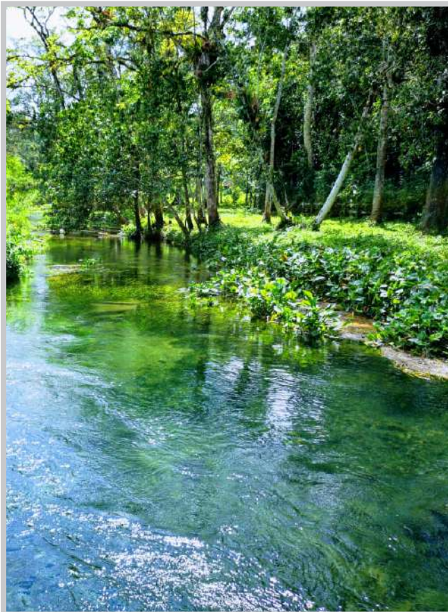
Bosque de galería

La ONG Defensores de la Naturaleza tiene como fin la protección de los bosques y reservas naturales del país en armonía con el desarrollo humano. El proyecto Lacandón - Bosques para la Vida trabaja para la conservación y el uso sostenible del bosque en el Parque Nacional Sierra del Lacandón en cooperación con las comunidades locales. Gracias al proyecto se han protegido alrededor de 117,662 hectáreas de bosques y 6,308 hectáreas fueron reforestadas. Con la participación directa y activa de unas 600 familias en 6 comunidades se han implementado actividades agroforestales así como planes de manejo de uso sostenible de los recursos.