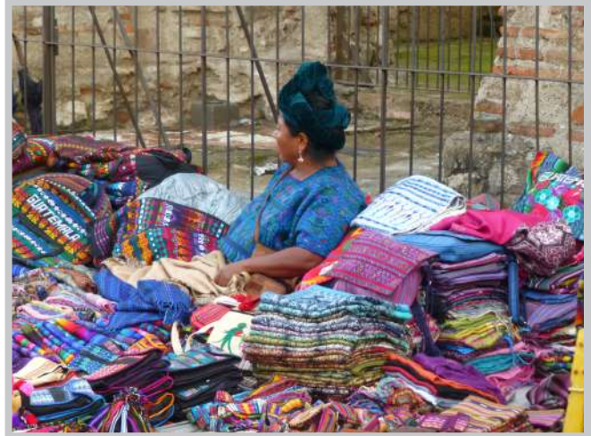
Mercado en Antigua

Entre los muchos proyectos bilaterales cuyos logros son dignos de mención cabe destacar la creación del Intecap como la institución más importante en la actualidad para la formación profesional, el fomento de la excavación y la conservación de las ruinas mayas de Yaxhá, Nakúm y Naranjo así como la implementación del Ranking Municipal como una herramienta política para evaluar la gestión de las municipalidades.