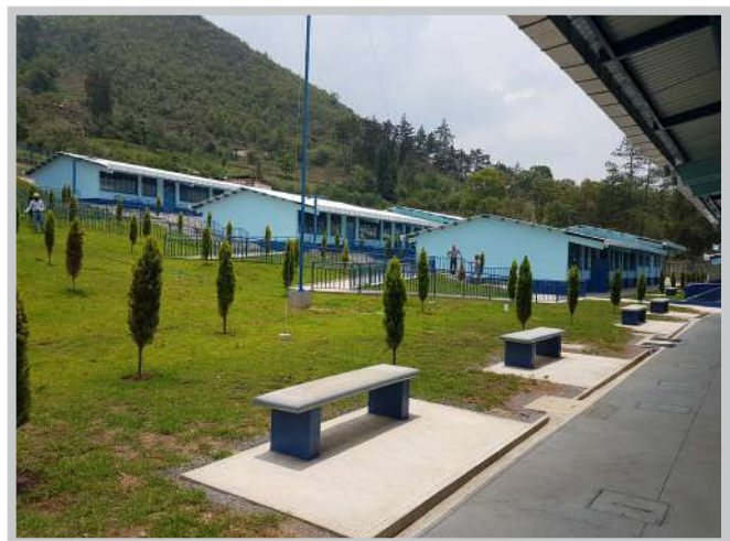
Nuevo Instituto Nacional Básico en Cunén, Quiché

Los siguientes proyectos se están realizando actualmente: