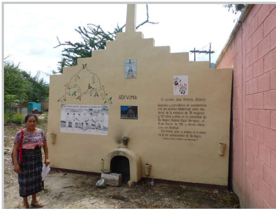
Memorial en Rabinal

Para más información: https://www.ziviler-friedensdienst.org/es