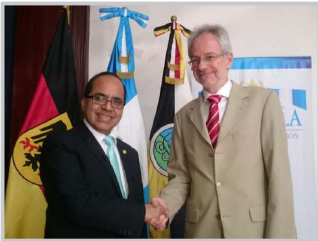
Consultas políticas entre Guatemala y Alemania

La cooperación bilateral está basada en acuerdos vinculantes que ambos países negocian cada dos años en negociaciones intergubernamentales. En 2018, Alemania asignó un monto de 13 millones de euros para nuevas medidas. Del lado alemán, el Ministerio Federal de Cooperación Económica y Desarrollo (BMZ) define los lineamientos estratégicos de esta cooperación y encarga a las agencias implementadoras de la Cooperación Alemana con la ejecución de programas y proyectos. Éstas son para la cooperación técnica la Gesellschaft für internationale Zusammenarbeit (GIZ) y el Instituto Nacional de Metrología de Alemania (PTB) así como para la cooperación financiera el Banco