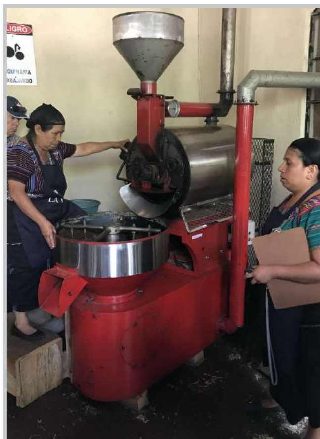
Tostado de café

Entre 2014 y 2016, los pequeños agricultores en el Corredor Seco de Guatemala habían perdido en promedio más de la mitad de sus cultivos de maíz y frijol. En general no cuentan con los recursos suficientes para adquirir sistemas de riego para contrarrestar la sequía y salvar sus cultivos. Los métodos de cultivo adaptados a las consecuencias del cambio climático son desconocidos. El programa Desarrollo Rural y Adaptación al Cambio Climático (ADAPTATE) ayuda con medidas de capacitación para mejorar las condiciones de la población afectada y de los municipios. Asimismo, se capacita a los ministerios relevantes para desarrollar estrategias de cara al cambio climático. Otra tarea importante del proyecto es la adquisición y el análisis digital de información climática en la plataforma GeoPortal que sirve para la implementación de medidas de adaptación en las comunidades y aldeas del Corredor Seco.