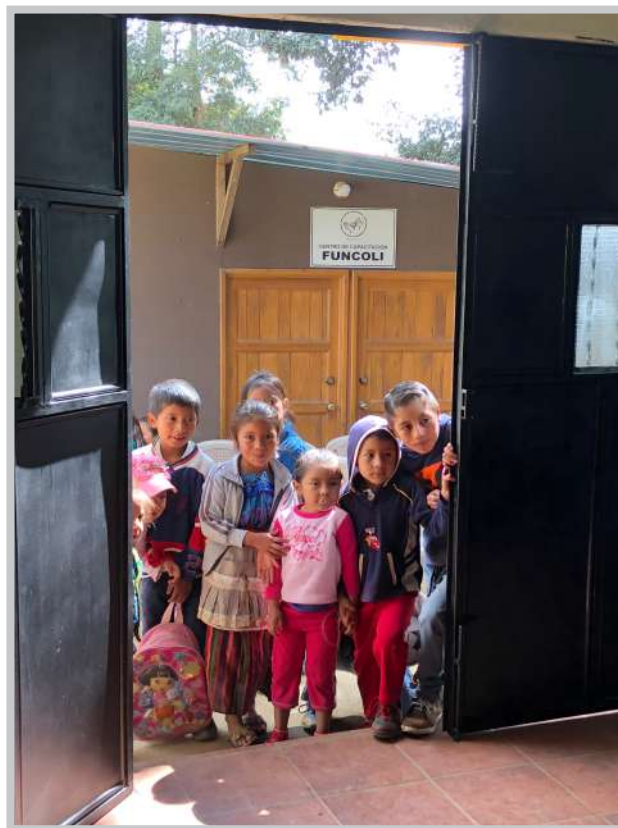
Salones de usos múltiples en aldea Vuelta Grande

Para más información: https://guatemala.diplo.de/gt-es/themen/wirtschaft/-/2005116