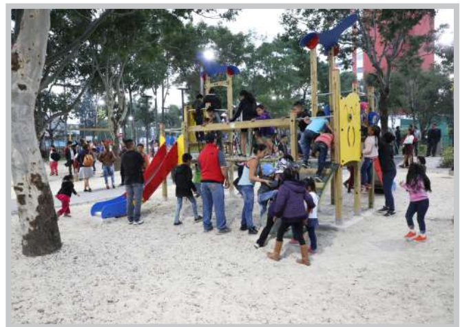
Espacio generado por CONVIVIR en Plaza Berlín