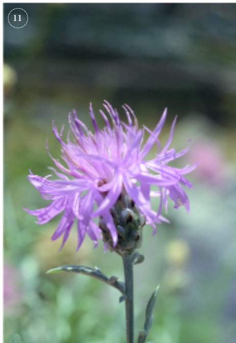
Figg. 8-11 - 8) Soldanella minima Hoppe subsp. samnitica Cristof. & Pignatti (foto F. Conti); 9) Pinguicula fiorii Tammaro & Pace (foto F. Conti); 10) Iris marsica I. Ricci & Colas. (foto F. Conti); 11) Centaurea tenoreana Willk. (foto D. Di Santo)