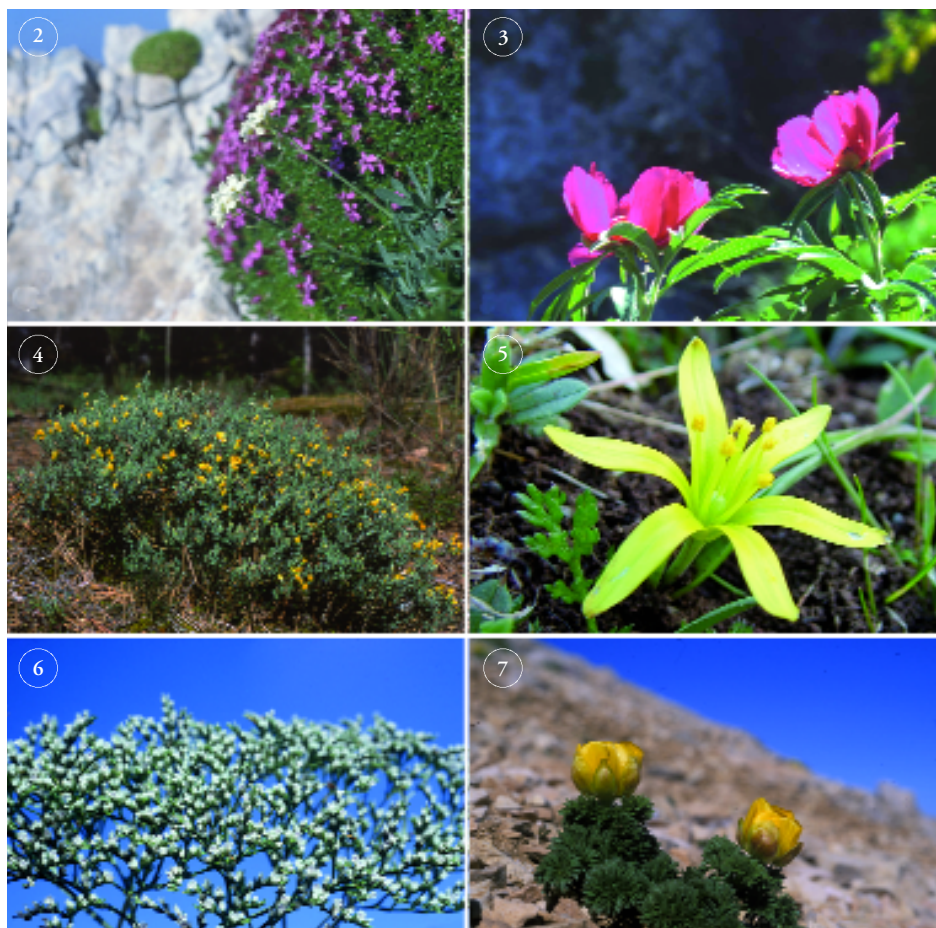
Figg. 2-7 - 2) Ptilotrichum rupestre (Ten.) Boiss. subsp. rupestre (Foto - D. Tinti); 3) Paeonia officinalis L. subsp. italica N.G. Passal. & Bernardo (foto D. Tinti); 4) Genista pulchella Vis. subsp. aquilana F. Conti & Manzi (foto D. Tinti); 5) Gagea tisoniana Peruzzi, Bartolucci, Frignani & Minutillo (foto F. Bartolucci); 6) Goniolimon italicum Tammaro, Frizzi & Pignatti (foto D. Di Santo); 7) Adonis distorta Ten. (foto F. Conti)

destinate ad aumentare con il progredire delle conoscenze tassonomiche dei gruppi critici. A queste piante va aggiunto Ranunculus marsicus Ten. & Guss. una agamospecie dell'aggregato R. gr. auricomus per il momento inclusa nel gruppo (Conti et al., 2005). Per ogni entità sono indicati: basionimo, estremi bibliografici del nome, forma biologica, presenza nei piani altitudinali (collinare, fino a 1.000 m; montano da 1.000 a 1.900 m; subalpino, da 1.900 a 2200 m; alpino, oltre 2.200 m), distribuzione regionale (P, presente nella regione; D, presenza dubbia; NC, non più ritrovata, NP, entità non presente segnalata in precedenza per errore), categoria IUCN a livello nazionale (Conti et al., 1997).