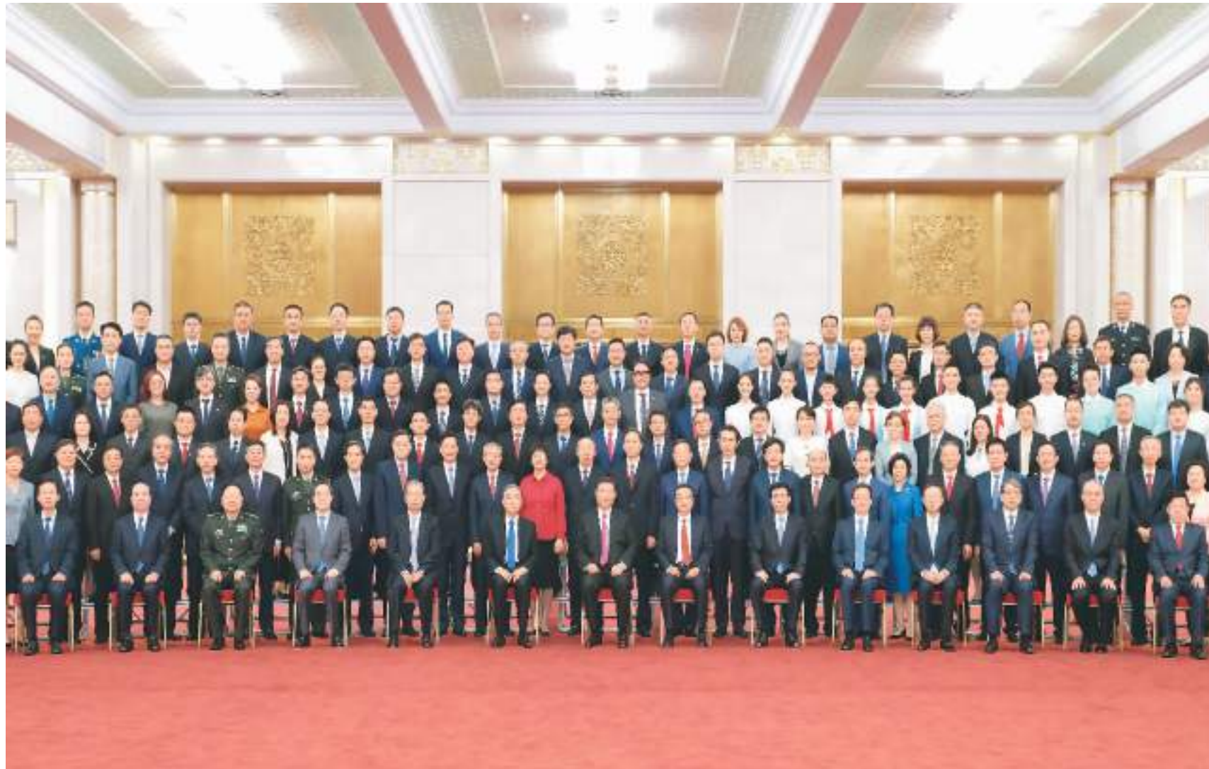
七月十三日,党和国家领导人习近平、李克强、汪洋、王沪宁、赵乐际、韩正等在北京人民大会堂会见中国共产党成立一百周年庆祝活动筹办工作各方面代表。

■ 要结合做好庆祝活动后续工作,全面深化拓展庆祝活动成果,奋力推进各项工作,确保“十四五”规划和第二个百年奋斗目标开好局、起好步。