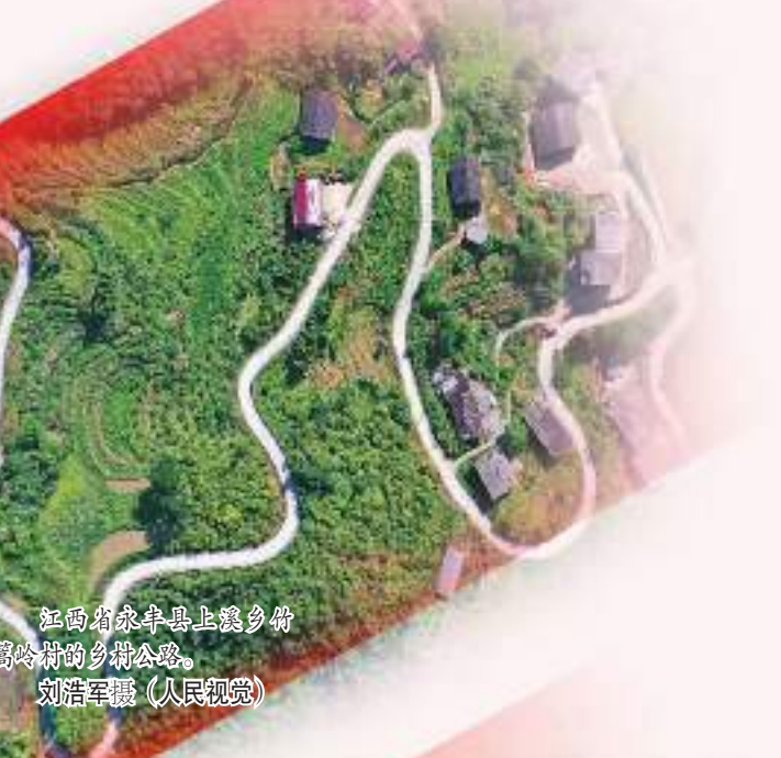
江西省乐安县上犹乡竹筒岭村的乡村公路。

没有全民健康，就没有全面小康。要把人民健康放在优先发展的战略地位，以普及健康生活、优化健康服务、完善健康保障、建设健康环境、发展