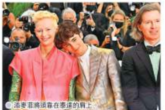
添麥菲將頭靠在泰達的肩上。

此外,康城影展發生閉門失竊案,英國女星萊迪史密夫(Jodie Turner-Smith)早前佩戴名牌鑽飾出席電影《After Yang》首映禮,其後發現珠寶於上周五在康城酒店被盜竊,損失包括耳環和項鍊價值數萬美元(約值數十萬港元)的珠寶首飾,其中包括她母親的結婚戒指。不幸中的大幸是早前活動結束後,品牌公關已即時收回名貴飾物,否則損失將更慘重。