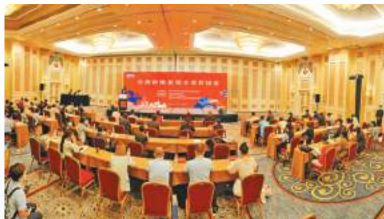
桂澳兩地旅遊企業對接會現場