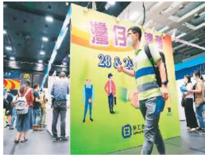
香港特区政府劳工处举办的大型招聘会吸引不少年轻人前来求职。