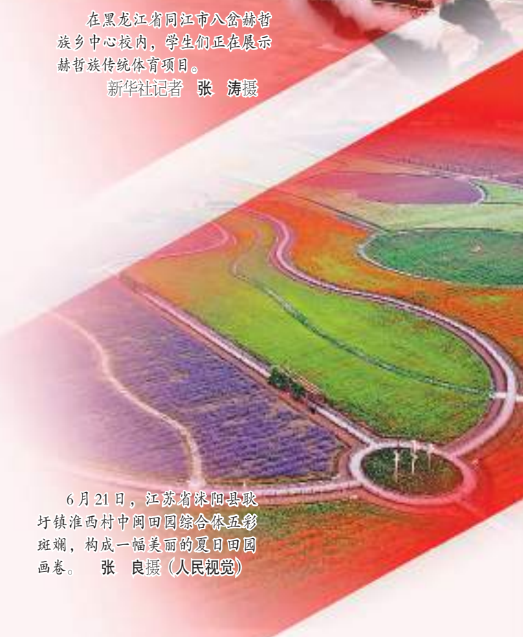
在黑龙江省同江市八岔赫哲族乡学校内，学生们正在展示赫哲族传统体育项目。