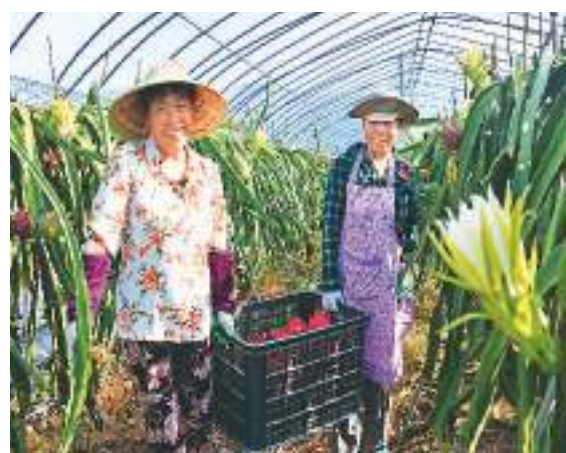
7月13日，浙江省台州市仙居县台湾农民创业园引进种植的台湾原生种高脚大红火龙果迎来丰收季。因为农民正采收红火龙果。