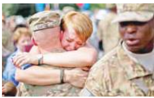
驻阿美军士兵完成在阿富汗的任务之后回国,与家人团聚。

然而,随着美国宣布从阿富汗撤军,塔利班组织控制了更多阿富汗领土。美联社报道,在过去的15天里,塔利班的攻势已将5600多个家庭赶出家园,其中大部分都发生在北部地区。有分析更是指出,一旦美国军事行动完成,阿富汗可能爆发内战。据阿富汗当地电视台援引消息人士报道,包括阿富汗前总统卡尔扎伊、民族和解高级委员会主席阿卜杜拉在内的数名政治人物,周末将前往卡塔尔首都多哈与塔利班代表团举行谈判。