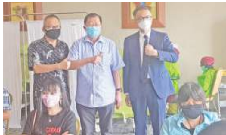
蔡志烽总领事(右起)、张锦雄、周维梁在疫苗接种现场

每位海外中国公民的生命安全和身体健康。自3月7日中国国务委员兼外长王毅宣布推出“春苗行动”以来,外交部和各驻外使领馆积极行动,协助中国在外同胞接种疫苗。