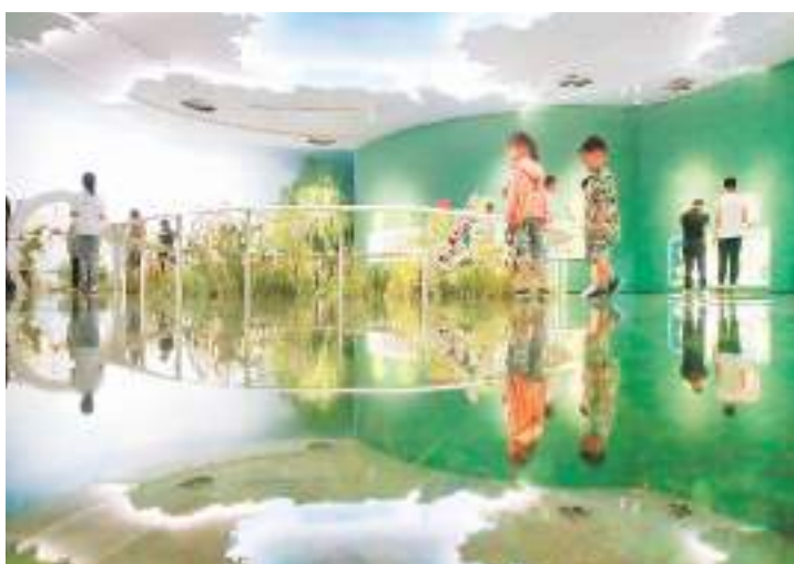
暑假期间，位于江苏省扬州市运河三湾生态文化公园的扬州中国大运河博物馆吸引了众多家长和学生。图为7月13日，小朋友们在博物馆内参观。