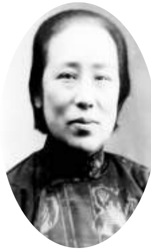
何香凝照片（资料图片）

1931年“九·一八”事变后，全国人民对蒋介石“攘外必先安内”和不抵抗政策非常反感，何香凝更是义愤填膺。为了表达自己的立场和愤怒，督促蒋介石抗日，何香凝以给蒋介石寄女人裙子的方式，讽刺蒋介石没有男子气概，不敢抗日。“九·一八”事变时送了一套，1932年“一·二八”淞沪抗战时又送了一套，1935年“何梅协定”签订后再送一套。其中一次，何香凝还附了一首诗——《为中日事赠蒋介石及中国军人的女服有感而咏》：