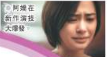
● 阿嬌在 新作演技 大爆發。

色,不惜狠心剪掉10吋其所喜歡的長髮,以幹練短髮造型來詮釋角色。電影中,阿嬌也展現出強大的演技感染力,每一個動作、情緒都能牽動觀眾的內心,演技自然;各種情緒轉換,完美演繹了在面对傷害時的害怕无助;通過眼神、傳遞着在面对丈夫時內心的矛盾與掙扎,愛恨糾葛、命運糾葛的故事。電影自播當日,播放平台上熱度持續高走,而各網站的話題討論熱度不斷增溫。對於阿嬌的表現,網民紛紛表示:「代入感好強!」、「表演很有層次感!」、「讓人眼前一亮!」。