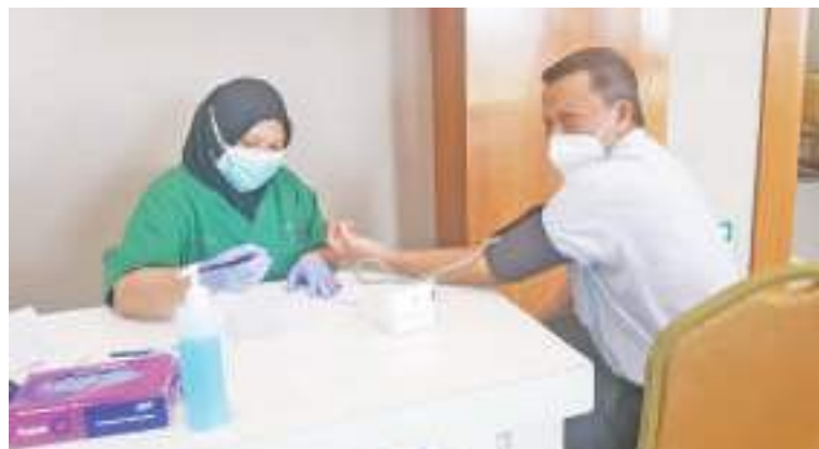
医疗人员为接种者量血压