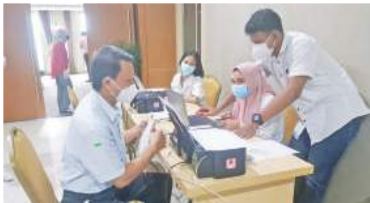
接种前登记个人资料