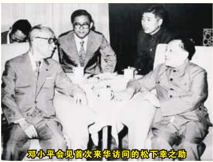
邓小平会见首次来华访问的松下幸之助

君子间的约定，四十余载初心不改。邓小平与松下幸之助的“君子之约”是中日友好交往的精彩剪影，是中国改革开放加速发展的重要助力，是中国共产党人谦虚务实、奋勇开拓的有力见证。时至今日，松下集团同中国仍有着良好合作，续写着中日友好新篇章。面向未来，中国将继续敞开心扉，打造世界舞台，诚邀国际友人，谱写更多“君子之约”。