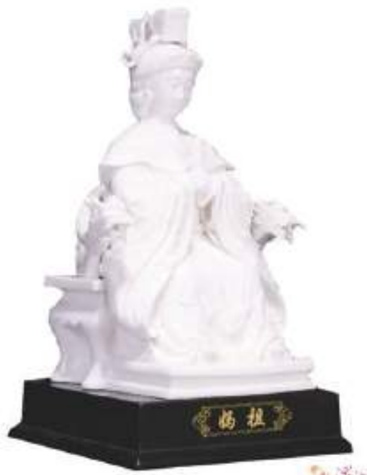
圖為陶瓷媽祖聖像。