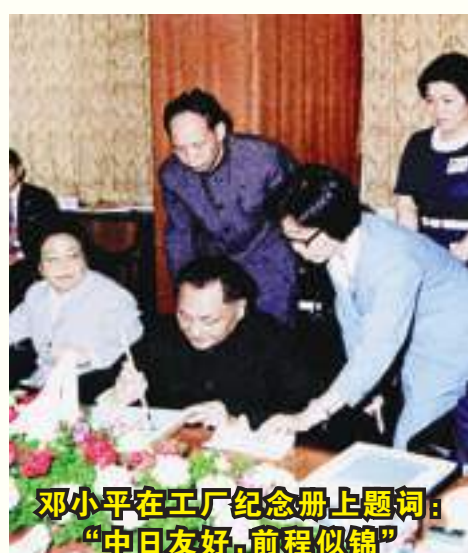
邓小平在工厂纪念册上题词：“中日友好，前程似锦”

40余年改革开放，中国向世界传递的是真挚的情谊、谦逊的品格、合作的诚意。中国也未忘记为改革开放做出卓越贡献的外国友人。在庆祝改革开放40周年大会上，十位国际友人被授予中国改革友谊奖章，其中一位便是被誉为“经营之神”的日本松下电器创始人松下幸之助。作为中国改革开放的见证者和参与者，他与“总设计师”邓小平的君子之约至今为人称道。