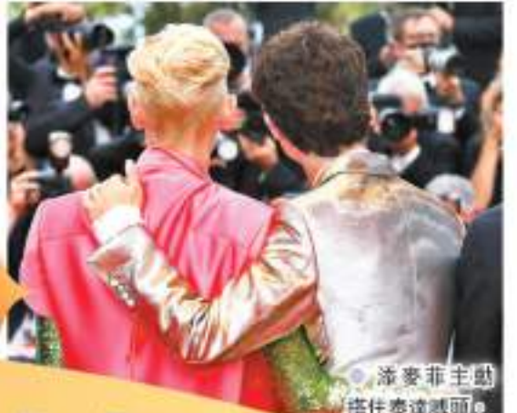
添麥菲主創 擔任泰達導頭。