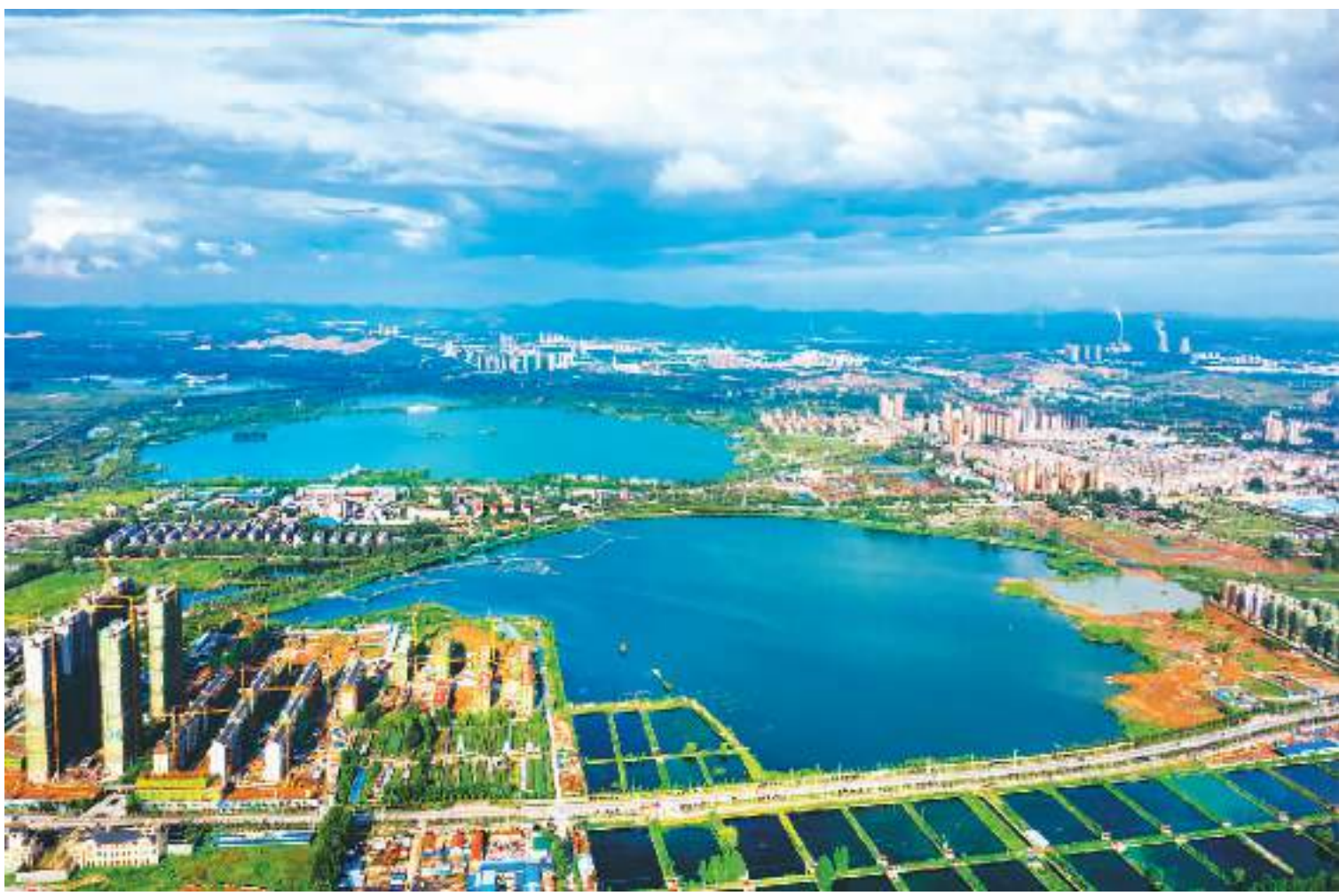
近年来，安徽省淮北市利用采煤塌陷永久性水面，因地制宜实施南湖、绿金湖、碳谷湖、古乐湖、朔西湖等塌陷湖泊治理工程，昔日荒草废