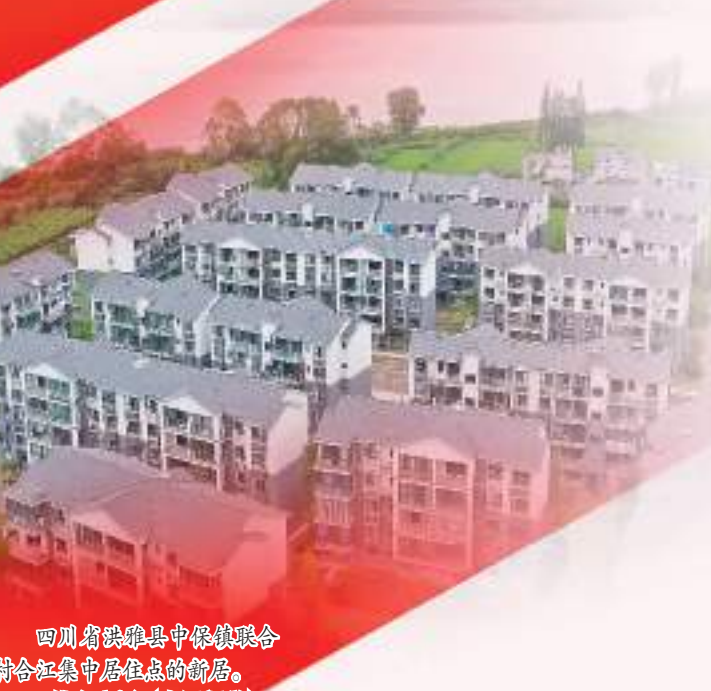
四川省洪雅县中保镇联合村合江集中居住点的新居。