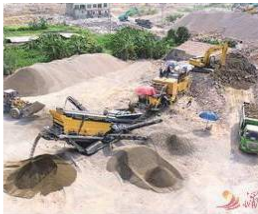
圖為廢料處理設備正在工作。