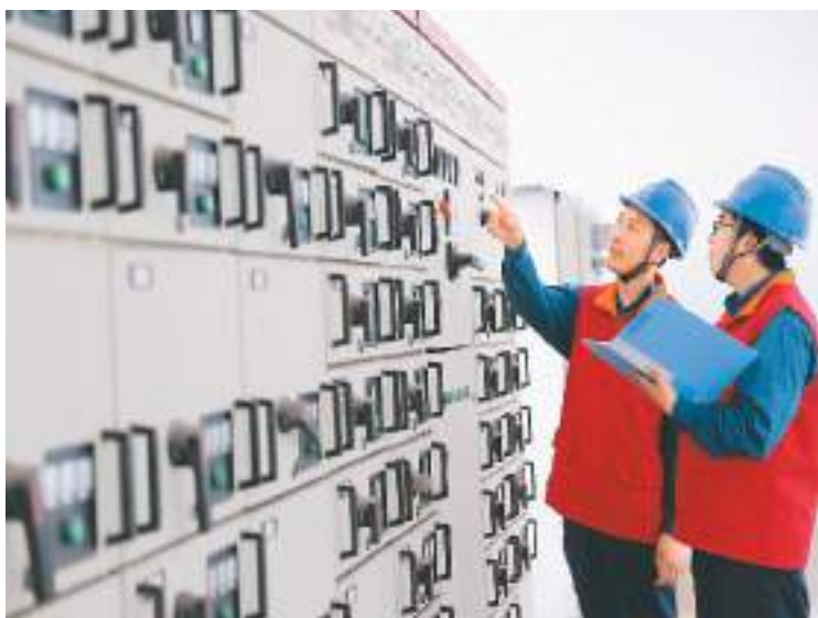
山东东营经济开发区高标准编制电力专项规划，在电网建设、供电可靠性、办电便利度等方面推出扎实举措，促进经济发展。今年上半年，国网东营供电公司完成售电量超150164万千瓦时，同比提高29.21%。图为7月13日，工作人员在落实电力专项规划。

京东集团技术委员会主席周伯文表示，此次云操作系统的发布，正是京东通过扎实的基础设施、领先的数字化供应链、创新的人工智能、云计算、区块链等技术服务能力，以助推其他实体企业高质量发展的最新探索。