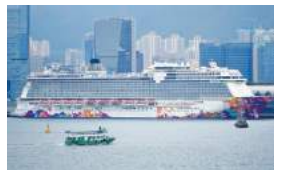
月底將復辦郵輪「公海遊」。

此外，有議員關注D類食肆需要符合每桌三分二顧客打針的要求，惟食物環境衛生署副署長黃淑嫻指，相關巡查問題有難度，並表示當局將會進行「放蛇」行動。另有議員關注電子針卡存在漏洞，能夠借給他人重複使用。黃淑嫻回覆指，過去當局進行多次巡查，惟暫未發現有人借用電子針卡給予他人。