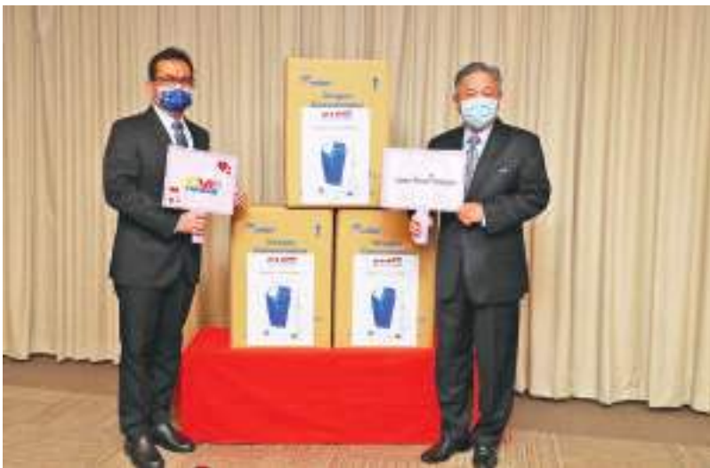
台湾地区涉外部门田政务与章溥帝在制氧机捐赠仪式上