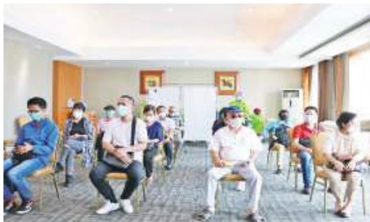
等候疫苗接种的中国内地与港澳台人员

印尼中华总商会秘书长周维梁表示:“这次的疫苗接种是向居住在印尼的中国内地与港澳台的企业家、贸易商和公司员工提供的服务,第一阶段的接种人员使用国药(Sinopharm)