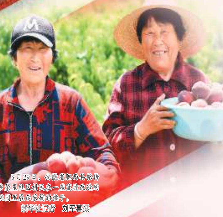
5月29日，安徽省肥西县铭传乡聚星社区村民在一座荒坡改造的桃园里展示采摘的桃子。