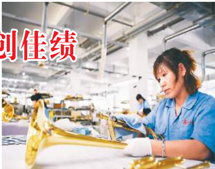
天津市津宝乐器有限公司可生产打击乐器和管乐器成品及零件在内的400余种产品，产品出口全球数十个国家和地区。图为员工在该公司车间组装小号。

拓市场、增订单、降成本、强研发……近年来，民营企业进出口表现突出。数据显示，上半年，中国民营企业进出口8.64万亿元，增长35.1%，占外贸总值的47.8%，