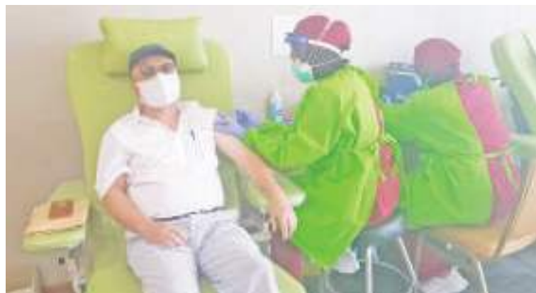
医疗人员为接种者注射疫苗