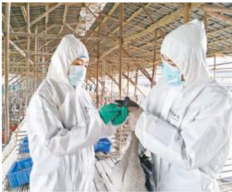
廣州海關所屬佛山海關駐高明辦事處關員在備案活禽養殖基地監測採樣。

凌晨1點，一輛生乳專運車經檢後開進清遠市溫氏魚灣牛奶場，提前等待的廣州海關所屬清遠海關關員迅速對奶罐消毒、擠奶、冷卻環節及儲奶溫度進行追溯檢查，對鮮牛奶的過乳環節實施監管，落實輸奶管、接駁器及奶槽車接駁口的消毒情況，杜絕外部污染。