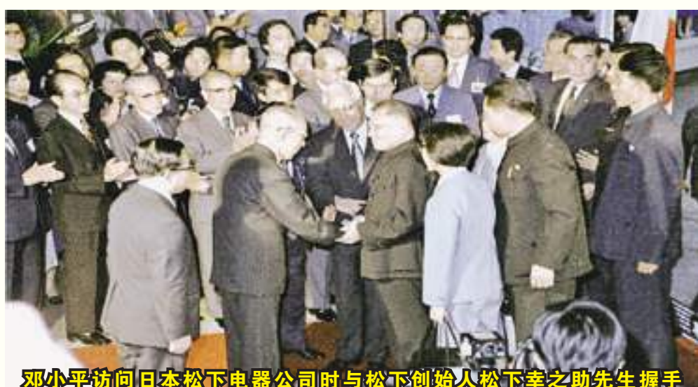
邓小平访问日本松下电器公司时与松下创始人松下幸之助先生握手