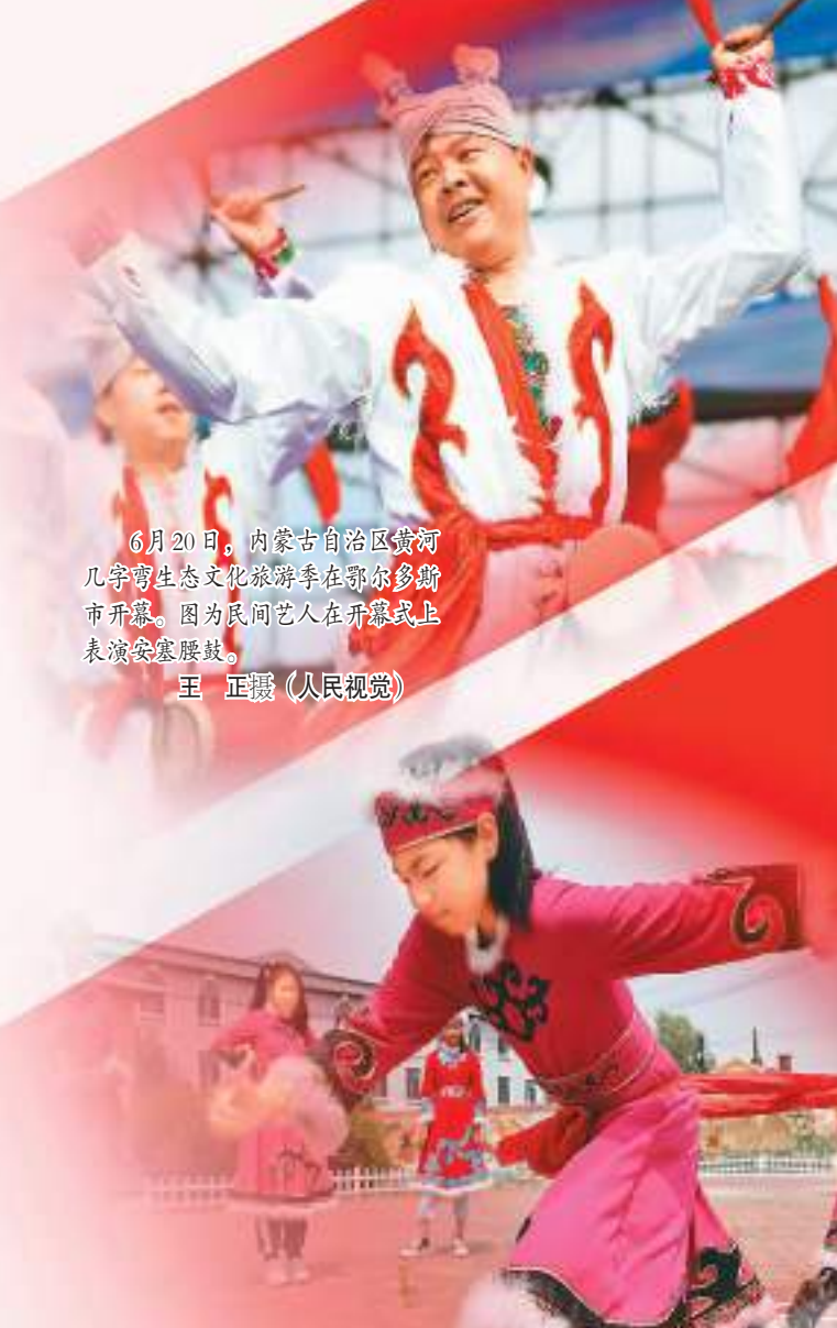
6月20日，内蒙古自治区黄河几字弯生态旅游季在鄂尔多斯市开幕。图为民间艺人在开幕式上表演安塞腰鼓。