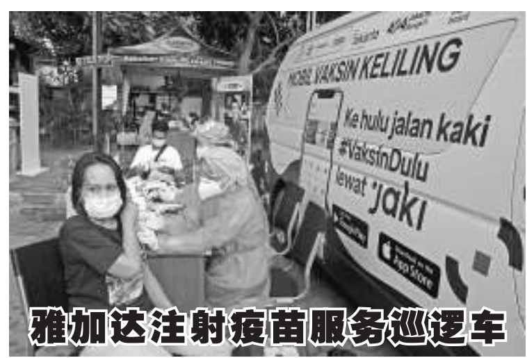
雅加达注射疫苗服务巡逻车 政府预定在下月底,已接种疫苗的雅加达市民应达到750万人,因此当局推出了注射疫苗服务巡逻车,使首都都能尽快形成群体免疫。

善波托说:“我奉劝在重要或关键领域工作的人,最好从早晨6时至上午10时出门或上班,因为根据最近几天的观察,在实施紧急PPKM措施期间,上午10时之后走动的人们,大多是在非重要或非关键领域工作的人。”(Sm)