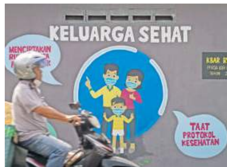
7月14日,一名摩托车驾车者在爪哇省梭罗市恩格普拉克(Ngemplak)一幅以健康家庭为主题的壁画前经过。最近梭罗市新冠病毒病例数量激增。

印尼政府官方数据显示,雅加达有大约1060万人口。研究人员认为,雅加达在3月31日时可能有多达470万人感染新冠病毒。然而,截至7月13日,雅加达官方登记的新冠累计病例却仅有68.9万例。CNN报道称,受到新冠变异病毒德尔塔快速传播的影响,印尼各地的医院,特别是雅加达所在的爪哇岛上的医院已濒临崩溃。