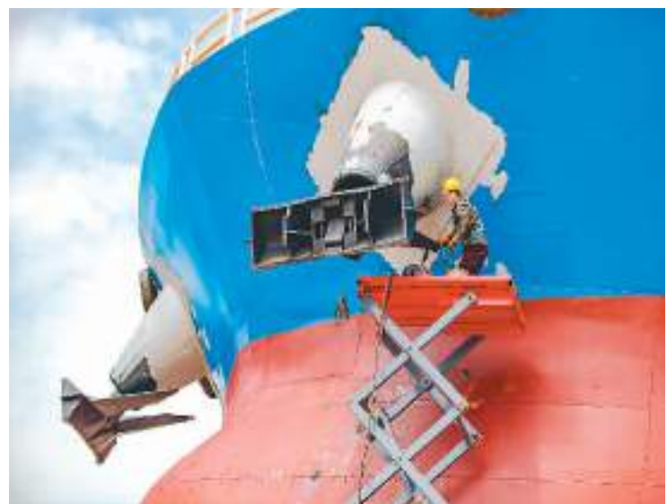
近日，江西省九江市湖口县进入伏天，湖口县企业科学应对酷暑，确保各项目建设进度稳步有序推进。图为工人在湖口县高新技术产业园区内的华东船业造船厂赶工。