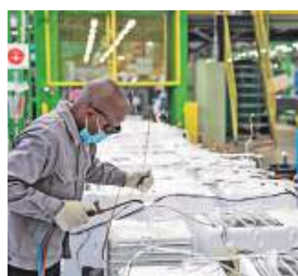
◆2022年6月1日，當地員工在南非開普敦海信南非工業園的冰箱生產線上工作。

王毅強調，中方期待同國際社會一道，共同落實好高層對話會成果，開放各方共同參與的全球發展倡議項目庫，為加速落實2030年可持續發展議程注入強勁動力。