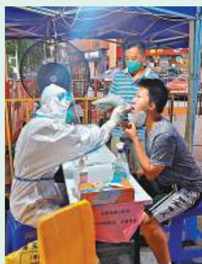
◆福田居民排隊做核酸。

目前，福田區社區小區、城中村自6月25日0時起，暫行3天封閉式管理措施，後續根據疫情防務形勢動態調整。各類卡口24小時值守，嚴格執行體溫必測、口罩必戴、查驗24小時核酸陰性證明或24小時內核酸採樣紀錄，居民進出須在「電子哨兵」打卡登記或掃「場所碼」。全面實行「居民白名單」管理，非本小區、城中村居民謝絕進入。