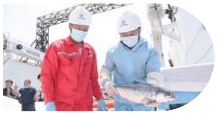
【中國首批深遠海大西洋鮭在青島上岸。】

日前，在中國黃海離岸120多海裏的青島國家深遠海綠色養殖試驗區，全球第一座全潛式深海漁業養殖裝備“深藍1號”成功收穫中國首批深遠海大西洋鮭。這是全球首次低緯度養殖大西洋鮭獲得豐收，也標志着青島“海上糧