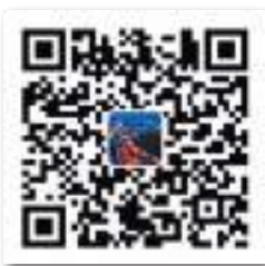
青島發佈 官方微信二維碼