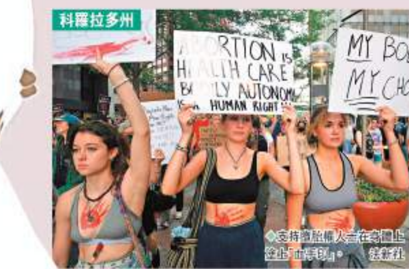
支持墮胎權人士在街頭示威。