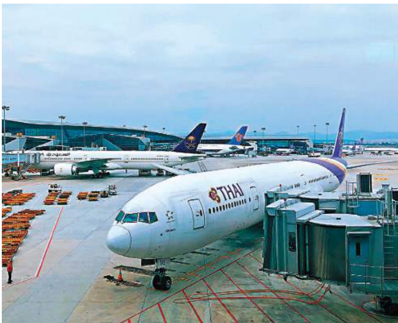
◆擬建的大灣區運管委協同運行共享平台將提升機場群整體航班運行保障能力。圖為廣州白雲機場。

據了解，粵港澳大灣區集聚香港、廣州、深圳、珠海、澳門5大機場，航空客、貨運輸需求旺盛，但空域資源緊張，又受雷雨、颶風等惡劣天氣影響明顯。「先期成立珠三角運管委，將廣州、深圳、珠海3個機場運管委協同運行作為粵港澳大灣區協同運行的前期試點工作來推進。」中南空管局負責人表示，將採用先易後難、由近及遠的建設原則，後期將共享機場群落逐步推廣至港澳機場，並擬構建「粵港澳大灣區運管委協同運行共享平台」和做好空管ATFM（空中交通流量管理）、航空公司SOC（運行控制系統）、機場ACDM（機場協同決策）三方信息的融合共享，實現更深層次的協同管理，提升灣區機場群運行資源的有效利用與整體航班運行保障能力，助力粵港澳大灣區發展。