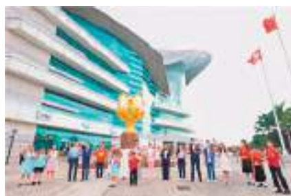
◆團體舉辦快閃活動，慶祝香港回歸祖國25周年。