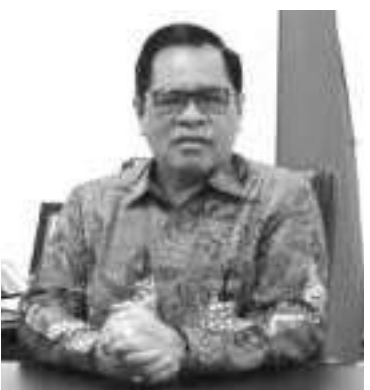
我国驻中国与蒙古大使周浩黎。

萨克迪部长总结道,海事渔业部在确保这一出口增长目标之际,仍然优先考虑国内需求。此外,捕捞和水产养殖渔业系统的管理是根据蓝色经济的原则,优先考虑生态系统的可持续性。确保可持续渔业,并支持产品出口渔业海洋保护区实施,以捕捞配额为基础的捕捞政策。特别地区和配额将分配给地方和传统渔民。这将使民众成为渔业和海洋经济的主要受益者之一。(亮剑)