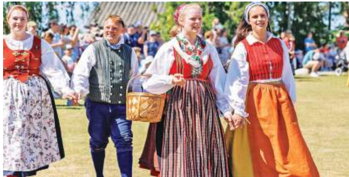
瑞典·庆祝仲夏节 6月25日，在瑞典首都斯德哥尔摩的斯塔森公园，人们身着传统服装参加庆祝仲夏节的传统活动。

他感叹道：“这些年的拜访让我亲眼见证了中国的快速发展变化。尽管中国一直在发展变化中，但在日常感受中，有两样东西没有变化，那就是中国人民的善良和中国食物的美味。”