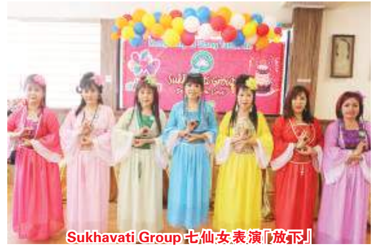
Sukhavati Group 七仙女表演《放下》