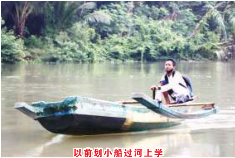
以前划小船过河上学