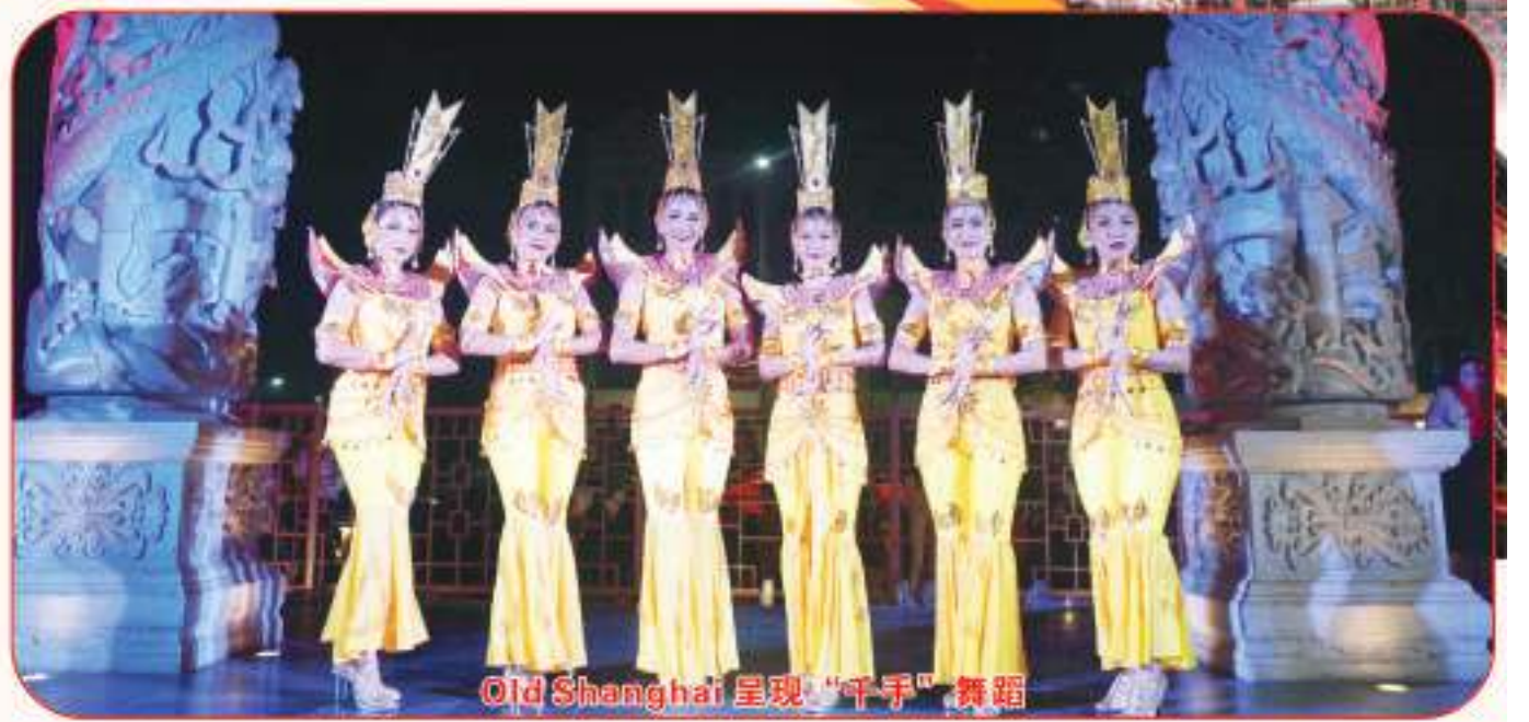
Old Shanghai 呈现“千手”舞蹈

此外，除了观赏动人的舞蹈外，在上海广场内多处的景点可供拍照留念，如龙巷区、宝塔池、凉亭、广场等。老上海的各种艺术壁画、图腾，描绘了中国大城市的