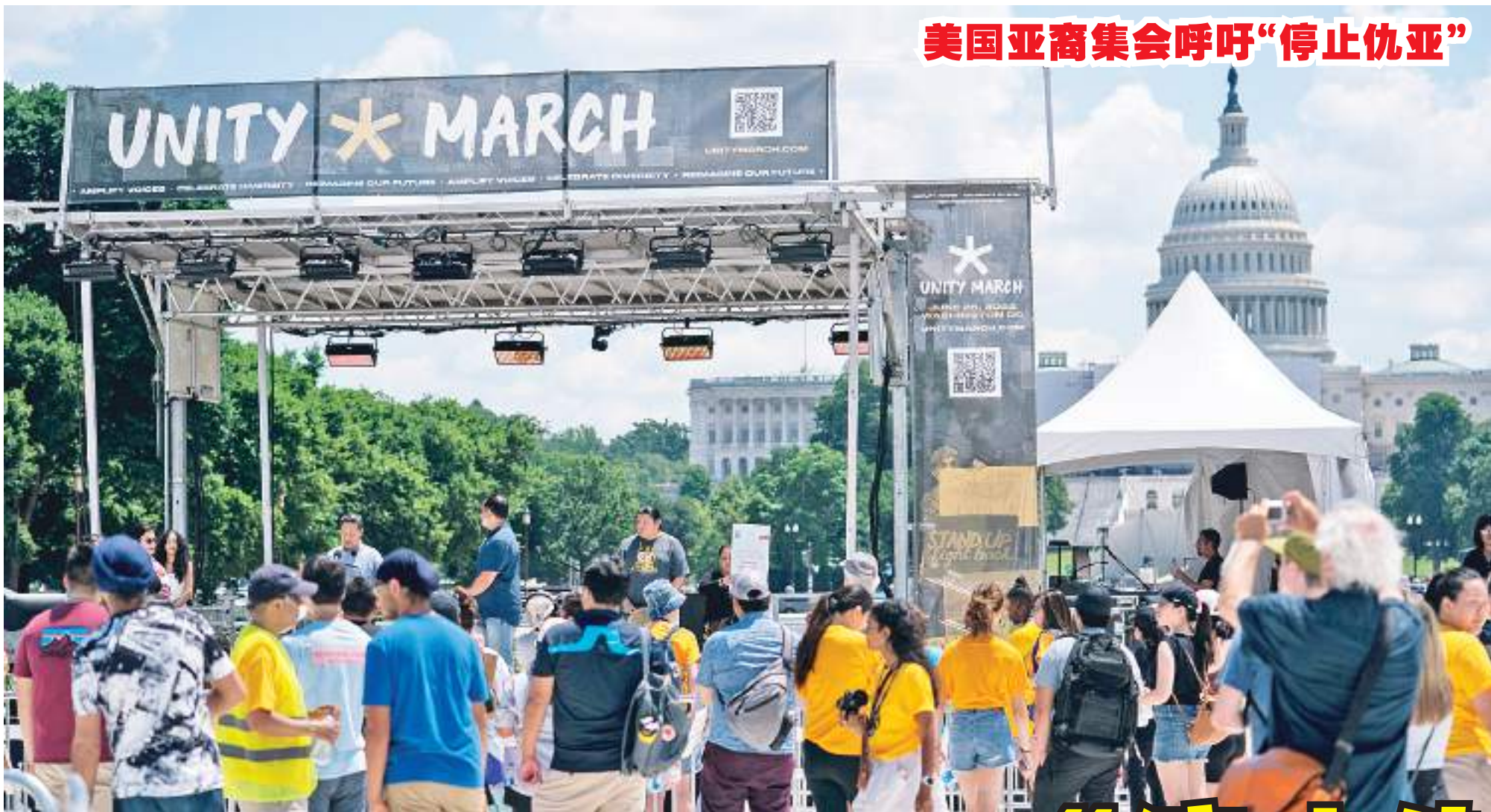
美国亚裔集会呼吁“停止仇亚”

6月25日，在美国首都华盛顿，示威者参加反亚裔仇恨集会。美国亚裔人士25日午后在首都华盛顿国家广场举行集会，呼吁停止针对亚裔的仇恨及暴力犯罪行为。