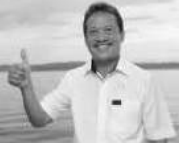
海事渔业部长瓦赫尤·萨克迪(Wahyu Sakti Trenggono)。

【本报讯】海洋渔业部致力于促进对中国的渔业产品出口,以支持加速国民经济增长。通过加强双