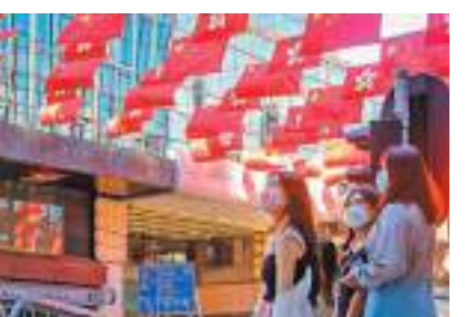
◆逾百面國旗及區旗掛滿街頭，市民抬眼便可見一片鮮艷「旗海」。

香港文匯報訊（記者 吳俊宏）連日來，在灣仔金紫荊廣場、尖沙咀星光大道等香港著名地標上，飄揚着《獅子山下》、《東方之珠》、《前》、《我和我的祖國》等一首首港人耳熟能詳的金曲。香港社會各界人士通過「快閃」唱歌，熱烈慶祝香港回歸祖國25周年，祝福香港明天更美好。「快閃」視像在網上熱傳，並在中央電視台播出。