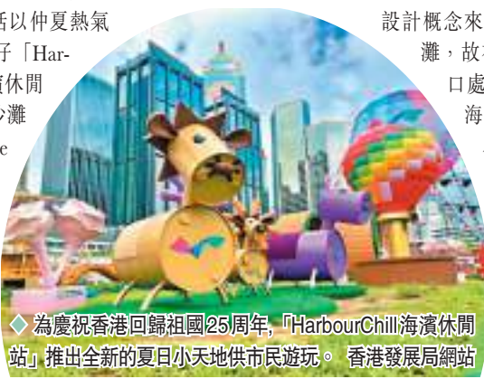
◆為慶祝香港回歸祖國25周年，「HarbourChill海濱休閒站」推出全新的夏日小天地供市民遊玩。香港發展局網站