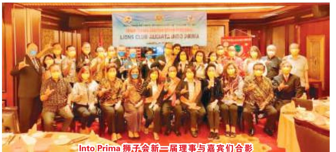
Indo Prima 狮子会新三届理事与嘉宾们合影