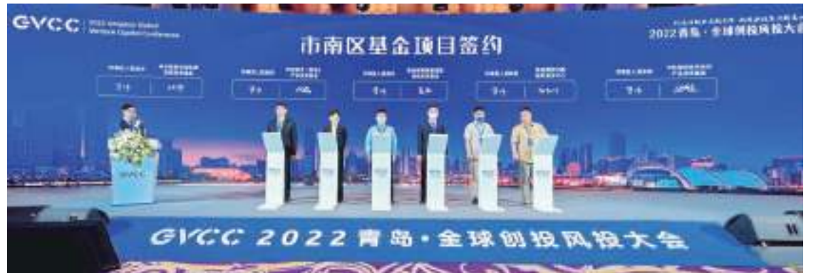
【大會上，市南區舉行基金項目簽約儀式。】