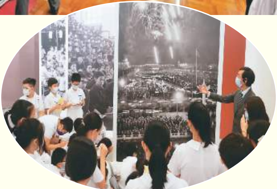
右图：香港小学生在参观《国家相册》大型图片典藏展。