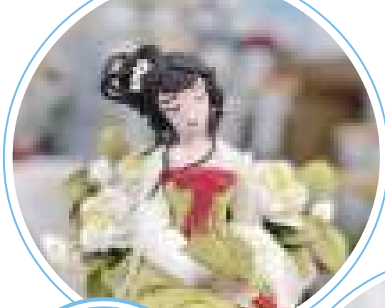
【手造節上的衍紙鈎編作品。】

手造，是繁華巷口間的一抹寧靜，是城市烟火中的一方情懷。近日，青島市首屆手造節在魯邦風情街啓動。