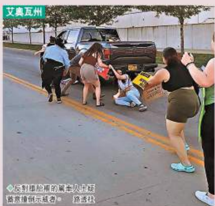
反對墮胎權的保守人士在艾奧瓦州示威。

美國最高法院24日正式推翻1973年「羅訴韋德案」的裁決，廢除對女性墮胎權的憲法保障。有保守派大法官更在意見書中明確指出，日後裁決或還會針對墮胎內避孕和同性婚姻等議題。隨着今次裁決在全美掀起一片抗議浪潮，法律界普遍憂慮立場愈趨保守的最高法院，未來恐會繼續逆民意而行，令美國人權大幅倒退。