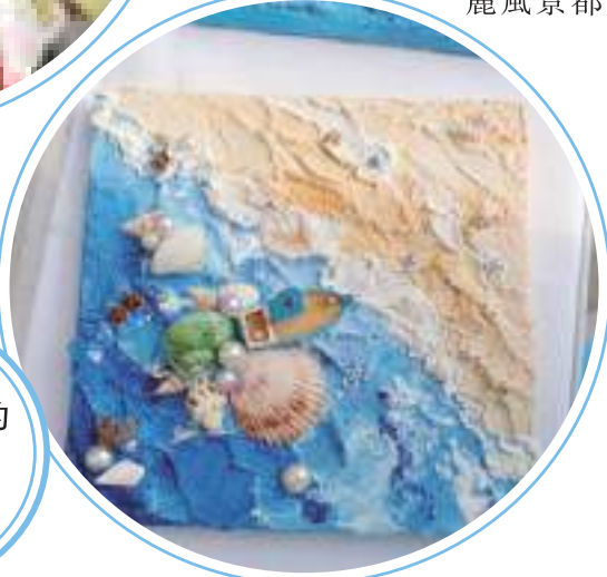
【手造節上的貝殼畫。】