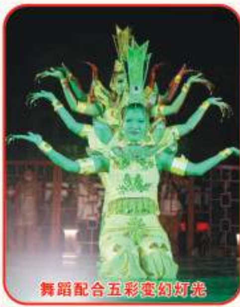
舞蹈配合五彩变幻灯光