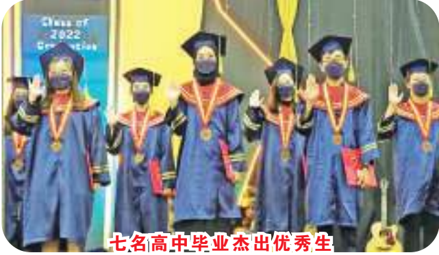
七名高中毕业杰出优秀生

2020年度的毕业典礼在一片热烈掌声中开始，在一片笑语欢声中结束。愿雅加达南洋国际学校——孩子们的母校，在不断充实和壮大的征途上，永远带着我们的祝福。