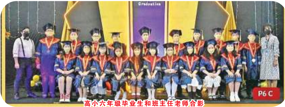
高小六年级毕业生和班主任老师合影