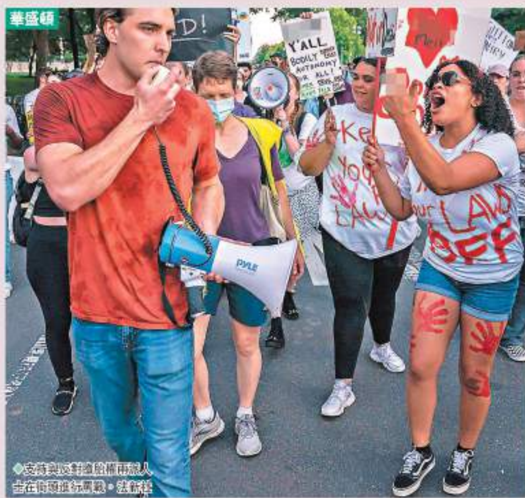
支持與反對墮胎權兩派人等在街頭進行示威。

在推翻「羅訴韋德案」的裁決中，最高法院立場最保守的大法官托馬斯於意見書中明言，「在未來的案件中，我們應該重新考慮本法院所有實質性正當程序先例，包括格羅斯沃爾德案、勞倫斯案和奧貝格費爾案。任何實質性正當程序決定都是明顯錯誤的……我們有責任糾正這些先例定下的錯誤。」