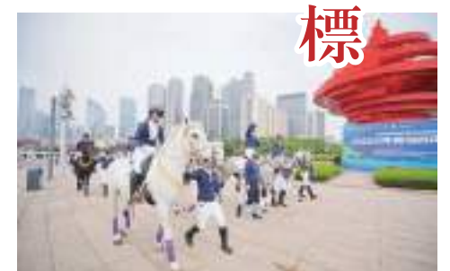
【體育展演上的馬術秀】

近日，2022年青島時尚體育大展演在青島地標——五四廣場“五月的風”雕塑前拉開帷幕。馬術、武術、街舞、花式跳繩、健美操等10大項目輪番登場，吸引眾多市民和遊客駐足觀看並參與。