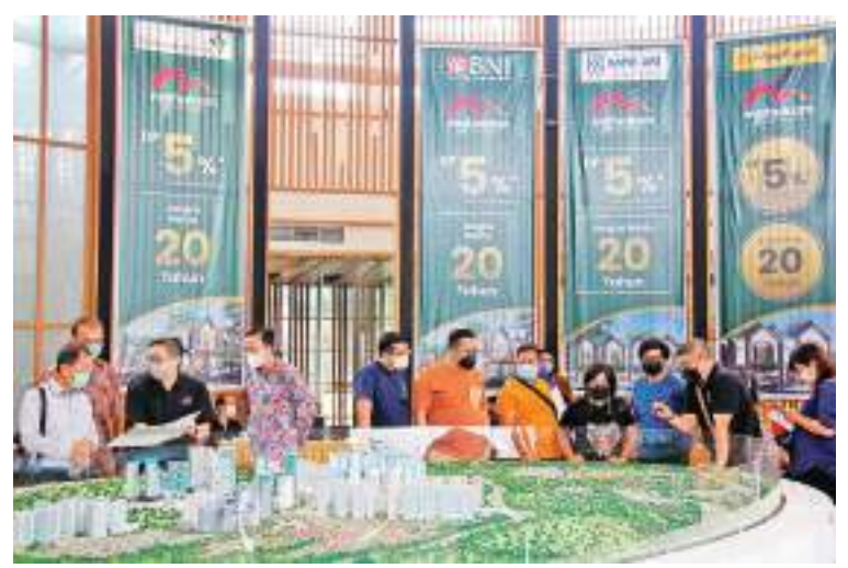
Marketing Gallery 的氛围

示, Mahakam The Signature Cluster 拥有众多优势,我们的产品受到准客户的热烈欢迎;首次销售,只剩下几个单位。我们相信在 2022 年底之前, Mahakam The Signature Cluster 中的所有住房单元都将售罄。雅加达的房屋需求量仍然非常高,尤其是在雅加达花园城市,情况还在持续快速增长;新冠肺炎大流行之后,我们将始终创新以满足房屋的需求,在住进房屋区域之前,优先考虑对开放空间和卫生区域的需求。Mahakam Cluster The Signature 位于雅加达花园城市,一个占地 370 公顷的独立乡镇,并继续快速发展,拥有各种商业和生活设施,让居民不必离开该地区就可以满足各种日