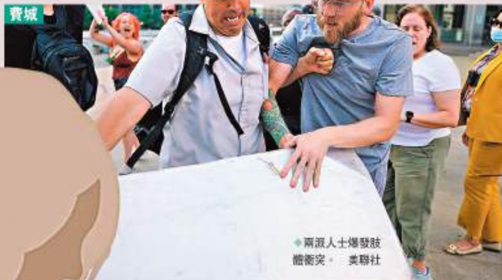
兩派人士爆發肢體衝突。

當全球多數國家陸續以立法方式保障墮胎權利時，美國的墮胎權利卻遲遲未寫入法律，反而讓墮胎與反墮胎之爭，一次次被當作兩黨紛爭的政治籌碼。