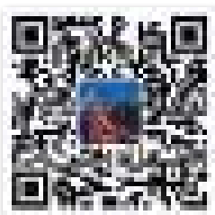
青島發佈 官方微博二維碼