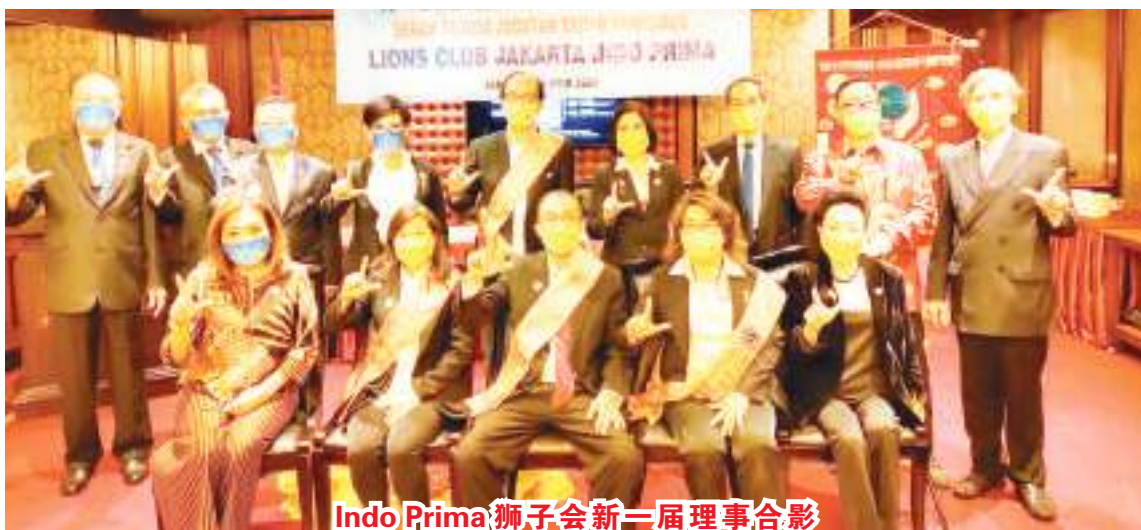
Indo Prima 狮子会新三届理事合影