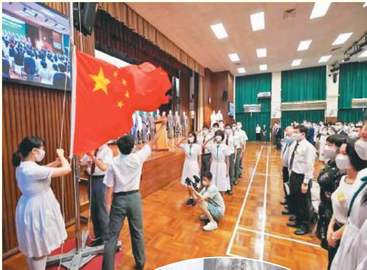
上图：香港培侨中学日前举行毕业典礼。图为典礼上的升旗仪式。（资料图片）