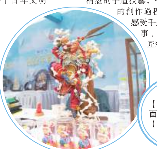
【手造節上的面塑。】

近日，2022年青島時尚體育大展演在青島地標——五四廣場“五月的風”雕塑前拉開帷幕。馬術、武術、街舞、花式跳繩、健美操等10大項目輪番登場，吸引眾多市民和遊客駐足觀看並參與。