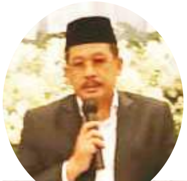
宗教部副部长致词