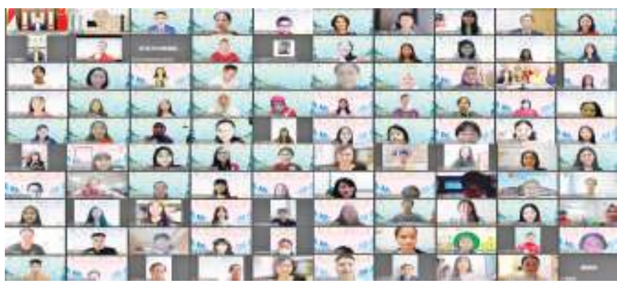
部分选手及嘉宾合影