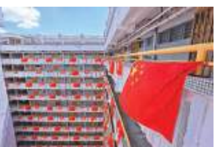
◆香港屋邨掛滿國旗和特區區旗，吸引了不少市民前來打卡。