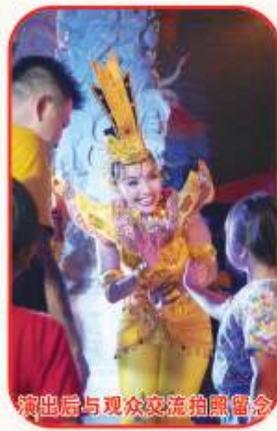
演出后与观众交流拍照留念