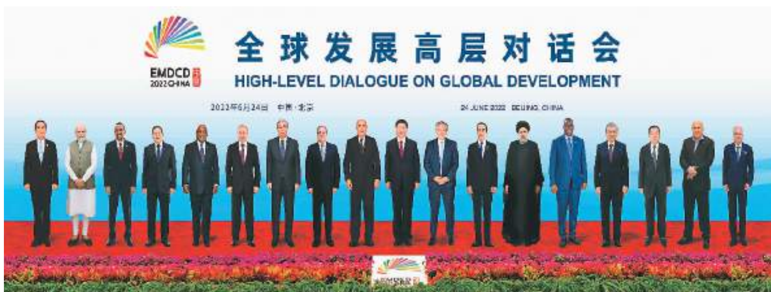
6月24日晚, 国家主席习近平在北京以视频方式主持全球发展高层对话会并发表题为《构建高质量伙伴关系 共创全球发展新时代》的重要讲话。