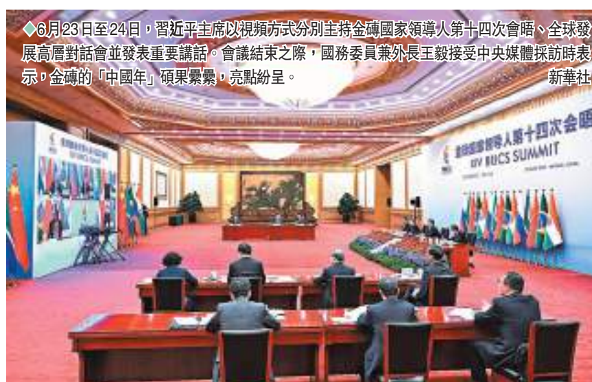
◆6月23日至24日，習近平主席以視頻方式分別主持金磚國家領導人第十四次會晤、全球發展高層對話會並發表重要講話。會議結束之際，國務委員兼外長王毅接受中央媒體採訪時表示，金磚的「中國年」碩果累累，亮點紛呈。

香港文匯報訊 據新華社報道，6月23日至24日，中國國家主席習近平以視頻方式分別主持金磚國家領導人第十四次會晤、全球發展高層對話會並發表重要講話。6月22日，習近平主席還在金磚國家工商論壇開幕式發表主旨演講。會議結束之際，國務委員兼外長王毅接受中央媒體採訪。王毅說，在習近平主席擘畫引領下，金磚的「中國年」碩果累累，亮點紛呈。中方全年將主辦170多場各領域金磚活動，上半年僅部長級會議就舉行了20多場，各場「金磚+」活動吸引了50多個非金磚國家參與，金磚影響力不斷擴大。