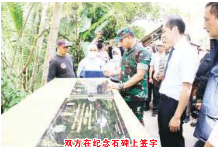
双方在纪念碑上签字