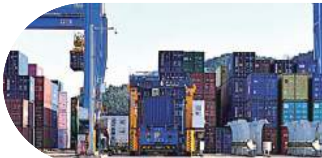
【上合示範區首班大豆回程專列抵達。】