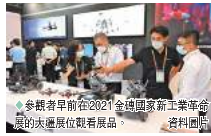
◆參觀者早前在2021金磚國家新工業革命展的未來展區觀看展品。