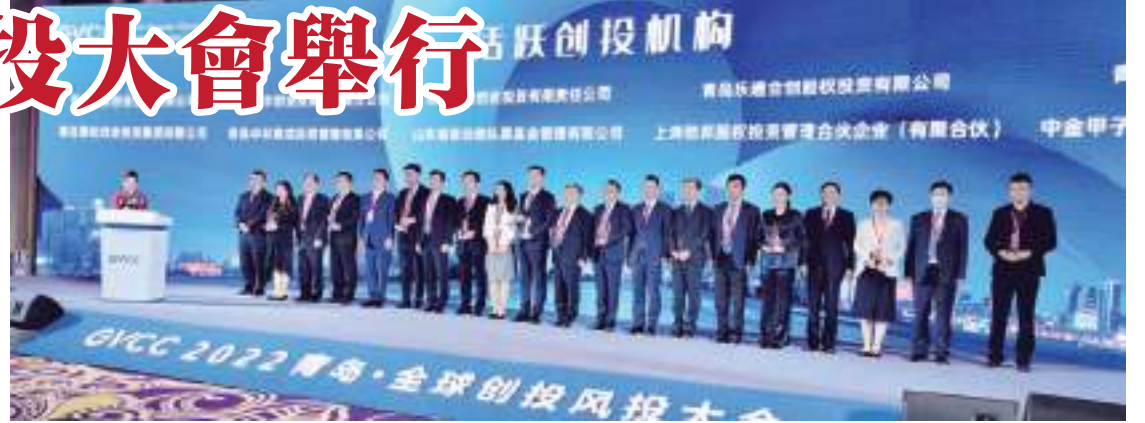
【會議表彰了2022青島十佳活躍創投機構。】