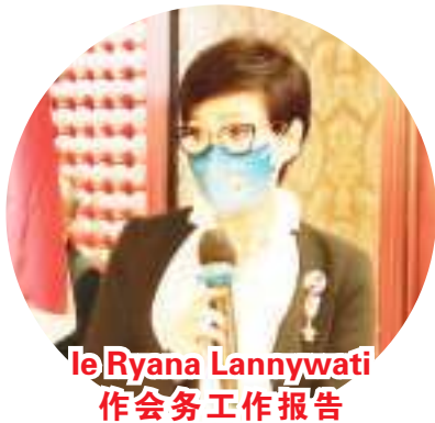
Le Ryana Lannywati 作会务工作报告