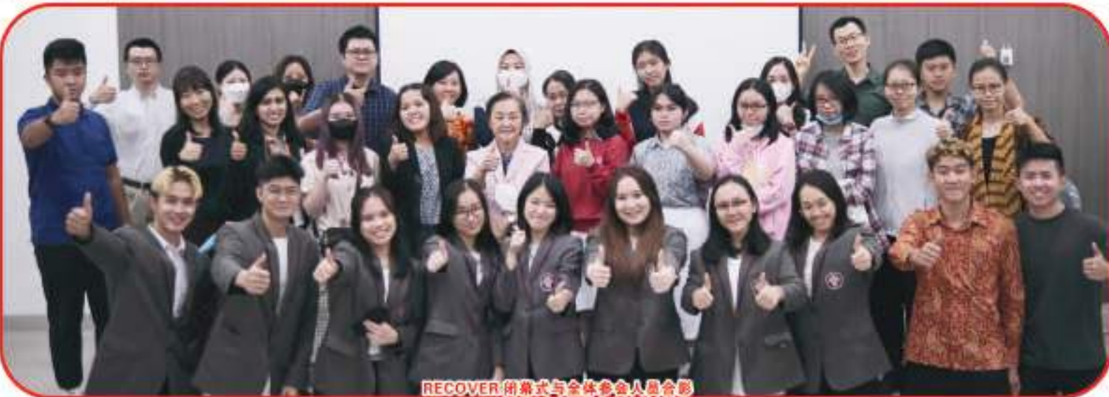
RECOVER 闭幕式与全体参会人员合影