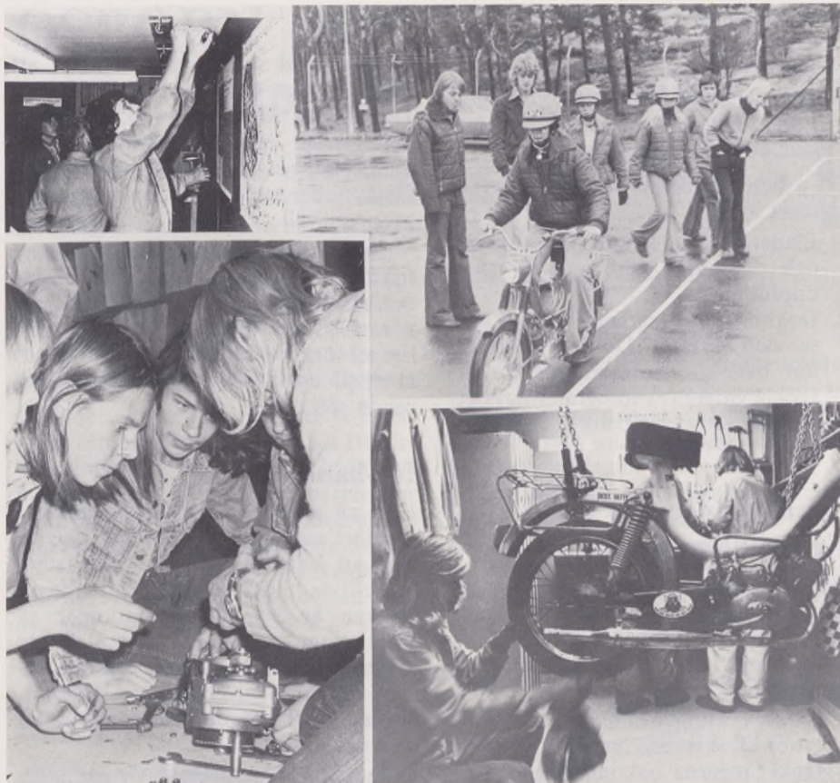
I "Motor och trafik" ingick bl. a. inredning av verkstad, mopedmekning, verktygshantering och praktiska tillämpningsövningar.

Vårt pedagogiska utvecklingsarbete tar fasta på följande punkter.