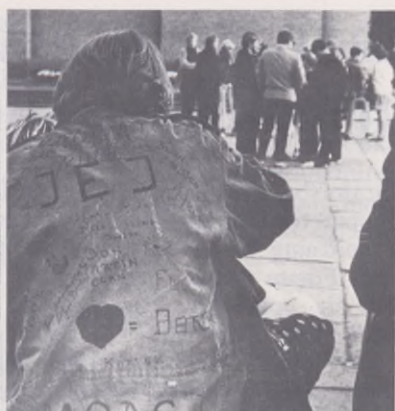
Under "mods-perioden" i mitten av 1960-talet, då Götaplatsen blev populär och ibland orolig samlingsplats, fick den uppsökande verksamheten i innerstaden ökade resurser.

troende och delat ansvar mellan ungdomar och de ledare som anställdes till dessa verksamheter.