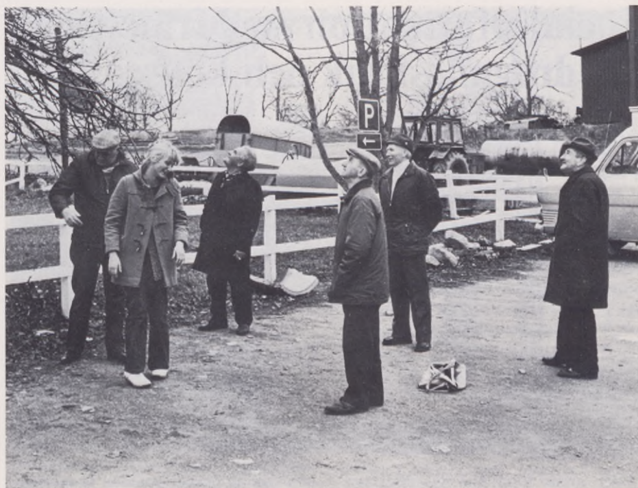
I ungdomsklubbarna finns i regel alltid både manliga och kvinnliga ledare, och även Klubb Osborn har kvinnlig fritidsledare.

dant som studiebesök, turneringar, hobbyverksamhet, m m, där vi i så hög grad som möjligt söker utgå från intressen och önskemål hos medlemmarna själva. Dessa aktiviteter ställer ofta litet högre krav på deltagarna och det blir oftast frågan om mindre grupper och ibland enskilda.