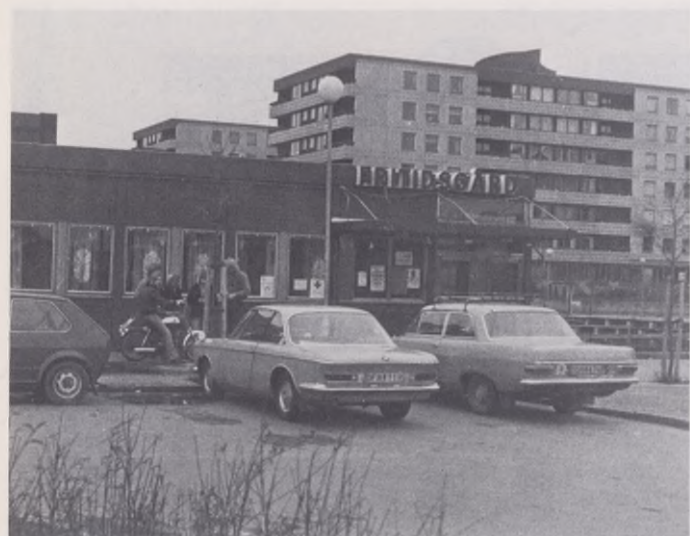
Under fältassistentens "kvällsronder" i distriktet besöks också fritidsgårdarna för samtal med personal och ungdomar.

Jag kör en av ledarna hem, och vi blir sittande länge i bilen. Det är svårt att varva ned efter en arbetskväll. Man behöver en stunds eftersnack.