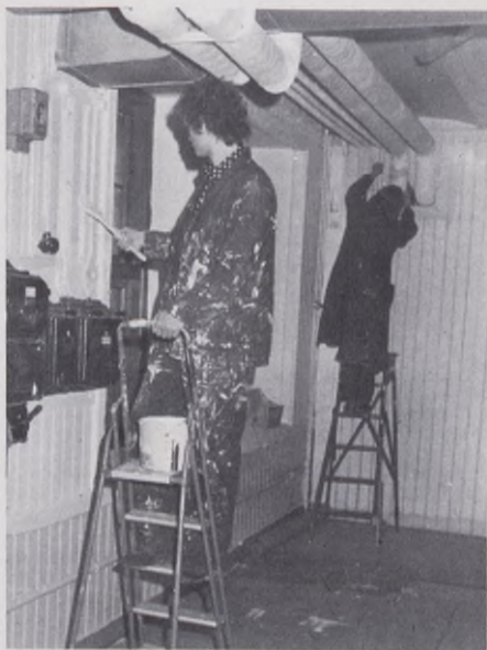
Källarmålning lämpligt nybörjarjobb

Men just att få lära känna ungdomar idag, som lever helt annorlunda än jag själv gör, och har gjort, betyder väldigt mycket för mig i arbetet. Det har varit mycket givande och stimulerande att få vara deras förtrogna under några års tid. Jag ser fram emot att få vara det i framtiden också, och följa deras utveckling.