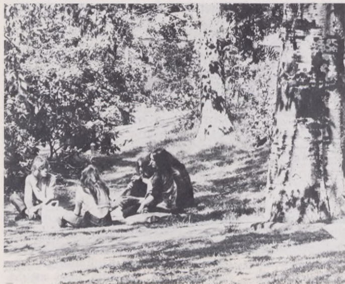
"Kamratgruppen lever ett eget liv, avskilt från vuxenlivet".

För många av dem, som inte klarar av att leva upp till dessa krav och förväntningar och där otryggheten och bristen på känslorrelationer är en realitet, förefaller flykten vara enda möjligheten. Detta tar sig ofta uttryck i missbruk. Knark, mellanöl, thinner etc blir en ersättning för bristen på känslomässigt utbyte och avsaknaden av plattform för steget ut i vuxenvärlden.