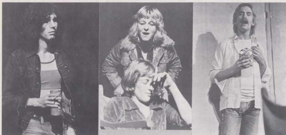
Speedy Gonzales är en pjäs om sociala ungdomsproblem liksom flera andra av Nationalteaterns pjäser.

Bland tonåringar som på många sätt är i riskzonen finns det också ofta goda kunskaper om risker och farlighet med droger, liksom vilka preventivmedel som finns och riskerna att flickan kan bli gravid om man är oförsiktig. Kunskapspridningen har varit förhållandevis effektiv, men den har inte avgörande påverkat ungdomarnas attityder och beteende. Det är alltså viktigt att man kan erbjuda mer än in-