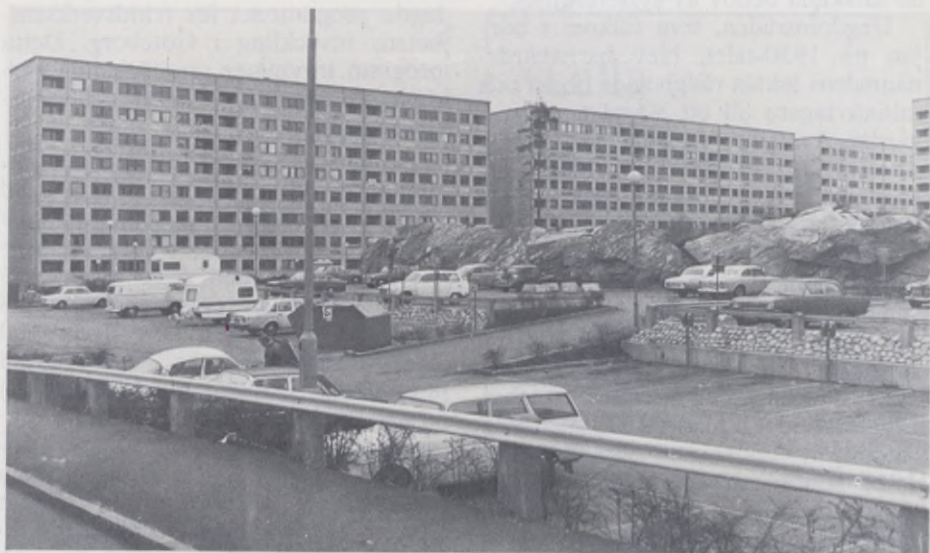
Många ungdomar trivs inte i den nya förorten, och vantrivseln kan taga sig oroväckande uttryck.

Efterkrigstiden har karakteriserats av en kraftig urbanisering som framtvingat en accelererande bostadsproduktion, kanske mest märkbar i de större stä-