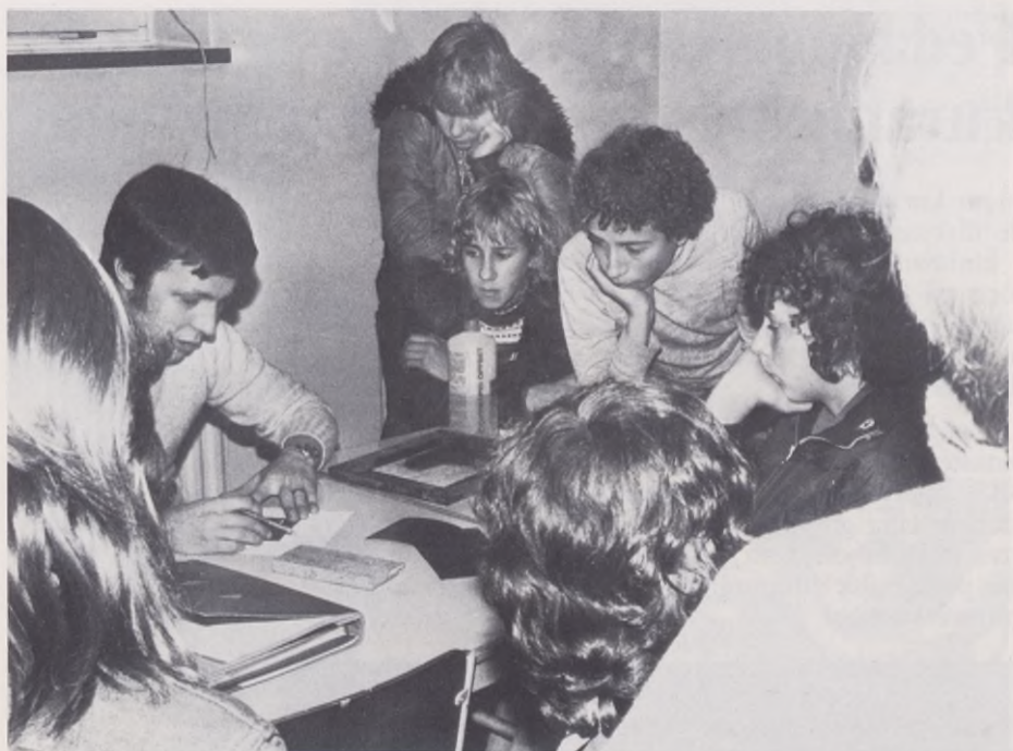
Allt emellanåt kommer en "gäst" till klubben för att t. ex. lära ut en ny hobby.

heter att leva upp till intentionerna på grund av bristande resurser, vilket inneburit att många ungdomar ställts utanför ordinarie fritidsverksamhet.