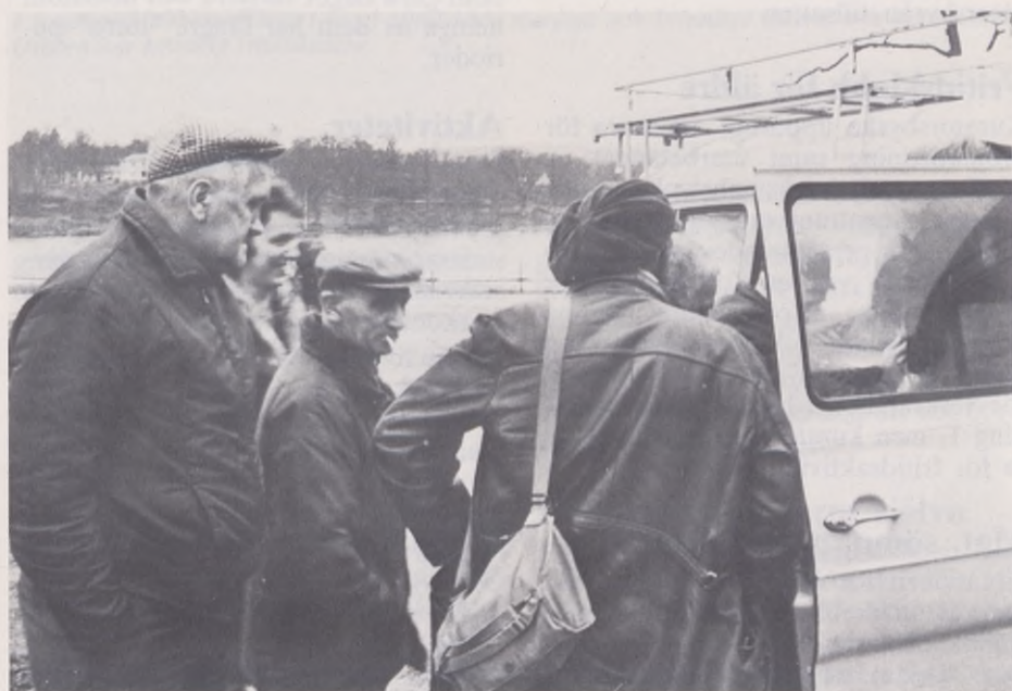
Fritidsledarna och deltagarna i verksamheten planerar tillsammans bl. a. utflykter och studiebesök.

De alkoholiserade har genom upprepade misslyckanden och en nedvärderande förmyndarattityd från omgivningens sida ofta förlorat sin självkänsla och identitet. Det är viktigt att ge dem tillfälle att återfå något av denna; ett sätt är att genom att de deltar i olika aktiviteter så småningom ser att de klarar av att göra sådant som "vanliga" människor gör. De får uppleva att människor omkring dem ser