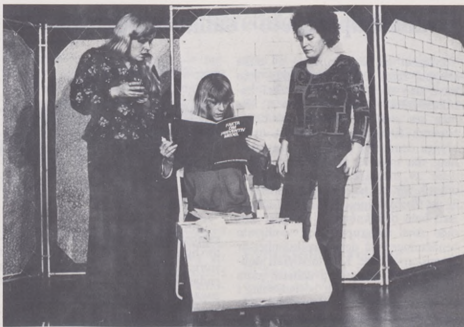
De tre skådespelerskor, som utgjorde hela ensemblen i Narren-pjäsen, roade och oroade ungdomarna genom att påvisa hur fast vi sitter i våra könsroller.

formation, nämligen personliga kontakter, aktiviteter och gemenskap i olika former.