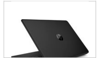
Left rear facing

54 x 41 (jpg) 54 x 41 (png) 100 x 70 (jpg) 96 x 72 (jpg) 96 x 72 (png) 99 x 74 (png) 153 x 115 (png) 180 x 135 (png) 240 x 180 (jpg) 240 x 180 (png) 247 x 185 (png) 170 x 190 (jpg) 257 x 193 (png) 320 x 240 (jpg) 320 x 240 (png) 474 x 356 (png) 513 x 385 (png) 400 x 400 (jpg) 400 x 400 (png) 573 x 430 (png) 800 x 600 (png) 1659 x 1246 (png) 2950 x 1827 (png) 2948 x 1928 (jpg)