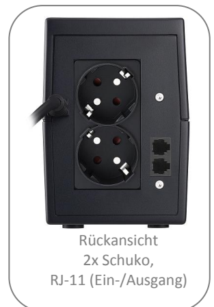
Rückansicht 2x Schuko, RJ-11 (Ein-/Ausgang)