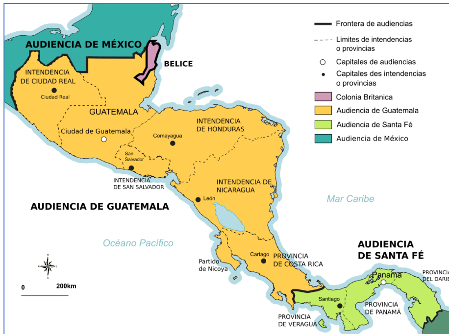
Figura 1 Fronteras coloniales (1785-1821)