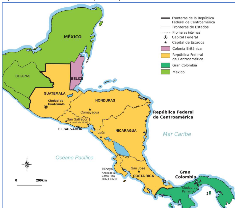
Figura 2 República Federal de Centroamérica (1823-1838)