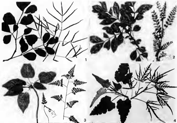
Pl. 2. — 1, Vitis mappia ; 2, Doratoxylon apetalum ; 3, Dombeya populnea ; 4, Ruizia variabilis . (Chaque espèce est représentée par un rameau adulte à gauche et juvénile à droite).