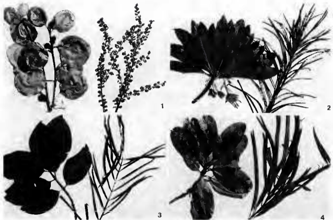
Pl. 1. — 1, Scolopia heterophylla ; 2, Mathurina penduliflora ; 3, Scyphochlamys revoluta ; 4, Sideroxylon galeatus . (Chaque espèce est représentée par un rameau adulte à gauche et juvénile à droite).