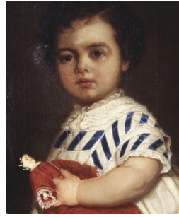
Elma von Hallwyl, målad av Arvid Gottfrid Virgin år 1872.