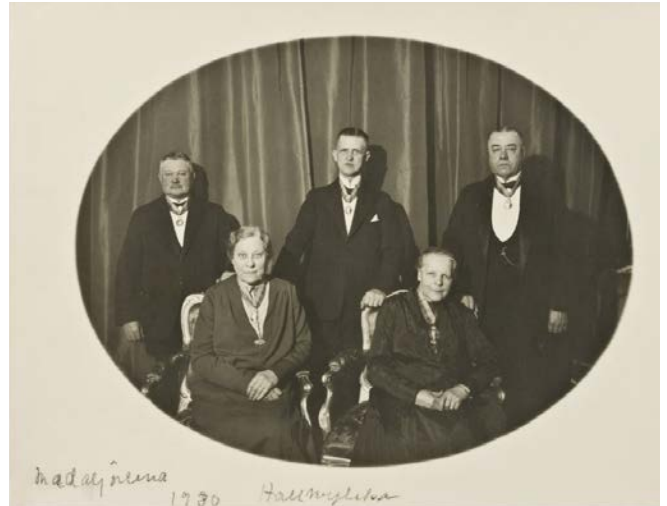
Tjänstefolket på Hamngatan 4 år 1930