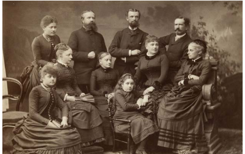
Familjen von Hallwyl med släktingar på 1880-talet.