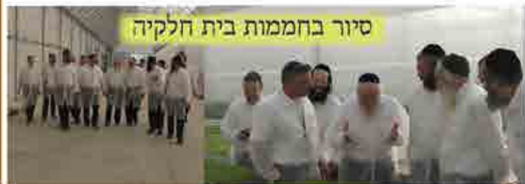
סיור בחממות בית חלקיה