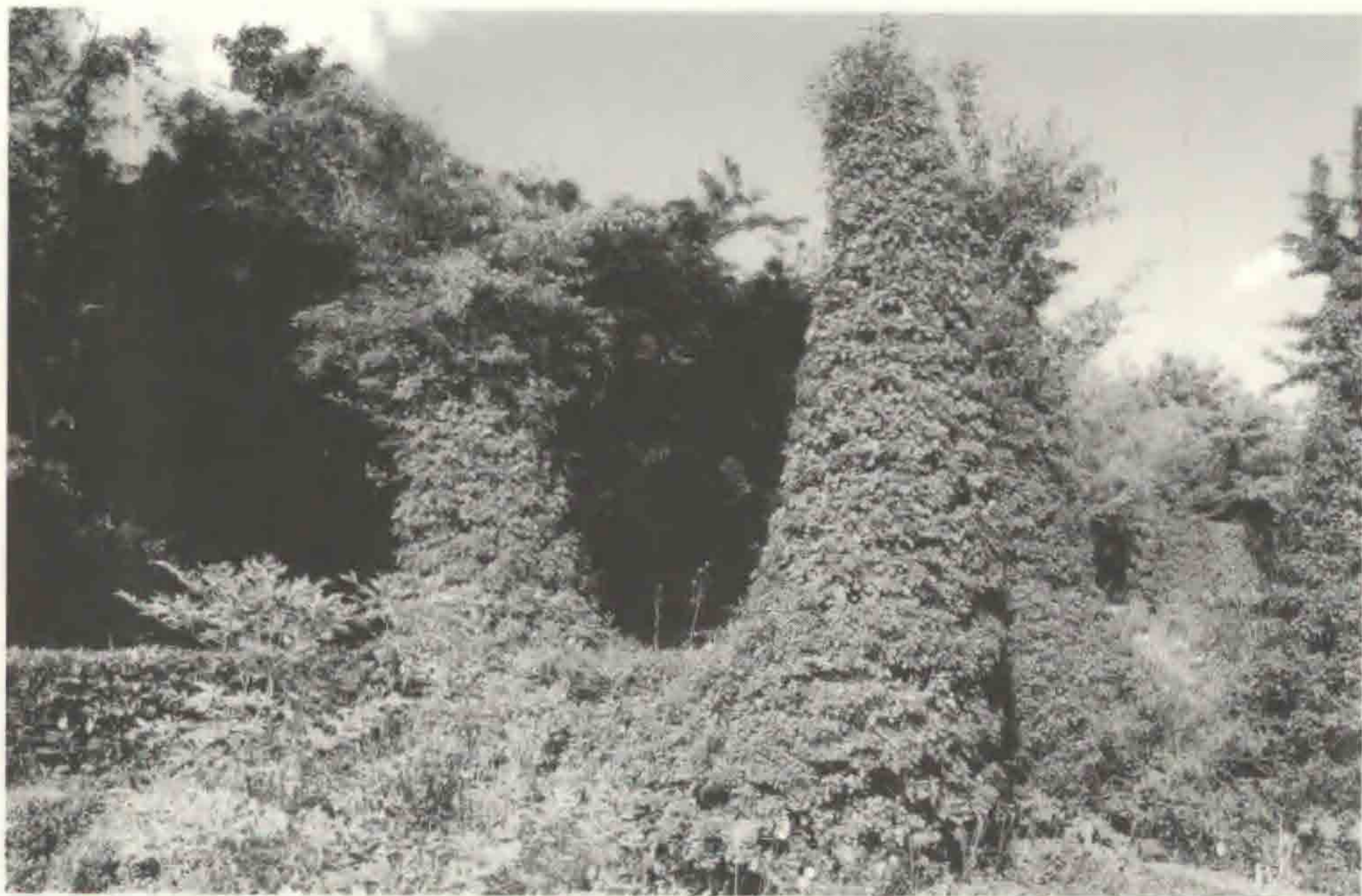
En af Sven-Ingvard Anderssons "høns". En formklippede hvidtjørn. Marnas.