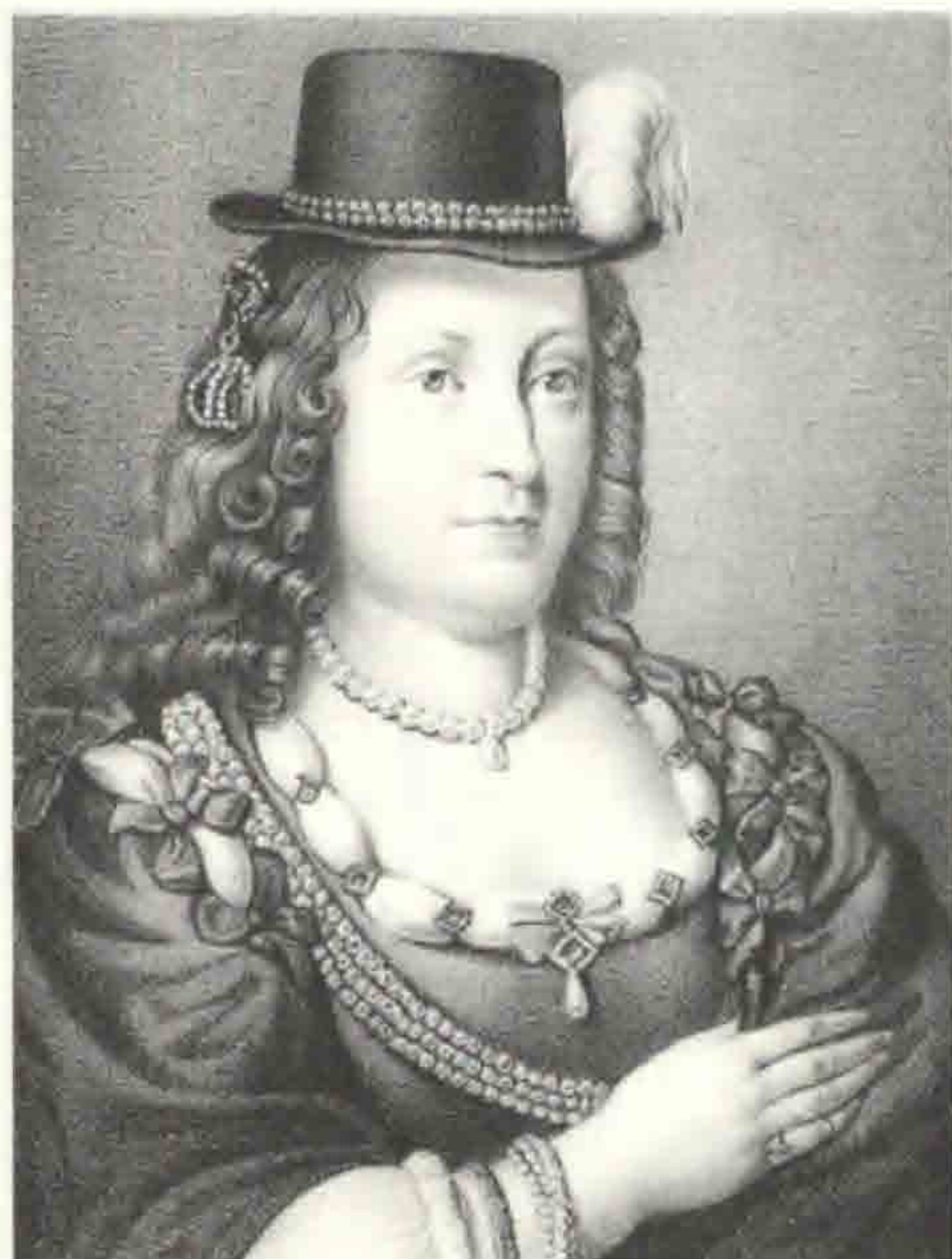
Leonora Christina Ulfeldt fra J P Traps: Berømte danske mænd og kvinder. 1867

Under en diskussion/samtale med Corfits Ulfeldt om Italien fortæller Otto Sperling om herremanden Nicolo Contarini og om sit arbejde i hans have. Corfits Ulfeldt ønskede at gøre hans bekendskab og skrev derfor et brev til ham. Otto Sperling vedlægger et brev til Nicolo Contarini, hvor han i rosende vendinger omtaler Corfits Ulfeldt. Nogen tid efter modtager Otto Sperling et brev fra Nicolo Contarini, hvor han gør Otto Sperling opmærksom på at ifølge italiensk lov er det ham forbudt at kommunikere med fremmede ministre, så Corfits Ulfeldt hørte aldrig direkte fra Nicolo Contarini.