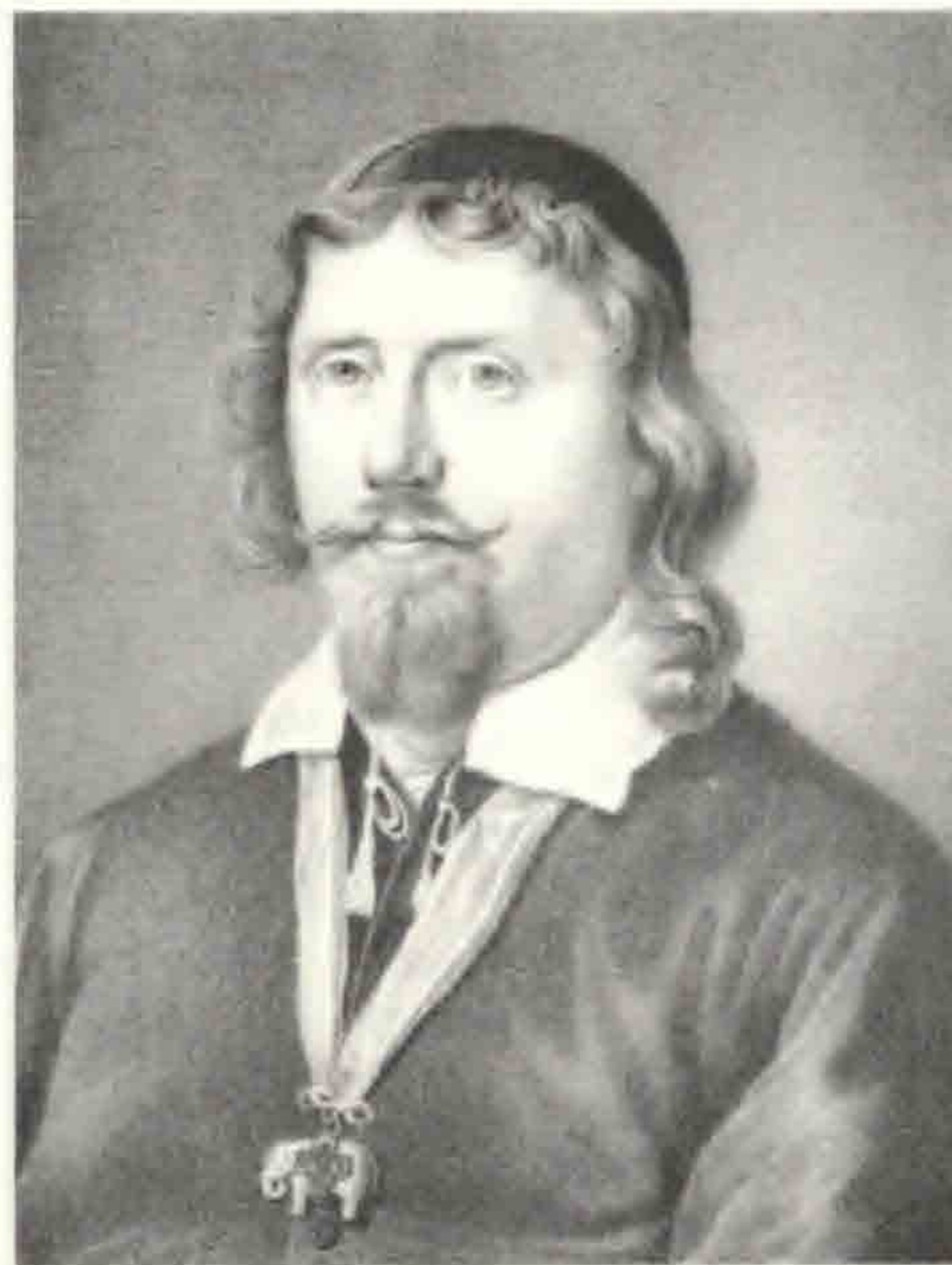
Corfits Ulfeldt (1606-1664).