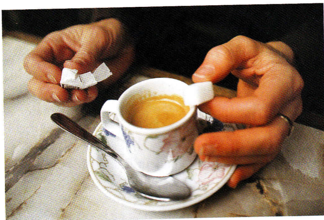
■ El estado de bienestar pretende generalizar un alto nivel de consumo.