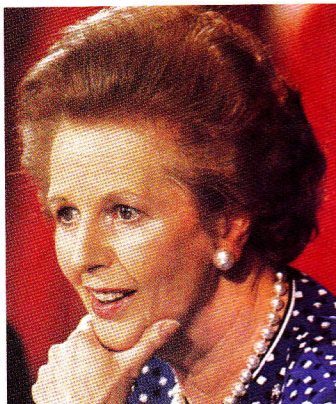
■ Margaret Thatcher, primera ministra británica, impulsora del neoliberalismo.

■ El neoliberalismo busca una economía de libre mercado, donde las empresas compiten entre sí en el libre juego de la oferta y la demanda. Desde luego, como en el deporte, solo unos pocos ganan.