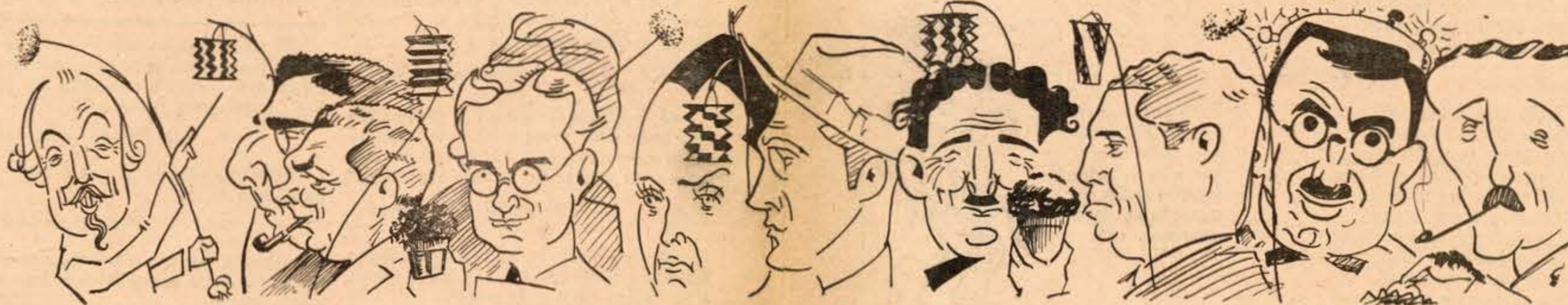
A RUSGA DO «PIROLITO».