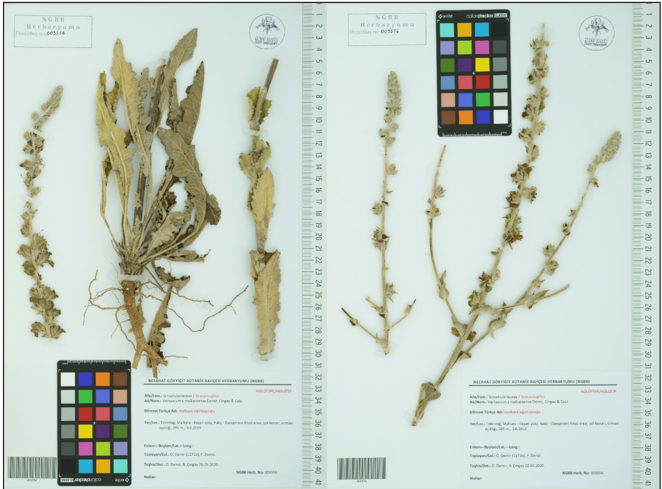
Şekil (Figure) 1. V. x malkaraense melezinin holotip örneği (NGBB 009556, 1. ve 2. karton)