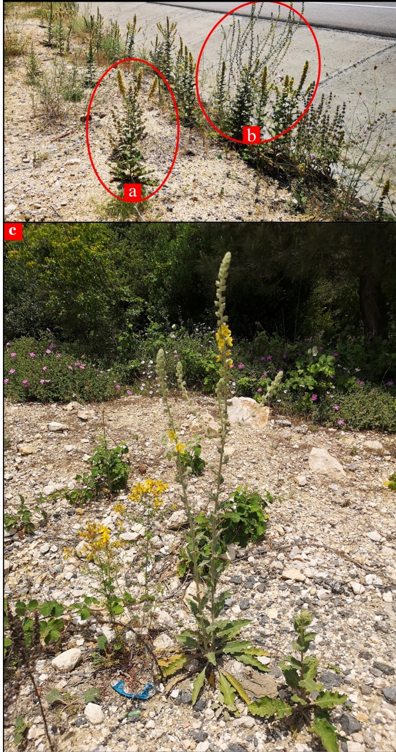
Şekil (Figure) 2. a) V. ovalifolium subsp. thracicum , b) V. purpureum , c) V. x malkaraense taksonlarının genel görünüşü

V. purpureum: Çanakkale: Gelibolu, Keşan'a 25-30 km kala, 195 m, 22 vii 2006, F.A. Karavelioğulları 3571 (DUOF 0001568[!]; GAZI!). Edirne: Lalapaşa, Lalapaşa-Süloğlu, 2. km, Dağlık deresi, 195 m, 22 vii 2006, F.A. Karavelioğulları 3586 (DUOF 0001570[!]; GAZI!). Lalapaşa, Bağlık deresi civarı, 19 vi 2002, G. Yılmaz (EDTU 8340[!]). Lalapaşa, Bağlık deresi-tepelik, 19 vi 2002, G. Yılmaz ve N. Başak (ISTE 101529!); aynı yer / ibid., 27 viii 1988, F. Dane ve N. Kaptanoğlu (ISTE 101528!). Kırklareli: Demirköy, Sarpdere yolu, 511 m, 14 vi 2009, E. Akalın ve S. Demirci (ISTE 92088!). Tekirdağ: Yaylagöne Köyü yolu girişi, 292 m, 20 vi 2019, O. Demir 1153 ve B. Çingay (NGBB 011199!). Haliç ile Danişment arası, 286 m, 3 vi 2019, O. Demir 1171 ve F. Demir (NGBB 011200!).