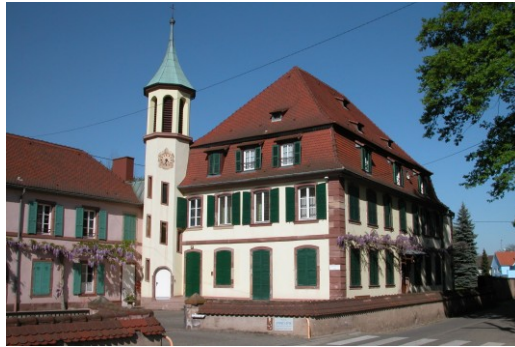
La Maison Saint-Léon à Wolxheim - Le Canal (67)