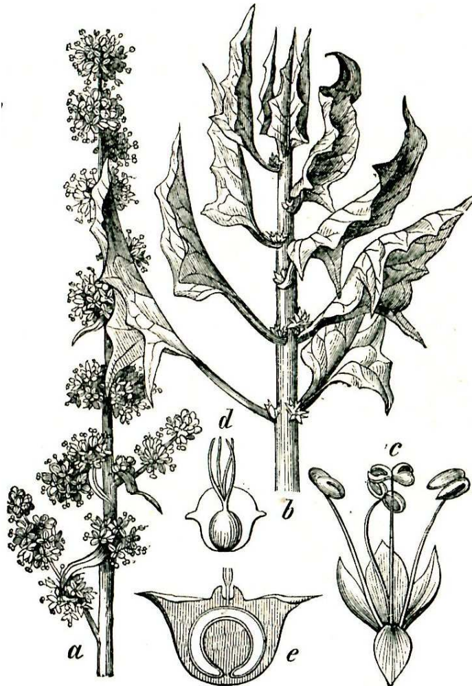
Spinacia oleracea L.

Herbier de l'Université de Strasbourg Institut de Botanique 28, rue Goethe F-67000 Strasbourg hoff@unistra.fr