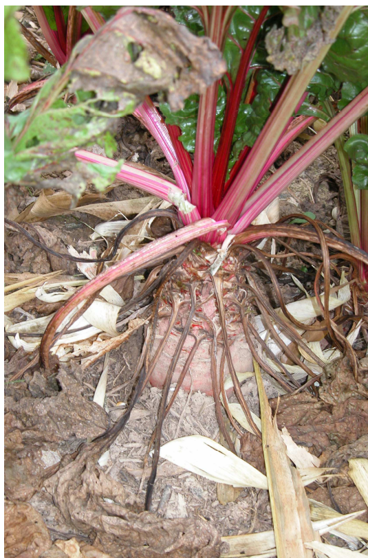
Beta vulgaris L. – Betterave sucrière – Champ en Alsace dans le Kochersberg

Beta vulgaris L. subsp. maritima (L.) Arcangeli - LEMÉE G. - [France, Basse-Normandie, Calvados, Sallenelles] - X = 412770 - Y = 2477527 - Alt. 1 m, - Herbar(s) : Herbar Lemée - (sous : Beta maritima L.) - STR- 67750.