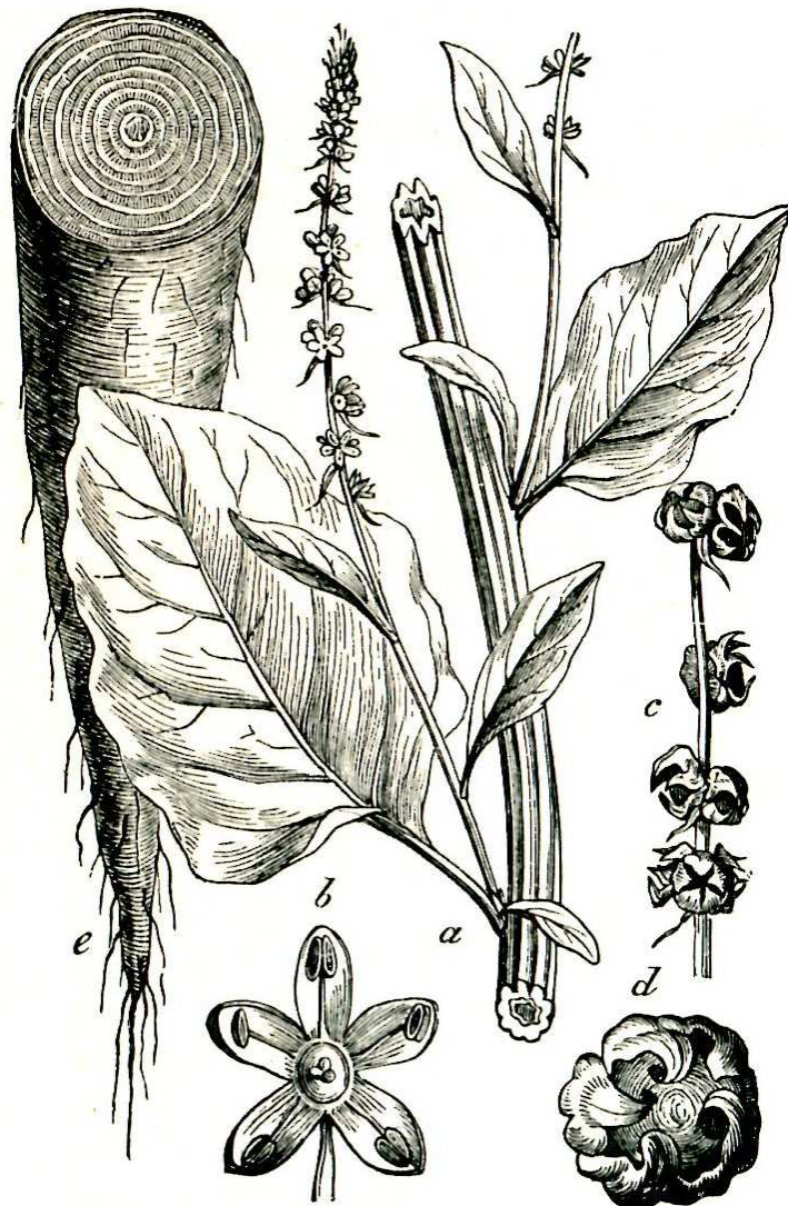
Beta vulgaris L.