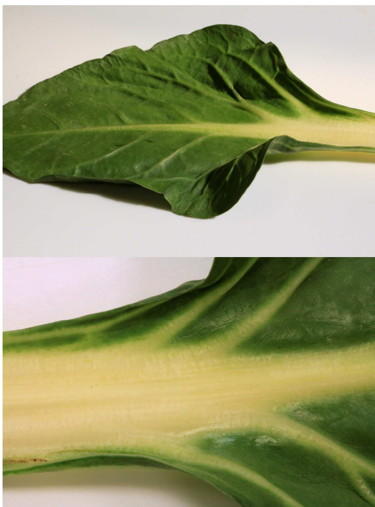
Beta vulgaris L. – Bette, Côte de blette

Beta trigyna Waldst. & Kit. - WALTER E. ET LOYSON E., KAPP E. - [France, Alsace, Bas-Rhin, Dorlisheim - X = 980348 - Y = 2403997] - 19/ 6/1926 - (sous : Beta trigyna Waldst. & Kit.) - STR- 2463.