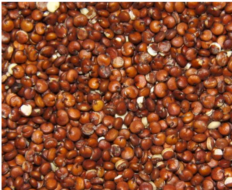
Graines de quinoa : Chenopodium quinoa Willdenow

Chenopodium quinoa Willdenow - LUDWIG A. - [France, Alsace, Bas-Rhin, Strasbourg - X = 999646 - Y = 2412220] - plante cultivée. - 15/10/1906 - (sous : Chenopodium quinoa ) - STR- 2565.