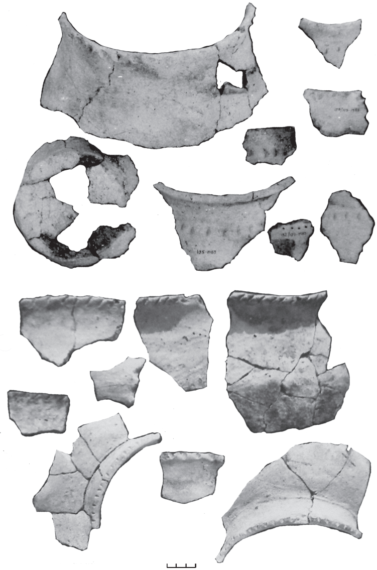
Рис. 3. Фрагменти ліпного посуду