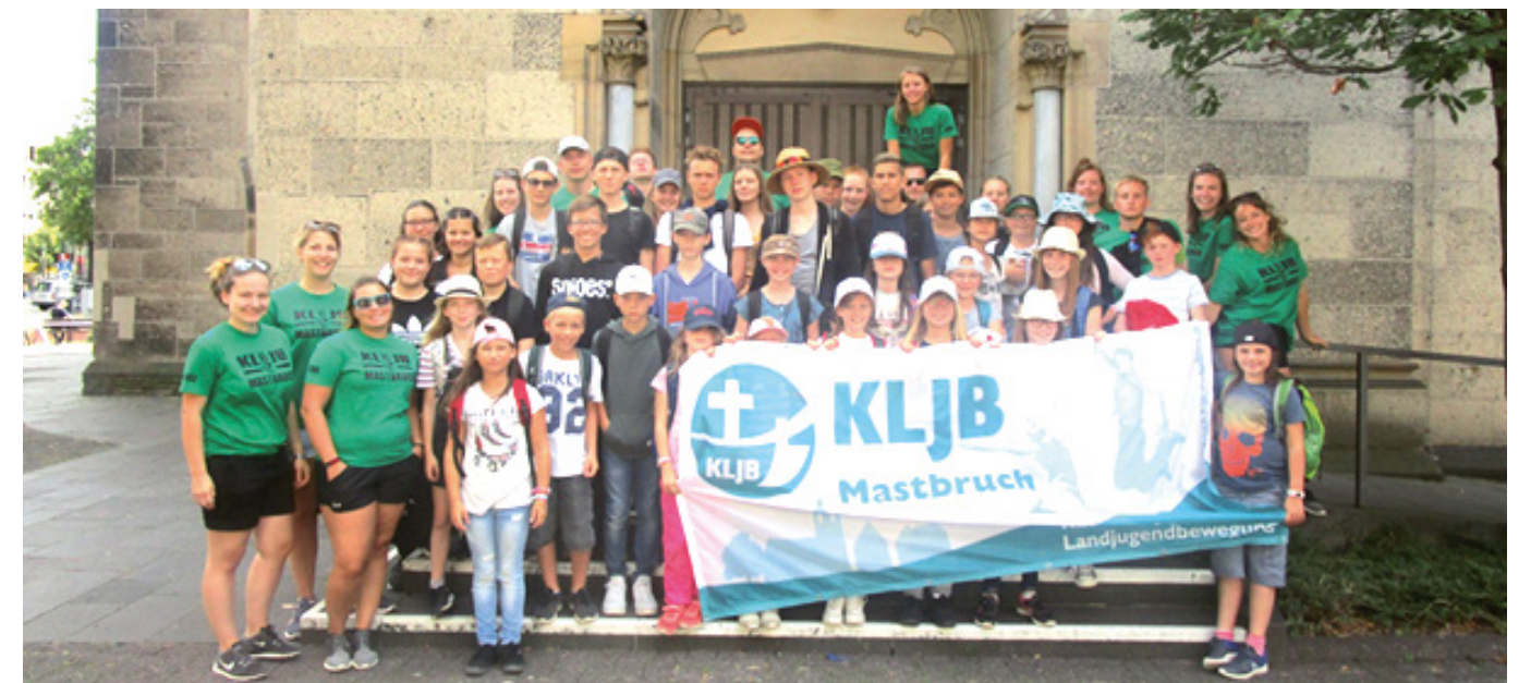
Ausflug nach Koblenz

Auch dieses Jahr startete die KLJB in den Sommerferien wieder ins Zeltlager, das diesmal unter dem Motto „Dschungel“ stand. 36 Abenteurer im Alter von acht bis fünfzehn Jahren und 15 Ranger begaben sich für 12 Tage auf eine „gefährliche Reise“ zum Jugendzeltplatz in Boppard.