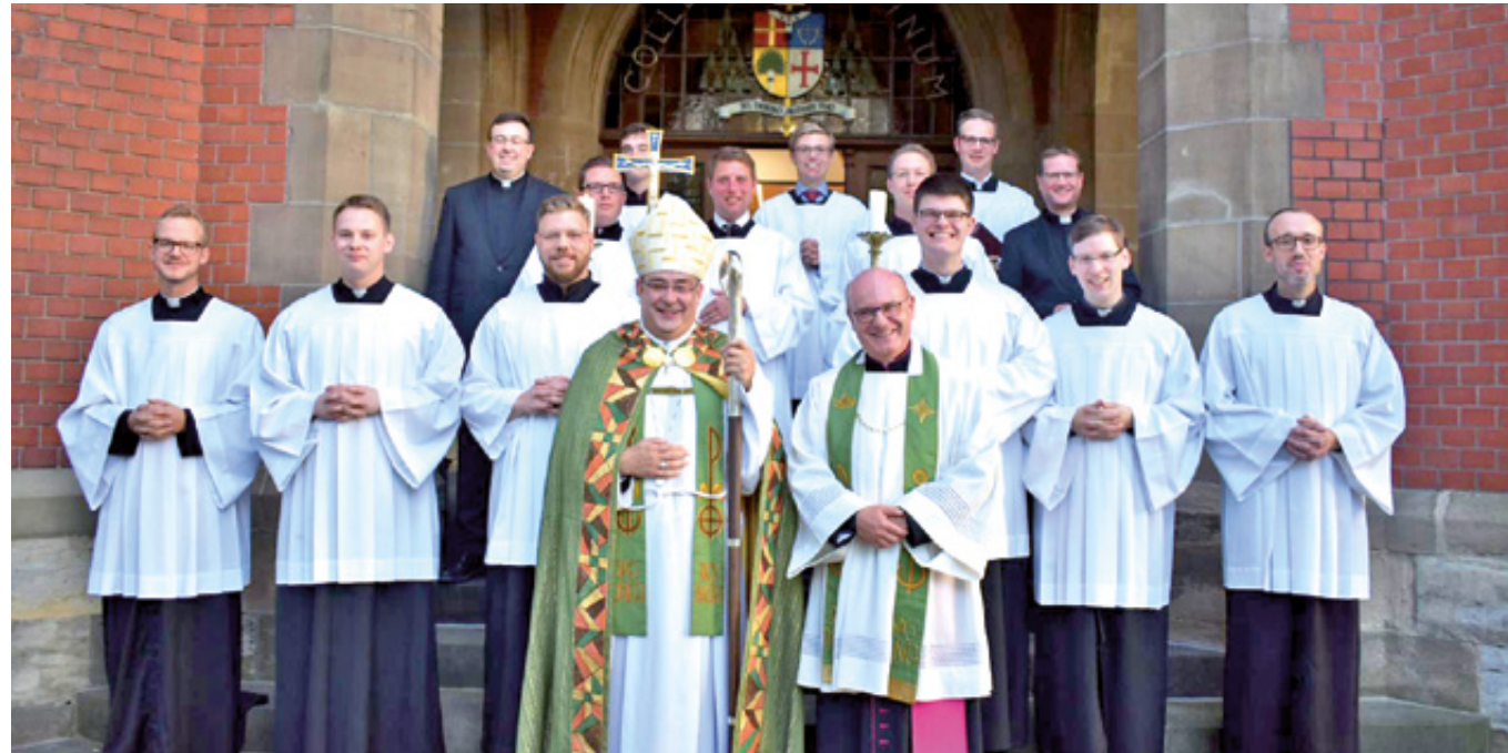
Jetzt auch offiziell ein Weiehekandidat 3.v. links

Mein Praktikum in der Pfarrei Heiliger Martin