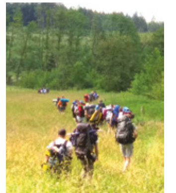
Ein Haik = Orientierungslauf

ter nach Rüthen. Ein bisschen abenteuerlich wurde es, als wir einen Fluss überqueren mussten. Pünktlich zum Mittagessen kamen wir in Rüthen in unserem Diözesanzentrum an, wo wir auf die restlichen Pfdas aus unserem Diözesanverband trafen. Noch vor dem Zeltaufbau nutzten einige Pfdas die Zeit für ein Nickerchen in der Sonne. Abends fand dann die offizielle Eröffnung in der Zeltplatzarena statt.