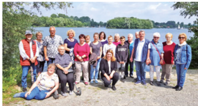
Die Gottesdienstgemeinde am See

Am 21. Juli 2019 feierten wir unseren Sonntagsgottesdienst einmal nicht in unserer ev. Paul-Gerhardt-Kirche in Sennelager. Für den ersten Sonntag unserer jährlichen „Sommerkirche“ ging es hinaus an den Lippesee. Ein Gottesdienst auf dem Weg, ein Gottesdienst, der uns ein bisschen mehr in die Pflicht genommen hat, den wir aktiv mitgegangen sind.