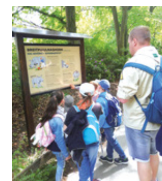
An den Infotafeln konnte man eine Menge über die gesehenen Tiere lernen

Stationsaufgaben, wie zum Beispiel Sackhüpfen, Fußabdrücke von Tieren zuordnen, mit verbundenen Augen durch einen Parcours geleitet werden, eine Traumreise, Gegenstände erfühlen, Gerüche riechen und vieles mehr mit Erfolg absolviert. Die Teamfähigkeit spielte hierbei eine wichtige Rolle, aber auch der Spaßfaktor kam nicht zu kurz. Natürlich durften auch die Pommies zum Mittagessen als Stärkung nicht fehlen. Am Ende des Tages trafen wir uns am Hauptplatz