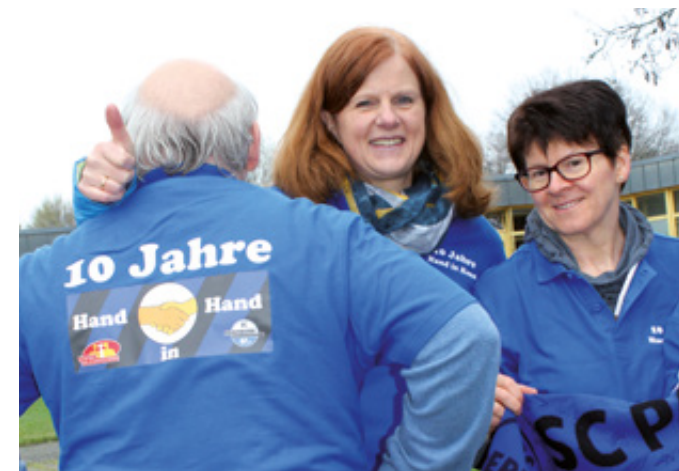
Hand in Hand für den SCP

des Jahres. Die Besuche der Heimspiele und Auswärtsspiele sind ohne ein ehrenamtliches Engagement natürlich nicht möglich. Aber mittlerweile zählt „Hand in Hand“