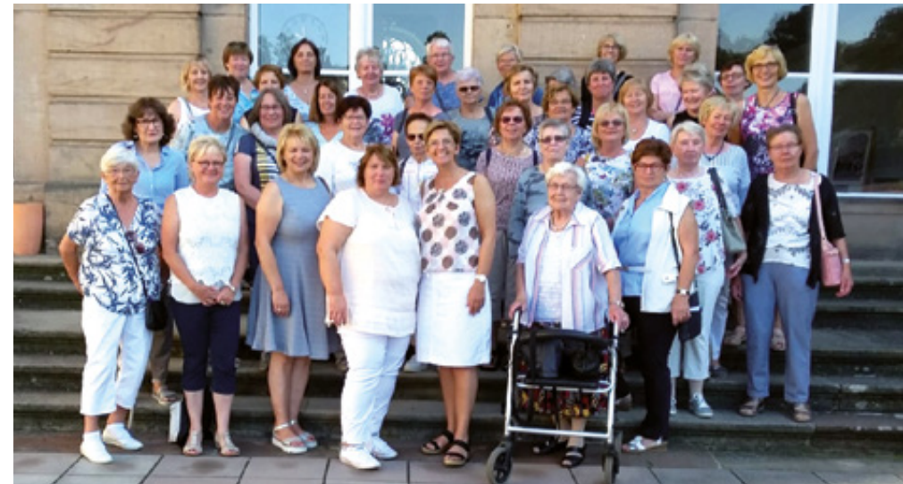
Die Teilnehmer der Tagesfahrt

Tagesfahrt der kfd St. Joseph Mastbruch nach Bad Arolsen und zum Edersee