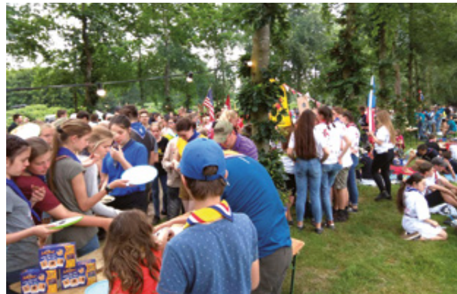
Intercamp kulinarische Meile

Pfadfinder aus Schloss-Neuhaus und Elsen in den Niederlanden