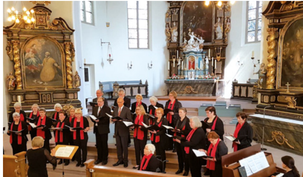
Die Chormitglieder während der Aufführung

Reisebericht zum Tagesausflug der evangelischen Frauenhilfe