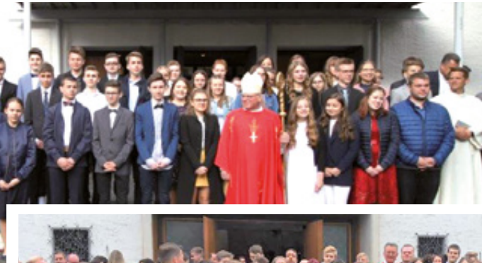
Firmung im Jahr 2019 in St. Michael Sennelager