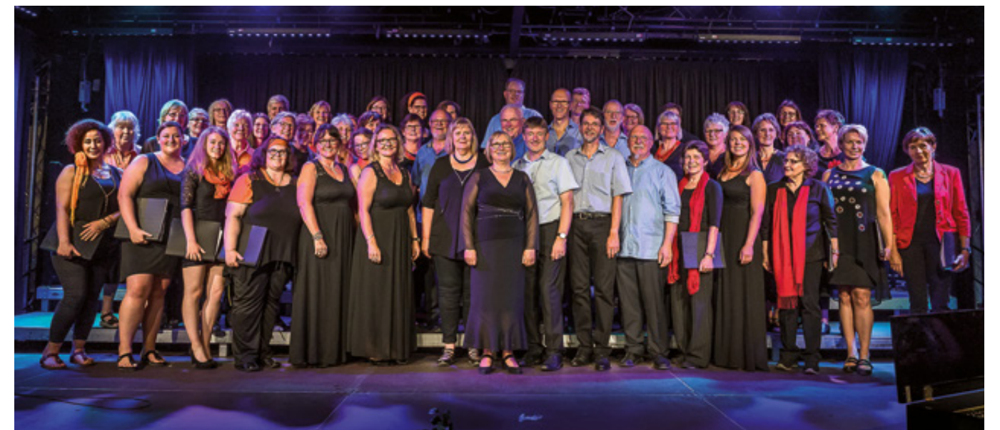
Der Chor Cantare auf der Bühne der Kulturwerkstatt