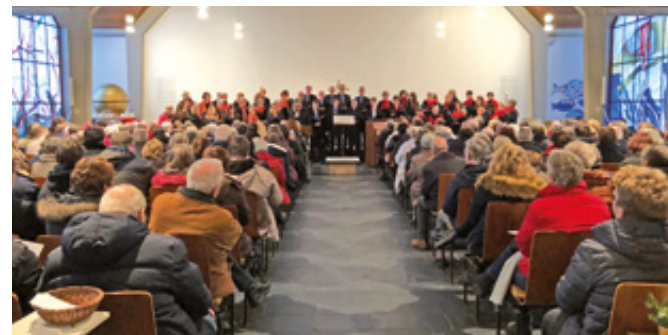
Mit einem besinnlichen und beschwingten musikalischen Programm möchte der Chor Cantare auf die vorweihnachtliche Zeit einstimmen

Weihnachtsfest einstimmen. Der Eintritt ist frei, doch die Mitwirkenden freuen sich über einen Kostenbeitrag, der am Ausgang gegeben werden kann. Ein Teil davon kommt dem Bau des Turmfriedhofes an der Christuskirche zugute. Der Chor sucht übrigens noch Verstärkung in den männlichen Stimmen. Interessenten sind herzlich zu Schnupperproben willkommen. Weitere Infos in Internet: www.chor-cantare.de