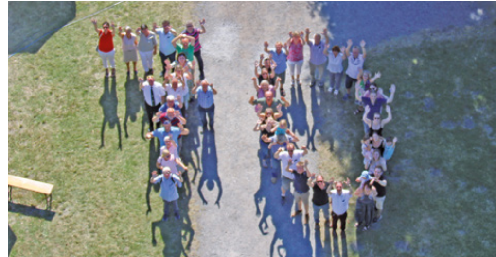
70 Jahre, anschaulich dargestellt

70 Jahre KAB - Familien und Männerverein St. Joseph Mastbruch e.V.