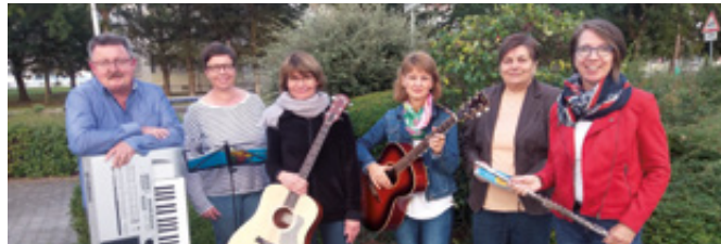
Musikgruppe „Kreuz und Quer“

Seit vielen Jahren begleitet die Musikgruppe „Kreuz und Quer“ Familiengottesdienste in unseren Gemeinden. In Sennelager gegründet, legt sich die Band aber nicht auf einen Kirchturm fest. Je nach Ort, Zeit und Anlass werden verschiedene gottesdienstliche Angebote begleitet, als komplette Gruppe oder auch „nur“ mit Keyboard und Gesang. Der „Gottesdienst am See“ Anfang Juli ist ein schönes Beispiel für solch ein besonders gestaltetes Angebot.