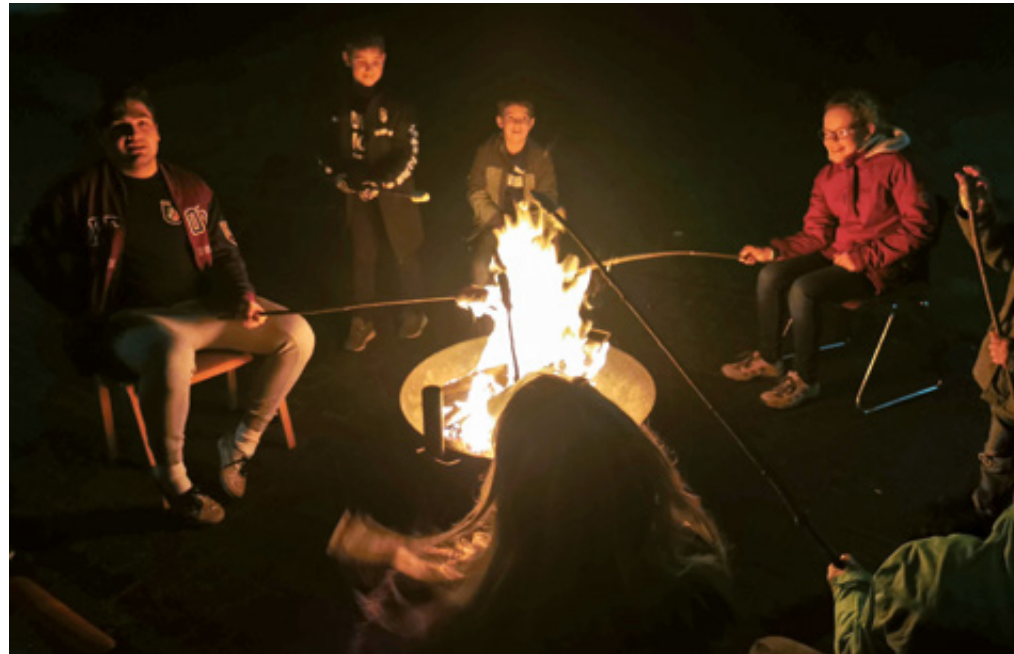
Messdiener in Action beim Stockbrot backen

Eine Herbstferienaktion für alle Messdiener