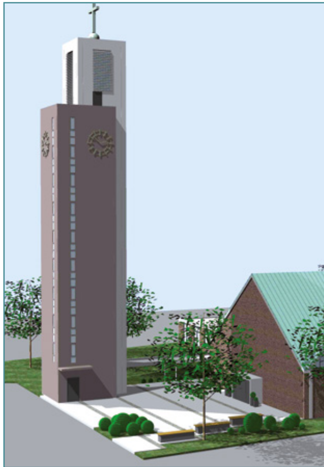
Der Turmfriedhof im favorisierten Entwurf der Paderborner Hochbaugesellschaft Puls+Stratmann

Vom Turmfriedhof verspricht sich die Gemeinde neben der Komplettierung des optischen Auftritts an der Bielefelder Straße – die Christuskirche ist ohne ihren Turm von deutlich reduzierter Strahlkraft – und der Rückkehr der seit dem Rückbau des alten Turms eingelagerten Glocken auch einen neuen Schwerpunkt in der Gemeindegarbeit. Der Umgang mit Tod und Trauer soll ganz bewusst von abseitigen Friedhöfen in die Mitte der Gemeinde gerückt werden. „Wann immer unsere Glocken läuten, werden sie dies vom Turmfriedhof aus auch im Namen unserer Verstorbenen tun – ein ebenso erfreuliches wie richtiges Bild“, ist der Pfarrer sich sicher, dass das Konzept im eigentlichen Wortsinn trägt, und zwar nicht nur Schallwellen, sondern auch die in ihnen mitschwingende Botschaft: Schicke dich, deinem Gott zu begegnen (Amos 4.12) ist derzeit der interne Favorit für das Turmfriedhofs-Motto, zu dessen Findung die Gemeinde mit aufgerufen ist.