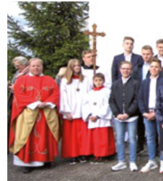
Firmung im Jahr 2019 in St. Joseph Mastbruch

Wir würden uns freuen, wenn Du bei der Vorbereitung mitmachst! Melde Dich einfach über unser Internetformular unter http://hl-martin-schlossneuhaus.de/firmbewerbung/ zur Firmvorbereitung an. Anmeldeschluss ist der 1. März 2020. Bei Fragen kannst Du mir gerne eine Mail senden! Um eine Sache