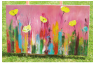
Auch Maler aus der Region stellen Bilder bei „Kunst trifft Handwerk“ aus