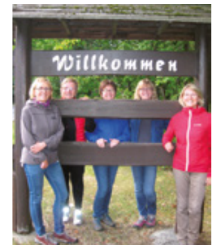
Titelbild: Ankommen

Media-Print Informationstechnologie GmbH Artinspire-Marion Rubow 8.800 alle 5 Monate