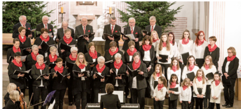
Der Sander Kirchenchor: Jung und Alt singen gemeinsam

Gegründet wurde der Sander Kirchenchor 1926 als Jungmännerchor, um insbesondere bei Neuaufnahmen in die Gemeinde „ordentlich und mehrstimmig“ singen zu können. In der nachfolgenden Zeit wurden zur Steigerung der Mitgliederzahl auch verheiratete Männer in den Chor aufgenommen und der Chor sang zusätzlich Weihnachten und Ostern in der Kirche. Die Chorarbeit wurde während des Zweiten Weltkriegs eingestellt und 1947 wurde auf der Grundlage des ursprünglichen Männerchores ein gemischter Kirchenchor ins Leben gerufen. Damals gab es zehn Sopranstimmen, neun Altstimmen, zehn Tenöre und sechs Bassstimmen. Der Chor begleitete die kirchlichen Hochfeste und den ersten Spatenstich, das Richtfest und die Weihe der neuen Kirche 1953. Im Jahr 1982 wurde zum ersten Mal ein Advents- und Weih-