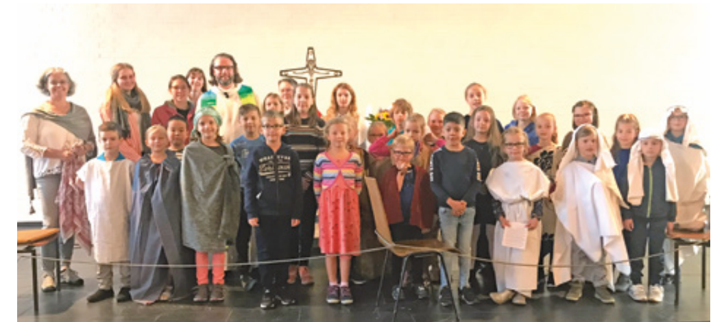
Alle an Bord – die Mannschaft vom Kinderbibel-Wochenende in der Christus-Kirche

das Theaterstück zusammen mit den Helfern vorspielten und aus voller Kehle das von Pastor Peters umgedichtete Lied nach der Melodie „An der Nordseeküste“ sangen: „Komm an Bord“, sagt Jesus