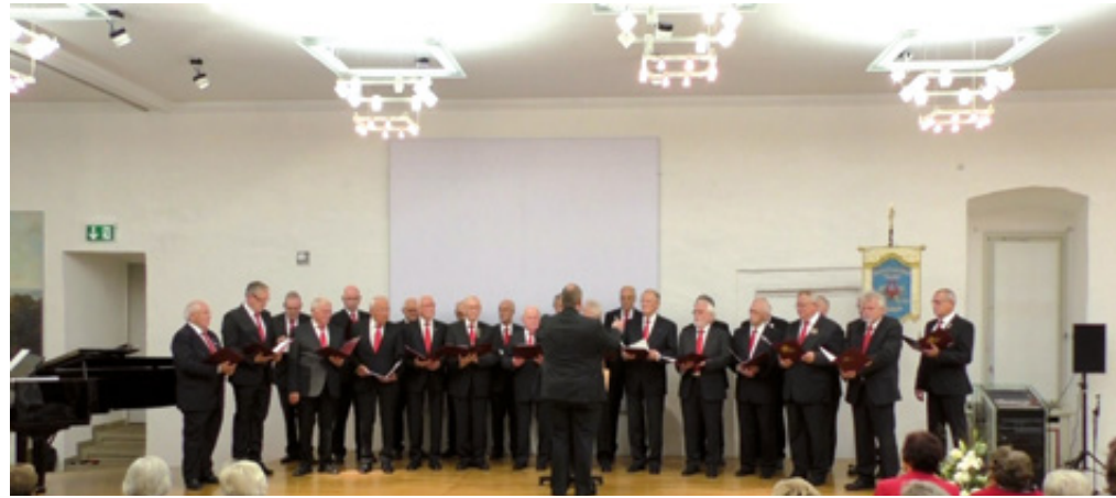
Sänger und Publikum hatten viel Freude am Konzert- und Liederabend

Die Chorgemeinschaft der Männergesangsvereine Cäcilia Schloß Neuhaus und Tandaradei Nordborchen unter der Leitung von Christian Nolden haben einen Konzert- und Liederabend im Spiegelsaal von Schloß Neuhaus veranstaltet, der in vielerlei Hinsicht besonders war. Entgegen den üblichen Sonntagsnachmittagskonzerten der vergangenen Jahre, hatte die Chorgemeinschaft zu späterer Stunde am Samstagabend in den festlich beleuchteten Festsaal des Schlosses gelangt.