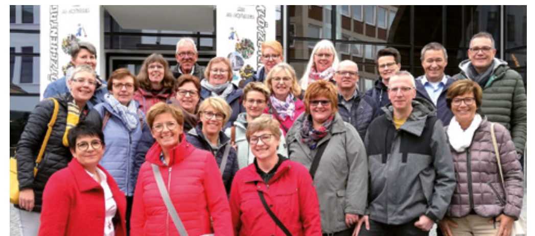
BMitglieder der Kolpingsfamilie in Münster

Der Stadtführer machte anschaulich, wie aufwändig die Dreharbeiten oft sind und dass in der Regel nur einige wenige Szenen tatsächlich