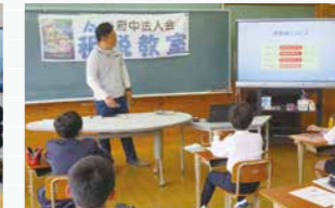
神石高原町立油木小学校