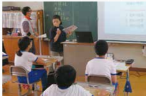
府中市立上下南小学校