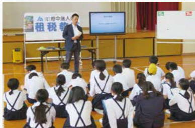
府中市立旭小学校

警察署・救急車・信号機・コンビニ・本屋・学校など身近にある施設等が描かれたマグネットを税金が使われているもの、使われていないものに区別し児童たちに思うままに黒板に貼ってもらい、答え合わせをする方法。