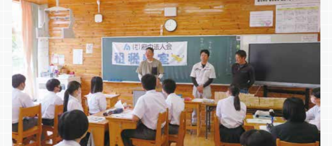
神石町立三和中学校