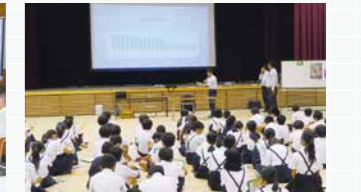
府中市立府中学園（前期生）