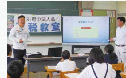
神石高原町立来見小学校