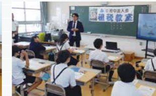
府中市立栗生小学校