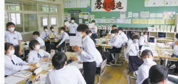
府中市立上下中学校

過去に出題された税金関係の高校入試問題をグループで協議をして回答、正解したグループに模擬紙幣を賞金として提供。獲得した賞金の合計額を総所得額として確定申告をして、獲得賞金の中から納税をしてもらう方法。