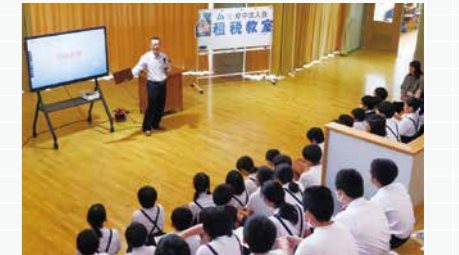
府中市立国府小学校