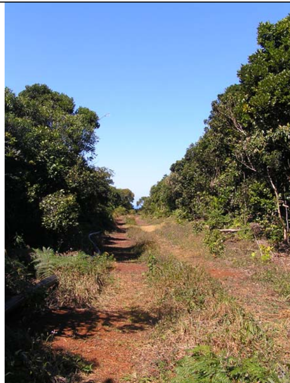
Fig. 2 : Layonnage réalisé dans une forêt sur cuirasse, occasionnant une ouverture du milieu