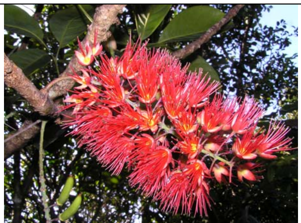
Fig. 9 : Geissois sp., taxon nouveau

Récoltes réalisées lors de cette mission, et identification en décembre 2009.