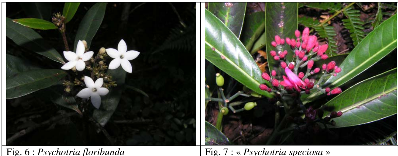
Fig. 6 : Psychotria floribunda