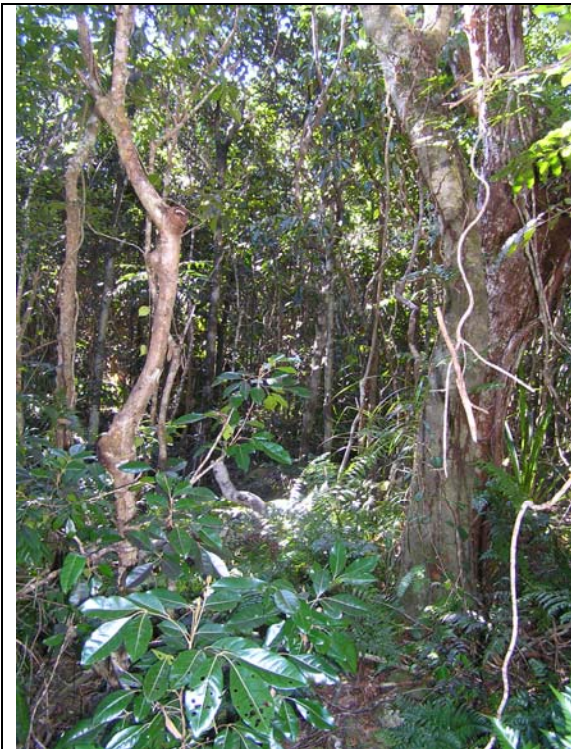
Fig. 1 : forêt basse sur cuirasse démantelée

Le plateau Nord est caractérisé par une forêt basse sur cuirasse démantelée (sol ultramafique), dont la physionomie rappelle celle des forêts sèches de la côte ouest de la Grande Terre (Figure 1). La flore y est fortement diversifiée et endémique, et la formation relativement bien conservée. Le plateau Sud présente également ce type de formations, mais nettement moins bien préservé et moins diversifié.