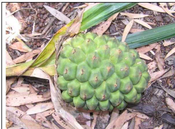
Fig. 8 : Pandanus belepensis , espèce nouvelle

Une espèce de la famille des Cunoniaceae (Faux-Tamanou) appartenant au genre Geissois semble également constituer une nouveauté taxonomique du groupe (Figure 9). Cette espèce n'a été retrouvée que sur le plateau Nord et la population compte actuellement deux individus adultes.