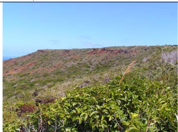
Fig. 4 : impact des feux de brousse sur les formations végétales originelles

Trois autres grandes catégories de formations végétales ont pu être observées, chacune correspondant à un processus de recolonisation de l'espace après passage d'un feu de brousse plus ou moins ancien. Le maquis minier arbustif, relativement riche en espèces endémiques, est une formation de succession des forêts basses après passage d'anciens feux. Les savanes à