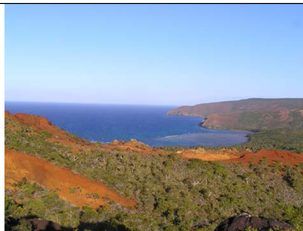
Fig. 3 : formation à Niaouli