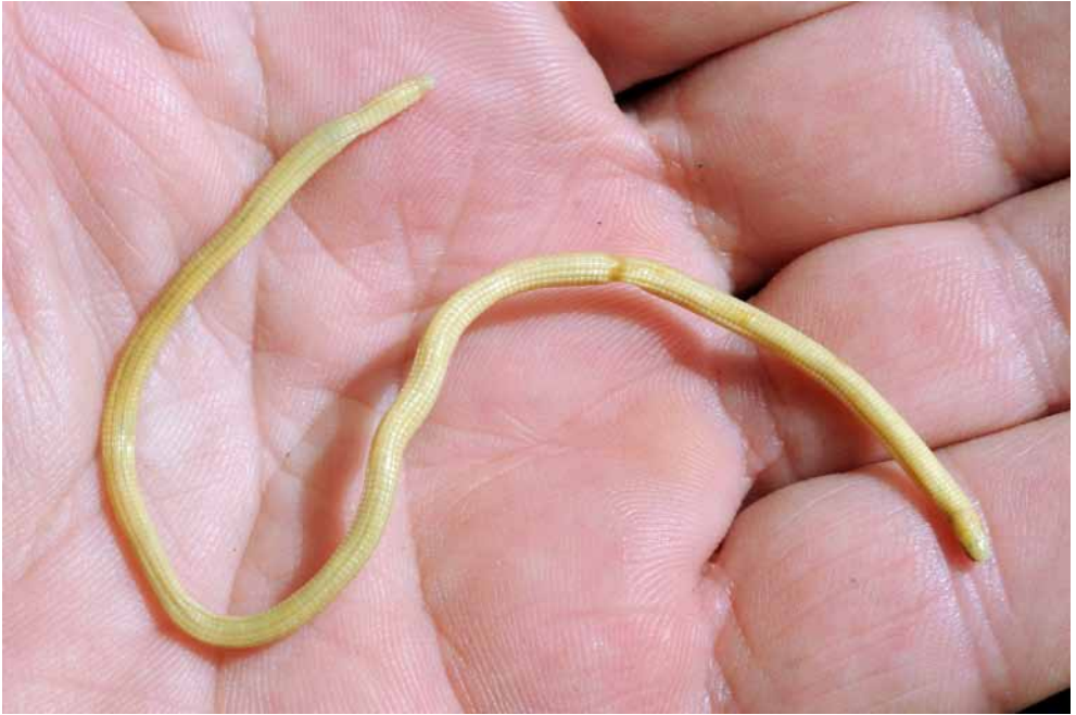
Figure 1 : Vue générale de l'holotype de Cynisca manei sp. nov. après préservation. Figure 1: General view of the holotype of Cynisca manei sp. nov. after preservation.