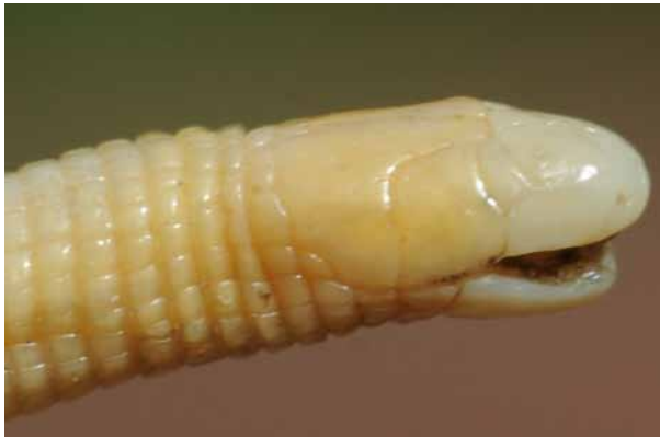
Figure 4 : Cynisca manei sp. nov. Tête de l'holotype en vue latérale. Figure 4: Cynisca manei sp. nov. Lateral view of the head of holotype.

est fusionnée avec les temporales et forme une grande plaque bordée par la première supra-labiale postérieure vers l'avant, par la post-frontale puis la pariétale vers le haut et par des segments du premier anneau du corps et une petite troisième supralabiale postérieure vers l'arrière. La post-frontale forme de chaque côté de la tête une paire de plaques allongées largement en contact entre-elles et fortement rétrécies vers l'arrière. Une très étroite pariétale prolonge de chaque côté la post-frontale postérieurement. Du côté droit, la séparation entre la post-frontale et la pariétale est située nettement plus en arrière que du côté gauche.