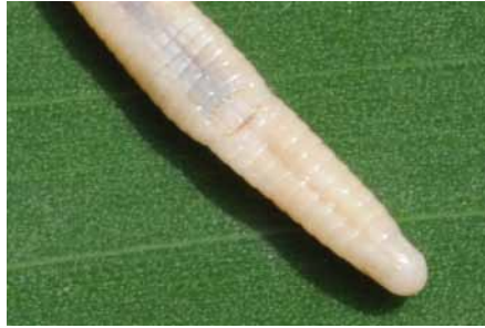
Figure 5 : Cynisca manei sp. nov. Vue ventrale de la région cloacale et de la queue de l'holotype. Figure 5: Cynisca manei sp. nov. Ventral view of the cloacal region and of the tail of the holotype.

Le corps présente un sillon vertébral médian et deux sillons latéraux. Le nombre d'anneaux le long du corps est de 272 (en débutant le dénombrement au niveau du premier demi-anneau ventral, soit au niveau du troisième rang après la mentonnière, et en le poursuivant jusqu'à l'anneau comprenant les pores fémoraux qui est inclus). Il existe deux anneaux incomplets au niveau de la zone anale. Le nombre d'anneaux de la queue est de 10 avant un bourrelet terminal de cicatrisation. On compte huit segments dorsaux et sept segments ventraux sur chaque anneau. Le segment médio-ventral est très élargi, environ six fois plus large que long au milieu du corps. Le nombre de pores cloacaux est de huit. Le nombre de plaques anales est de six. La queue est mutilée et cicatrisée au niveau du dixième anneau caudal qui correspond probablement au site d'autotomie (Fig. 5).