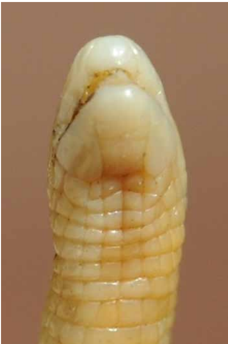
Tête de l'holotype de Cynisca manei Trape, 2014, en vue ventrale. Ventral view of the head of Cynisca manei Trape, 2014, holotype.