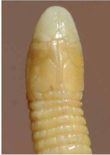
Figure 3 : Cynisca manei sp. nov. Tête de l'holotype en vue dorsale. Figure 3: Cynisca manei sp. nov. Dorsal view of the head of holotype.