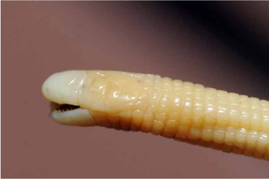
Tête de l'holotype de Cynisca manei Trape, 2014, en vue latérale. Lateral view of the head of Cynisca manei Trape, 2014, holotype.