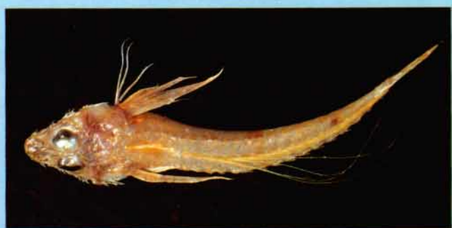
D - Hoplichthys citrinus