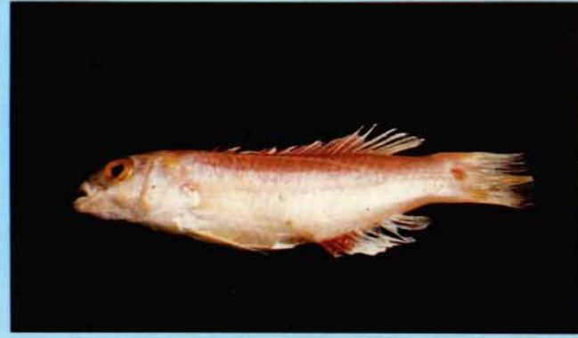
D - Bodianus cylindriatus