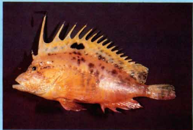
B- Ocosia apia