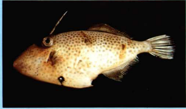
B - Thamnaconus tessellatus