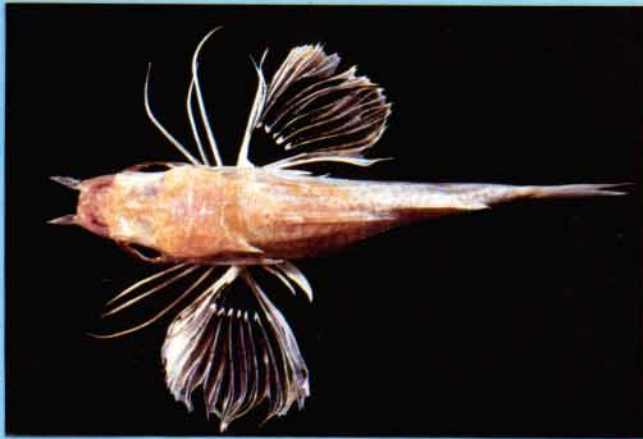
A - Pterygotrigla sp.