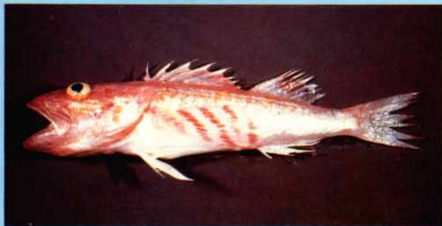
C - Setarches guentheri