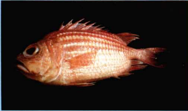
A - Ostichthys kaianus