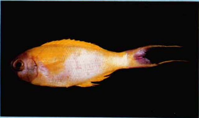
C - Callanthias australis