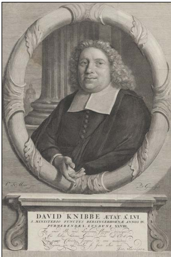
David Knibbe (1739–1701) portréja (C. de Moor és P. van Gunst munkéja, 1696), (Universiteitsbibliotheek Vrije Universiteit Amsterdam, PORTRET 1 KN1 001)

Bár Knibbe leideni lelkésziségének bő három évtizede alatt számos magyarországi és erdélyi diák fordult meg Leidenben, a lelkész neve ennek ellenére nem bukkan fel sem peregrinuslevelekben, sem diákjaink naplóiban, és a magyar diákok leideni disputációinak, illetve disszertációinak ajánlásai-ban sem. Egyedül Kaposi Sámuel említi omniáriumában lelkészként Leiden város tisztségviselőinek felsorolásában. 13 A személyes kapcsolatra utaló adatok hiánya ellenére van adat arra, hogy Knibbe homiletikai művét a magyar diákok ismerték, és peregrinációjukról hozták magukkal belőle pél-