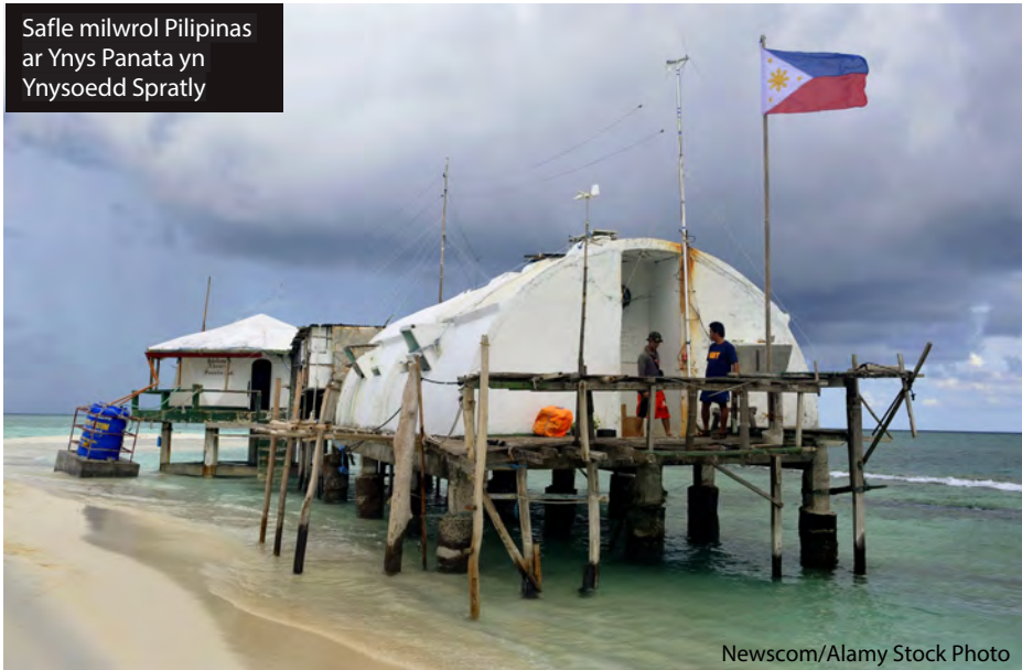
Safle milwrol Pilipinas ar Ynys Panata yn Ynysoedd Spratly

Penderfynodd y tribiwnlys hefyd fod China wedi: