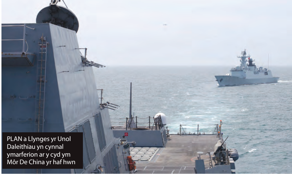
PLAN a Llynges yr Unol Daleithiau yn cynnal ymarferion ar y cyd ym Môr De China yr haf hwn

Agwedd arall ar yr anghytuno hwn yw'r ffaith bod Môr De China yn ardal â mwy a mwy o gystadlu amdani, a gwrthdaro posibl rhwng China, ei chymdogion ac UDA. Dros y degawdau diwethaf, mae China wedi ceisio ymestyn ei ffin amddiffynnol allan i'r môr. Mae Llynges China, Llynges Byddin Rhyddid y Bobl (PLAN: People's