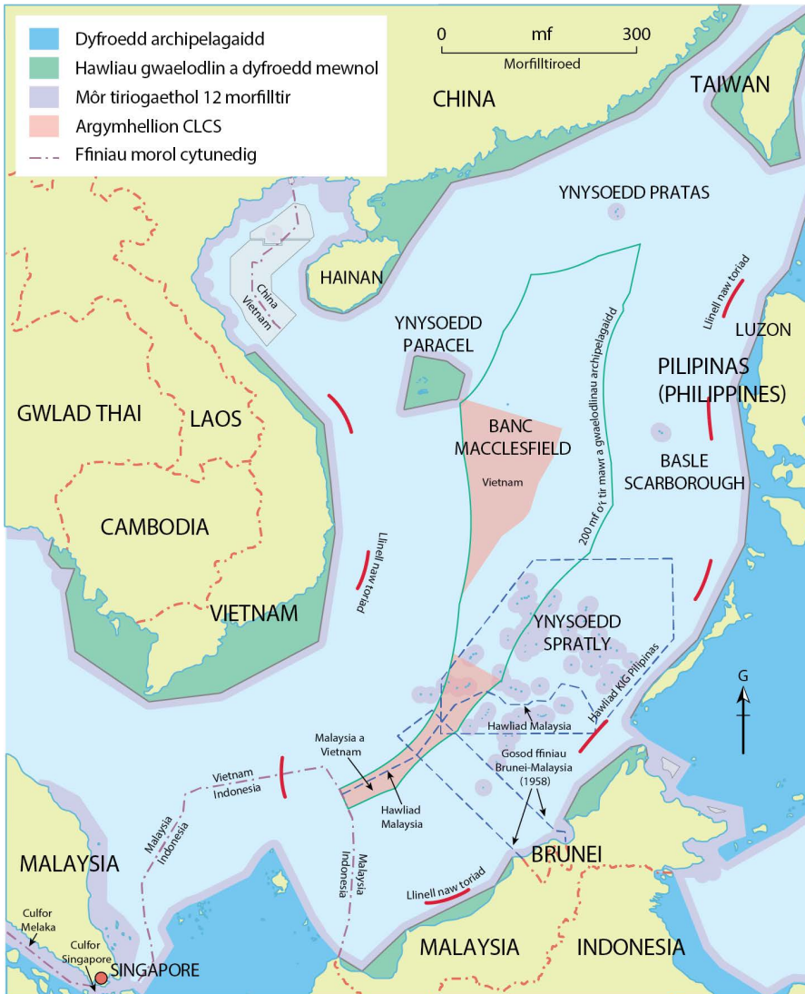
Ffigur 1 Cystadleuaeth rhwng hawliadau morol ym Môr De China

Fôr De China yn cludo gwerth dros US$5 triliwn o fasnach bob blwyddyn. Mae hyn yn cynnwys tua 25% o'r olew sy'n cael ei gludo ar y môr (dros 15 miliwn o gasgenni y dydd) a thros 50% o'r fasnach fyd-eang mewn nwy naturiol hylifedig.