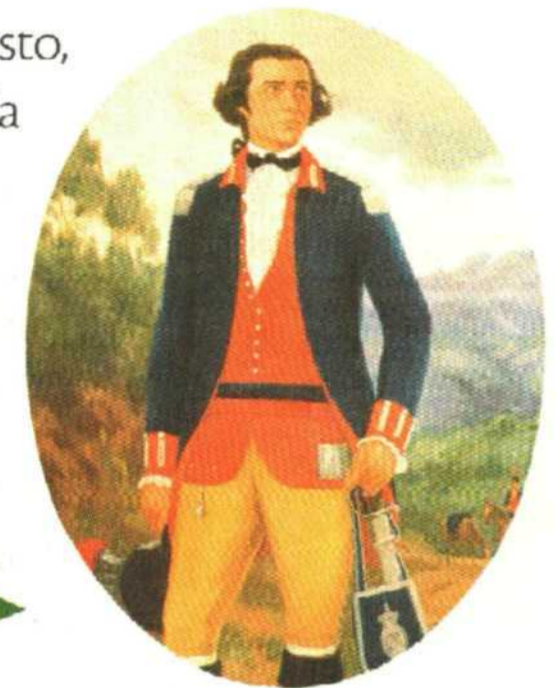
Retrato de Tiradentes realizado por José Washt Rodríguez.

Al ejecutar a Tiradentes, la Corona lusitana buscó intimidar a la población de la colonia. Sin embargo, logró el resultado opuesto, ya que el hecho generó simpatía por los conspiradores, y Tiradentes, con el tiempo, se convertiría en un héroe nacional.