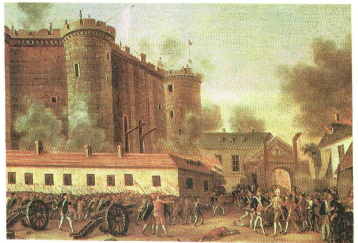
▲ Tradicionalmente se ha considerado a la toma de la prisión real de la Bastilla, el 14 de julio de 1789, como el comienzo de la Revolución Francesa.

En 1794, los altos niveles de violencia interna que caracterizaban a la República (miles de ciudadanos fueron ejecutados en la guillotina) hicieron que los sectores más moderados, apoyados por una fracción del Ejército, desplazaran a los jacobinos. A partir de entonces se iniciaría una etapa caracterizada por la hegemonía creciente de un general, Napoleón Bonaparte , que expandió la influencia del proceso revolucionario al resto de Europa. La voluntad de las monarquías europeas de resistir la proyección de los principios revolucionarios derivó en la formación de varias coaliciones para luchar contra Francia. Se iniciaron así las llamadas "guerras napoleónicas" , que se extendieron entre 1799 y 1815.