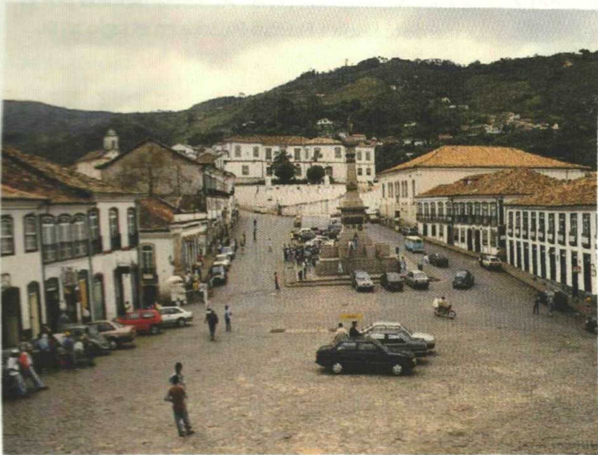
▲ La Plaza Tiradentes, en la ciudad de Ouro Preto, en Brasil. Ouro Preto es la capital del actual Estado de Minas Gerais. Tuvo un gran desarrollo a partir del estallido de la fiebre del oro y los diamantes, en el siglo xviii.

Durante el proceso de las reformas pombalinas, la Corona incrementó la presión para aumentar la recaudación de los impuestos vinculados con las actividades mineras, entre ellos el llamado "quinto real" (la quinta parte de la producción). Por otro lado, hubo cambios importantes en la administración colonial al llegar a la Capitanía de Espírito Santo un nuevo gobernador, que desplazó a importantes sectores de la elite local del control del gobierno. Dicha elite estaba formada tanto por mineros como por hacendados y militares de alto rango que se beneficiaban del control de las rutas de salida del oro.