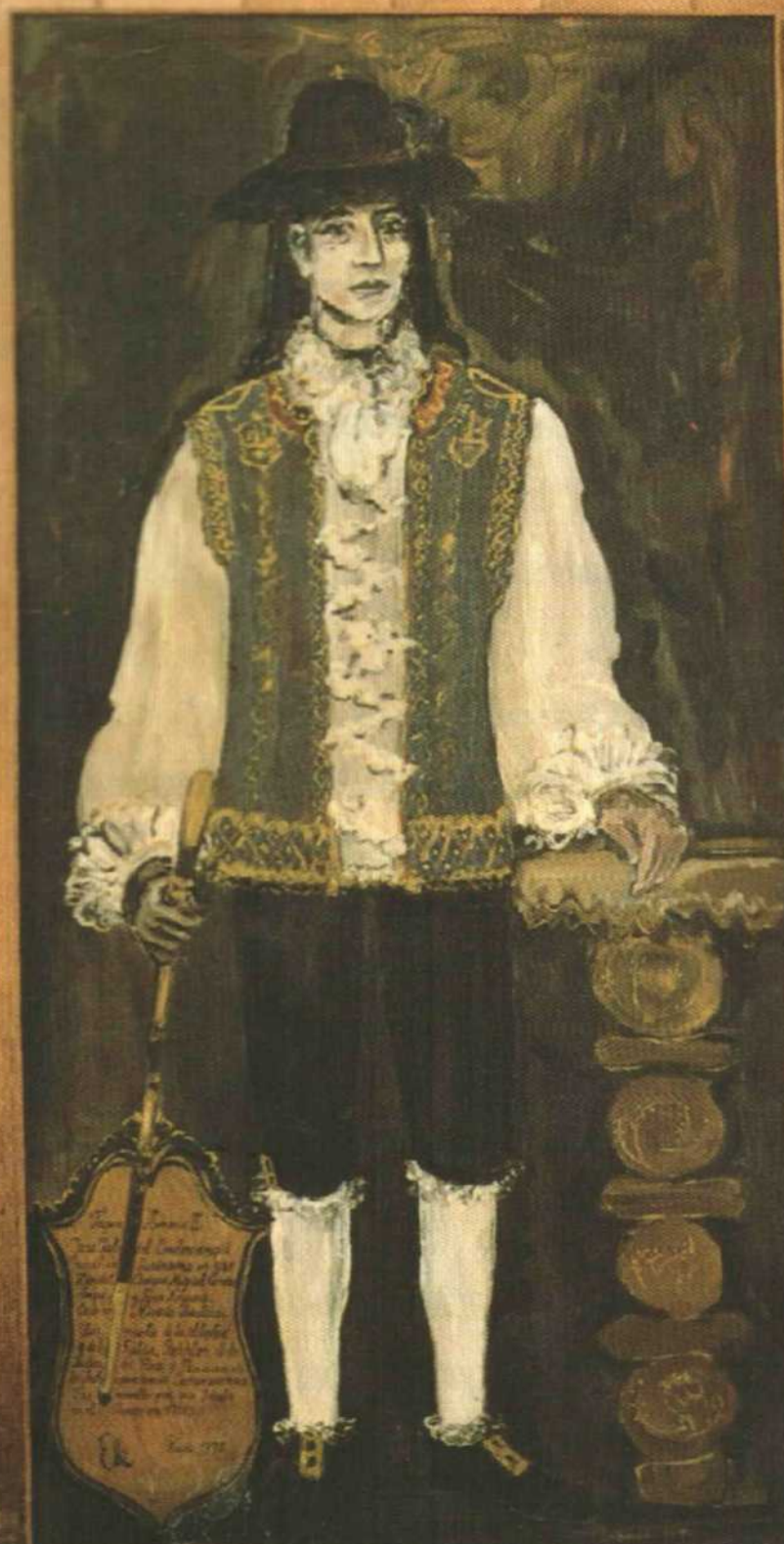
▲ Retrato de Túpac Amaru, el cacique que lideró la rebelión indígena que estalló en 1780.

20. ¿Por qué este autor cree que no es correcto ver el movimiento encabezado por el cacique indígena de Tinta como un antecedente de la Independencia?