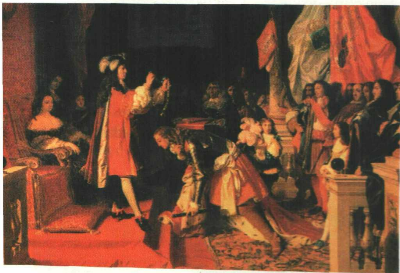
▲ Coronación de Felipe V de Anjou, el primero de los Borbones españoles.

Como consecuencia de ese acuerdo, los Borbones franceses lograron coronar a Felipe V como rey de España, pero este debió renunciar a suceder a su abuelo Luis XIV en el trono de Francia. Gran Bretaña, por su parte, obtuvo importantes posesiones en América del Norte y en el Caribe, así como una serie de ventajas y privilegios en el comercio con las colonias españolas en América (por ejemplo, el de introducir esclavos).