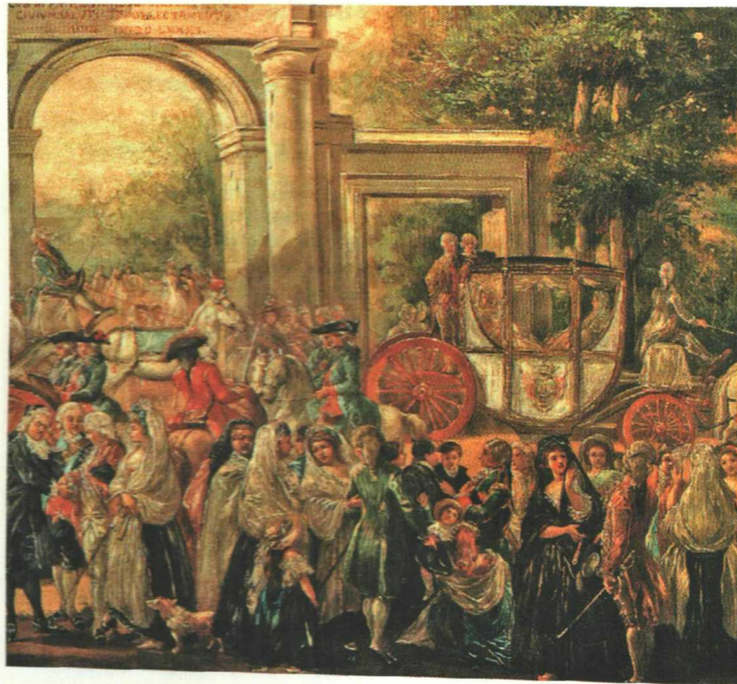
▲ Una fiesta pública frente al portal del Jardín Botánico de Madrid. Pintura costumbrista de Ramón Bayeu, que refleja los nuevos hábitos de una sociedad influida por las ideas de la Ilustración.

Pero fue la Ilustración la corriente intelectual que más influencia ejerció sobre estas reformas, especialmente en el valor concedido al conocimiento útil y en los intentos de mejorar la producción a través de las ciencias aplicadas, como en el caso de la agricultura.