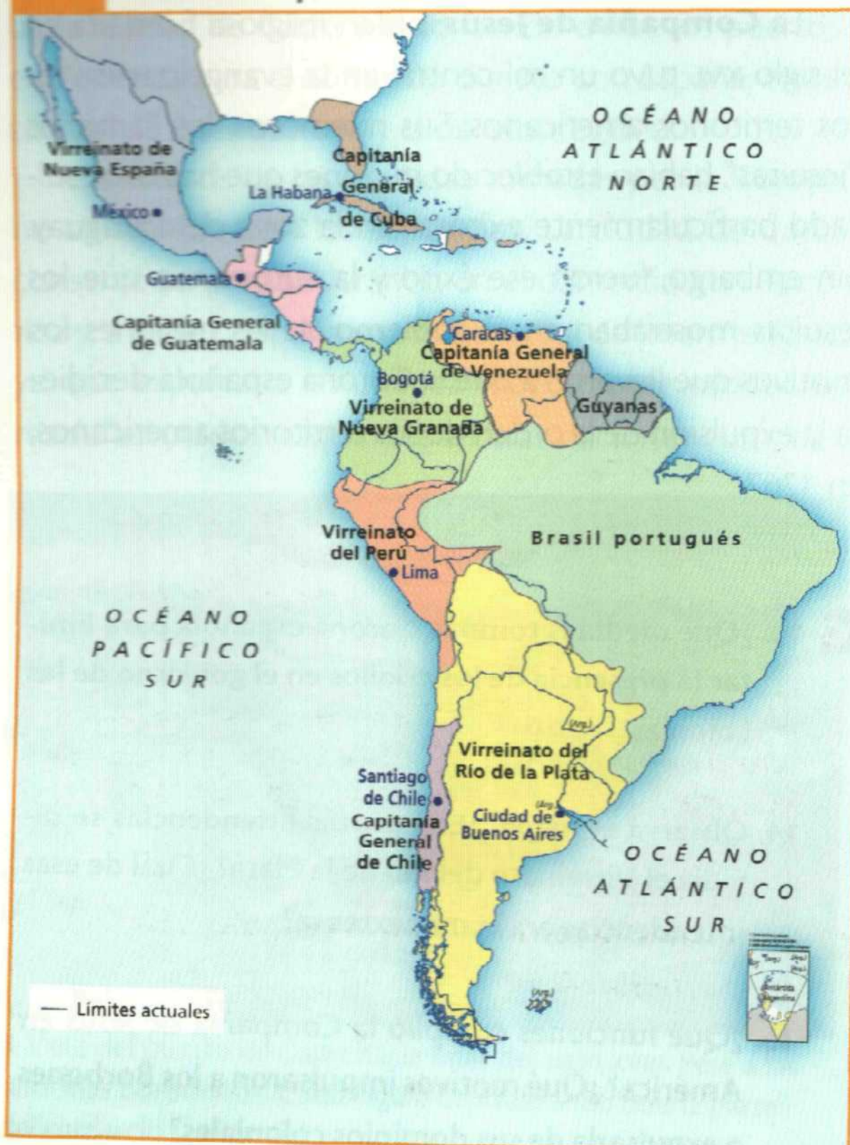
América después de las reformas borbónicas

Finalmente, estos cambios en las unidades administrativas coloniales buscaban reorientar a la América española hacia el eje del Atlántico , después de casi dos siglos de fuerte presencia tanto comercial como militar sobre el océano Pacífico.