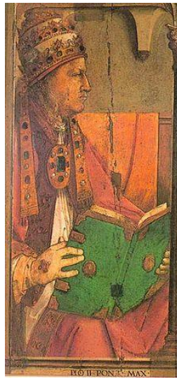
AENEAS SILVIUS PICCOLOMINI