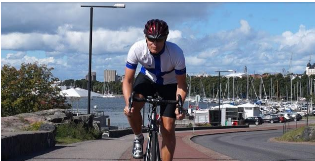
Pyöräillen paljon. Olen tahtoihminen Suomen ja suomalaisten puolesta. Taustallani kesäinen Helsinki.

kassa taustatahona jo pitkään. Motivaationi on erinomainen, en päästä itseäni vähällä, ja haluan tehdä kanssanne tulosta.