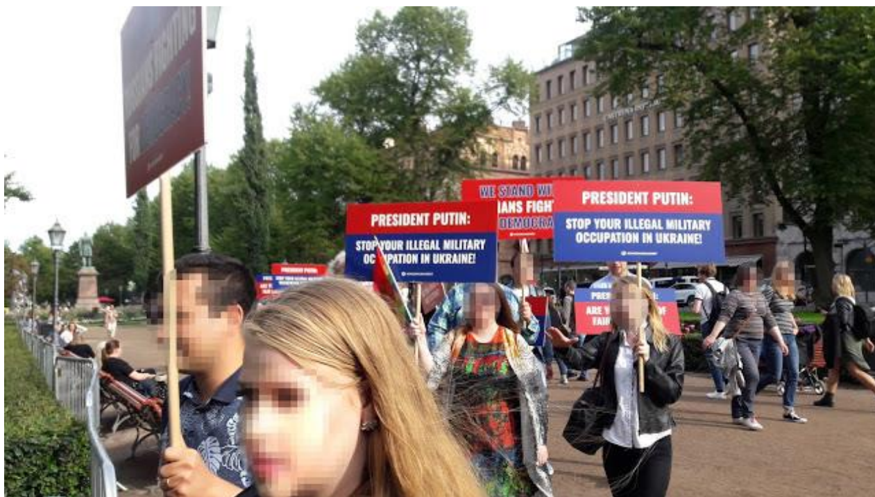
Suomessa ei tykätä Itä-Ukrainan eikä Krimin miehityksestä.

Otetaanpa jälleen muutama esimerkki. Putin sai vastalauseita läpi näkemyksensä, että Moskovan mielenosoitukset eivät poikkea mitenkään vastaavista ilmiöistä Euroopassa vaan ovat samanlaisia kuin vaikkapa keltaliivien mellakoinnit Ranskassa.