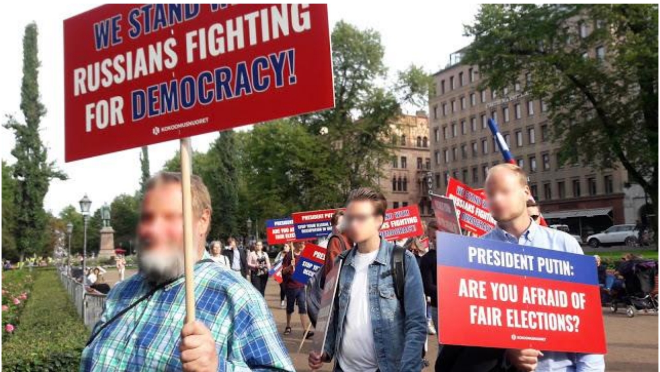
Suomessa tykätään vapaista vaaleista.

Asiat eivät ole ehkä Venäjällä niin huonosti, kuin usein annetaan ymmärtää. Mutta onhan se nyt suhteidemme jatkuvan ”kehittämisen ja lujittamisen” kannalta vaivaannuttavaa, että Putinin hallinto on pidätyttänyt viime aikoina noin kolme tuhatta mielenosoittajaa ja pitää edelleen Krimiä ja Itä-Ukrainaa hallussaan.