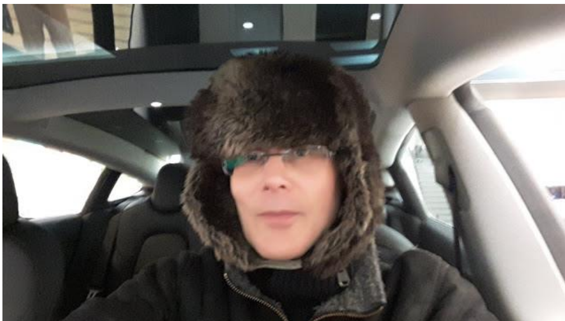
Sähköautossa voi tulla kylmä ilman karvalakkia.

Suomi on aivan liian pieni maa voidakseen vaikuttaa asiaan oikeasti, ja näin ollen jokainen sähköautoiluun sijoitettava lantti, jonka edistyspuolue Kokoomus asian hyväksi ammentaa veronmaksajien aarrearkusta, menee suomalaisten ihmisten kannalta hukkaan.