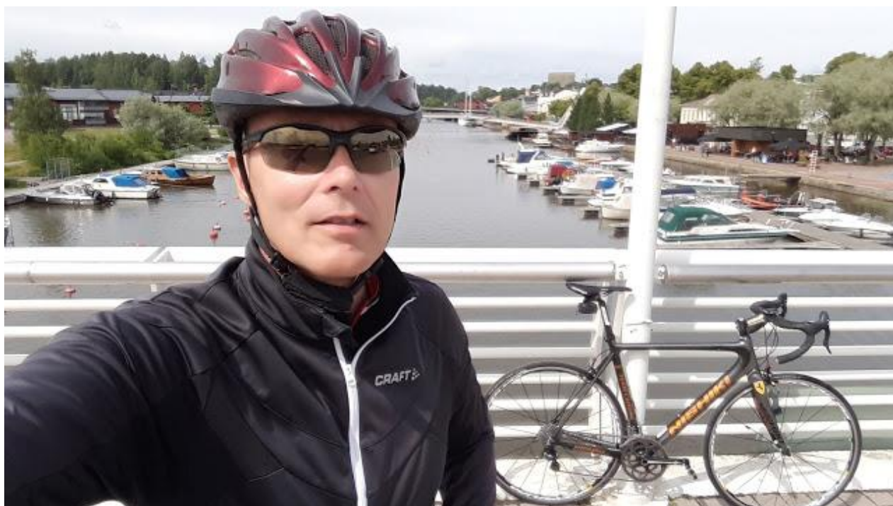
Porvoossa 2019. Olen pyöräillyt itseni päteväksi toimimaan vaikkapa vihervasemmiston neuvoa antavana valtiosihteerinä.

Kehitysapuun lapioidaan nyt vihreiden vaatimuksesta lisärahaa 72 miljoonaa, ja autoilijoita kuritetaan peräti neljännesmiljardin suuruisilla polttoaineverojen korotuksilla! 321 Pumppuhinnat nousevat tällöin yli 6 senttiä litralta. Tavallisten ihmisten kiusaamisella tässä huippukalliin autoilun ja pitkien etäisyyksien maassa ei ole ilmeisesti kerta kaikkiaan mitään rajaa. Työssäkäyntihalukkuutta tai -mahdollisuuksia se tuskin kasvattaa, mutta kotiinjäätipakkoa kyllä.