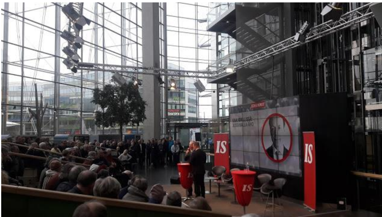
Jussi selkeyttää ja kirkastaa.

Myös oma läpimenoni voi olla pienestä kiinni, mihin viittaa tänään jul- kistettu vaalinumeroni 99 (muistakaa laittaa se äänestyslipukkeeseen oi- kein päin).