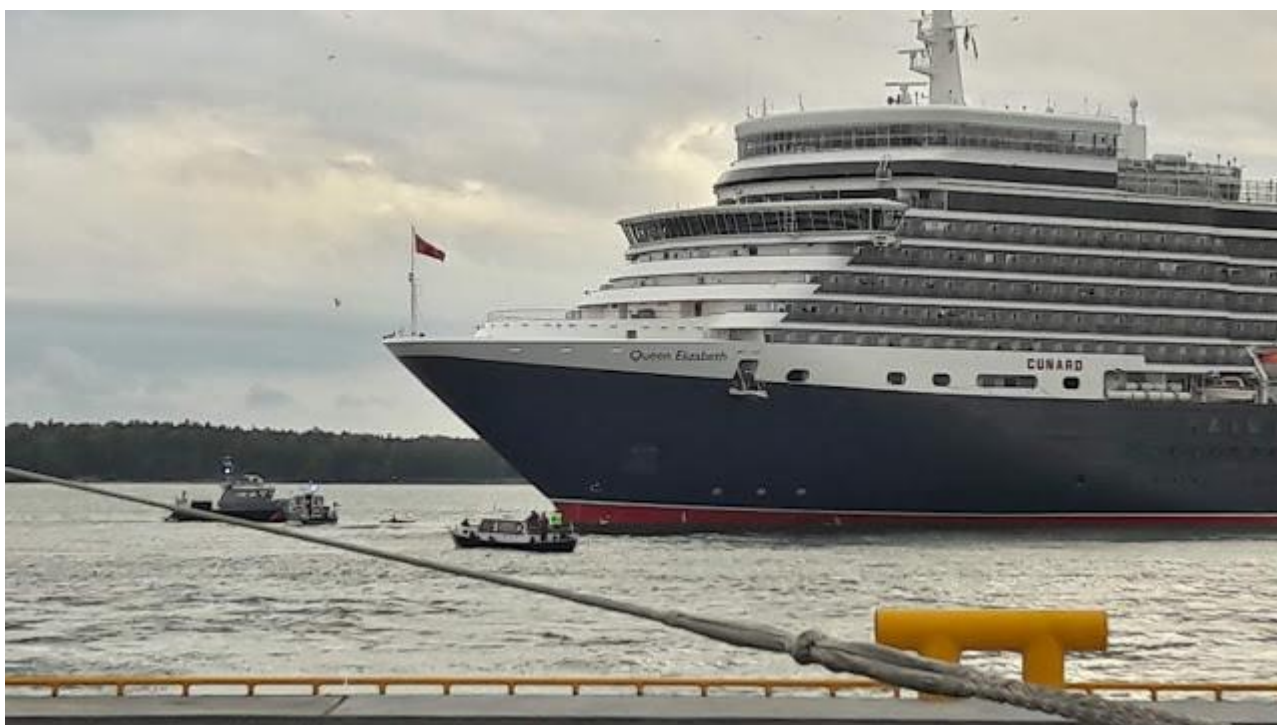
Ilmastopoliittiset ekoanarkisit kerjäävät huomiota Rajavartiolaitokselta, poliisilta ja QE:ltä Helsingissä.

Ilmastodemagogian tuloksista saatiin näyttöä keskiviikkona Hernesaar- ren satamassa, kun ekoanarkistit terrorisoivat kanooteillaan luksuslaiva Queen Elizabethin lähtöä estäen siten brittiläisiä demarieläkeläisiä pää- semästä humppamaan Estonia-hautojen yli. Muuta vaikutusta tempauk- sella ei juuri ollut. – Ikäihmiset, laittakaahan tilkkanen kauramaitoa kah- viinne, sillä punainen maito vaarantaa luonnon ja terveyden!