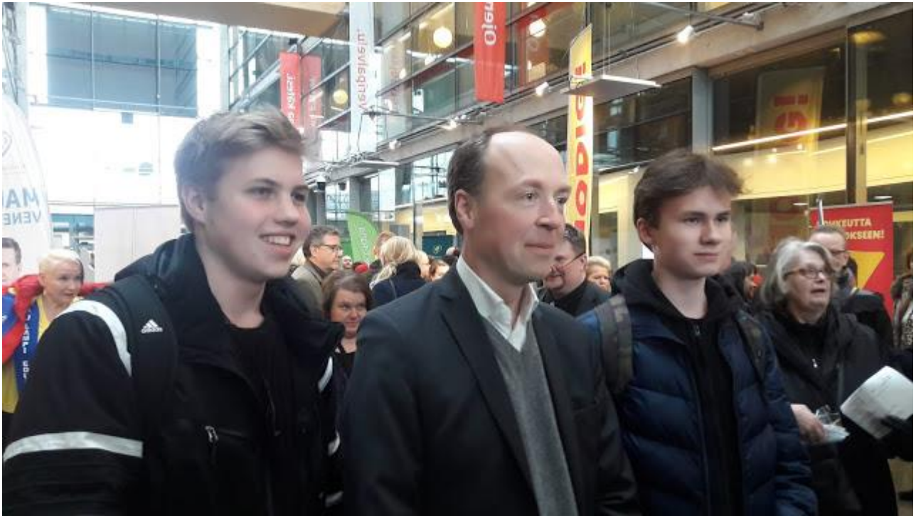
He seisovat urheasti kovennettua.