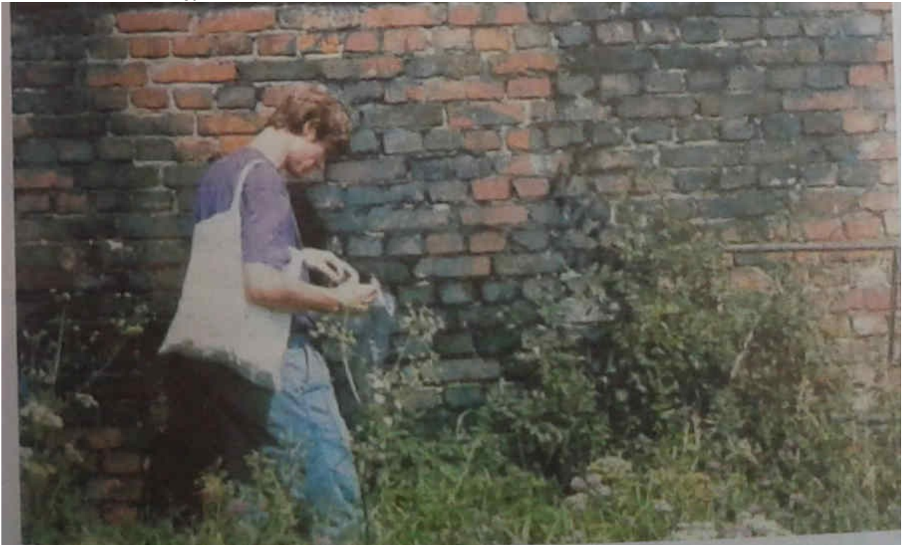
A birkenai 5b épület fertőtlenítő kamrájának külső fala. A téglafal sötétkék elszíneződést mutat, mivel a cián-hidrogén az idők folyamán áthatolt a falon, és a vassal reakcióba lépve egy festékanyagot képezett, amely ellenállt 50 év időjárási behatásainak.