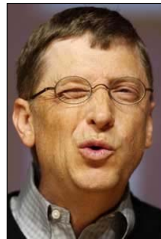
Bill Gates, reichster Mann der Welt, investiert in Aktien !