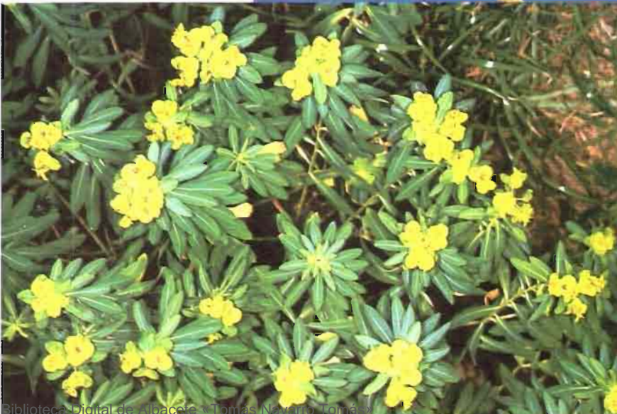
29. Euphorbia squamigera Loisel