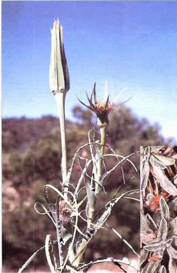
22. Convolvulus boissieri Steudel