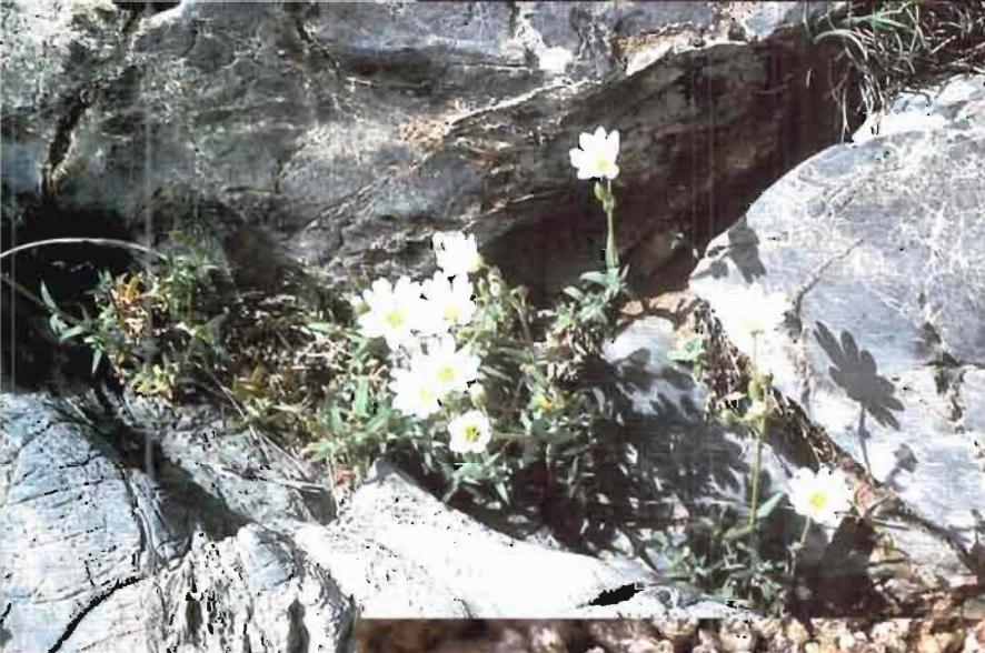
14. Paronychia aretioides Puorret ex DC.