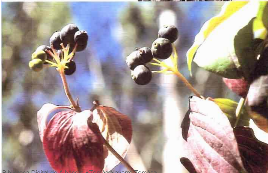
23. Cornus sanguinea L. subsp. sanguinea