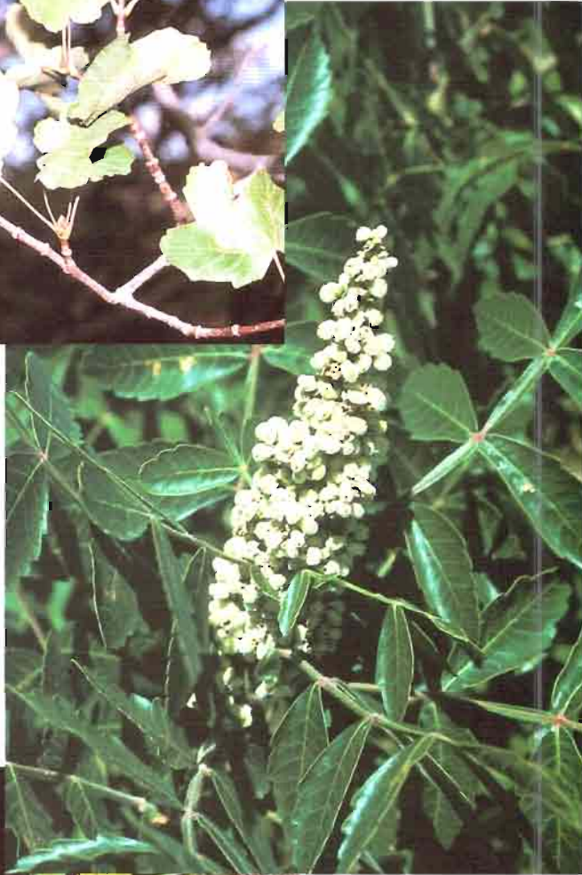
5. Rhus coriaria L.