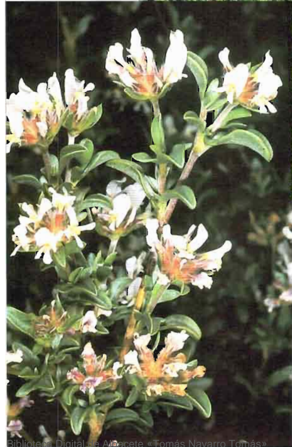
41. Anthyllis lagascana Benedi