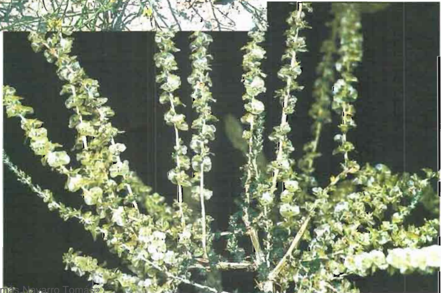
26. Salsola vermiculata L.