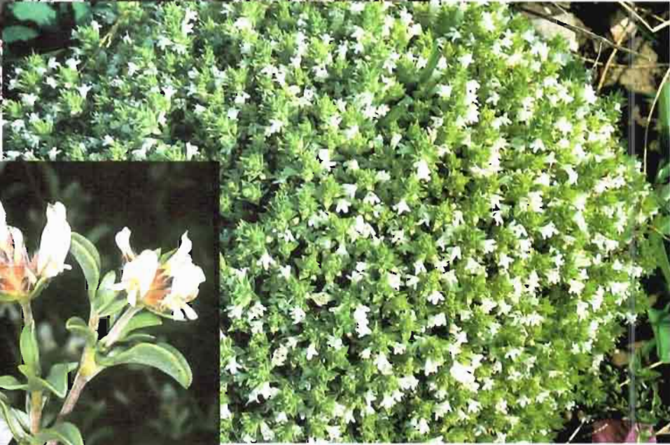
40. Thymus sabulicola Coss.