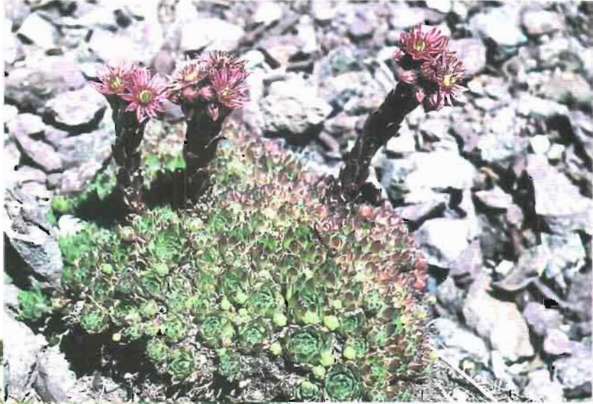
24. Sempervivum tectorum L.