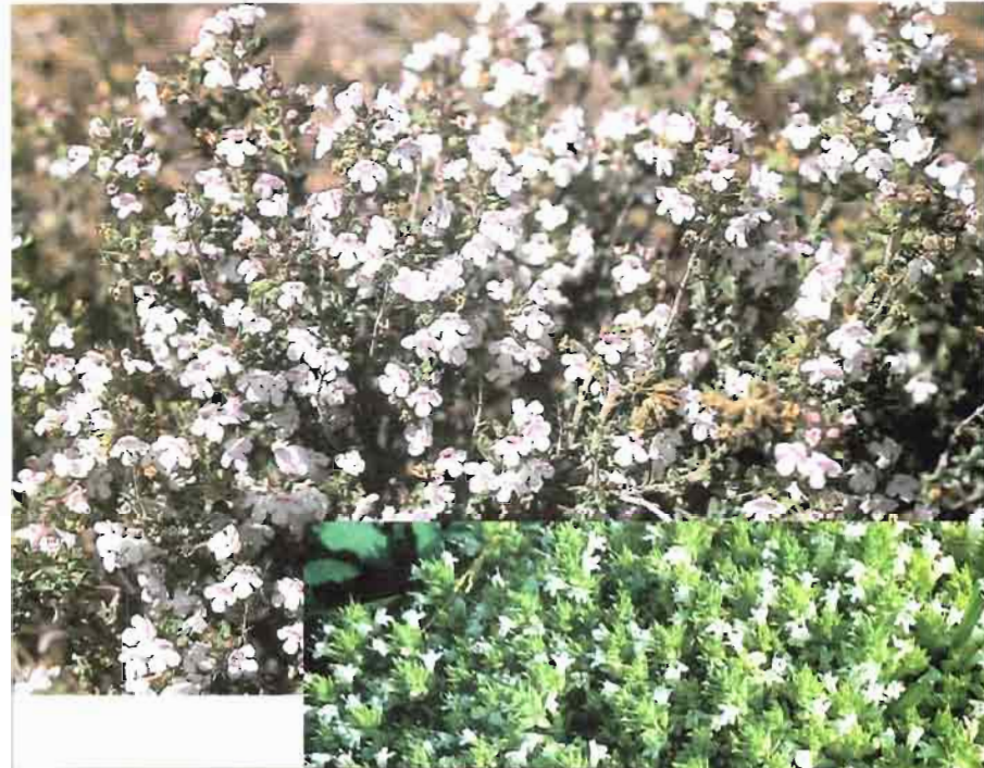
39. Thymus orospedanus Huguet del Villar