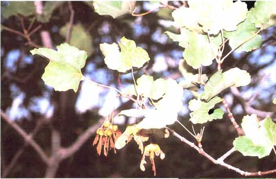
4. Acer granatense Boiss.