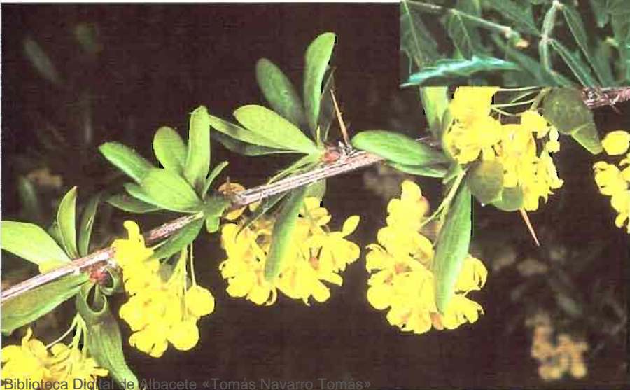
6. Berberis vulgaris L. subsp. australis (Boiss.) Heywodd