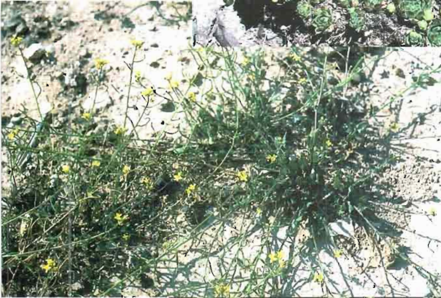
25. Lycocarpus fugax (Lag.) O.E. Schultz in Engl.