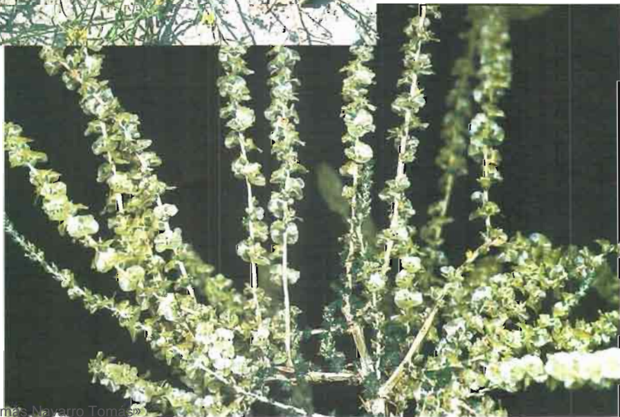
26. Salsola vermiculata L.